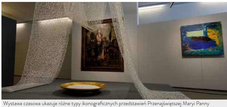
Wystawa czasowa ukazuje różne typy ikonograficznych przedstawień Przenajświętszej Maryi Panny

„Odziana w biel” to tytuł, przygotowanej przez Sanktuarium Fatimskie, wystawy czasowej, która upamiętnia setną rocznicę powstania figury Matki Boskiej, czczonej w Kaplicy Objawień. Ekspozycja, odważnie podejmująca refleksję dotyczącą relacji między sztuką a religią, prezentuje wiele pięknych wizerunków Najświętszej Maryi Panny.