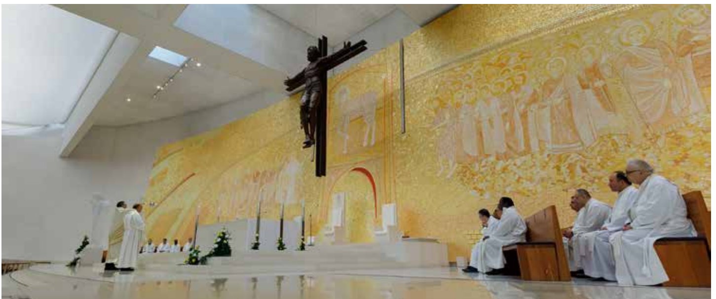
W Mszy św. uczestniczyły pielgrzymki z różnych portugalskich parafii

12 października 2007 r. kościół Trójcy Przenajświętszej poświęcił kardynał Tarcisio Bertone, ówczesny sekretarz stanu Stolicy Apostolskiej i legat papieża Benedykta XVI na uroczystość zakończenia obchodów 90. rocznicy objawień Matki Boskiej trojgu widzącym pastuszkom.