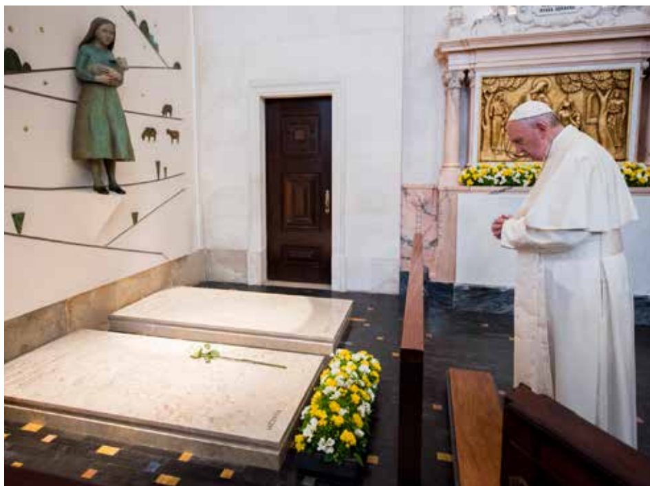
Modlitwa w intencjach Ojca Świętego jest stale obecna w Sanktuarium Fatimskim

Miłość do Matki Boskiej i Najświętszego Serca Jezusa sprawiła, że Hiacynta