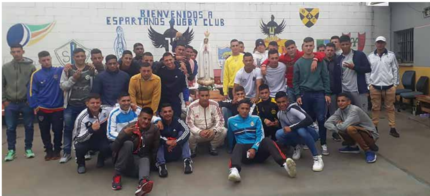
Więźniowie wzięli udział w nabożeństwie maryjnym zorganizowanym w zakładzie karnym

Figura nr 10 peregrynuje w Argentynie