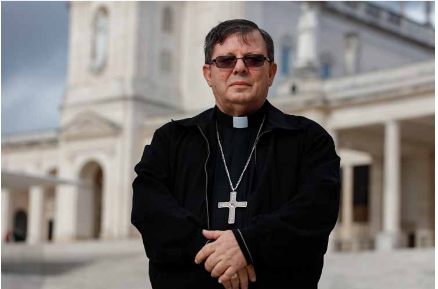
Brazylijski biskup regularnie odwiedza Sanktuarium Fatimskie i czuje się tu „jak w domu”