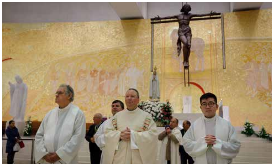
Grudniowa pielgrzymka była pierwszą w nowym roku duszpasterskim

Papież Franciszek odwiedził Sanktuarium Fatimskie w dniach 12 i 13 maja 2017 r.