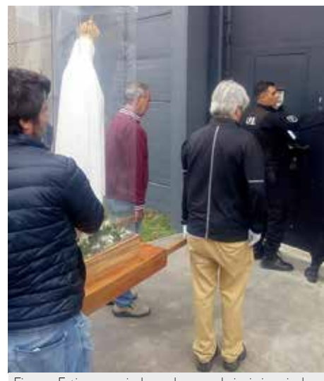
Figura z Fatimy przyniosła osadzonym ukojenie i pociechę