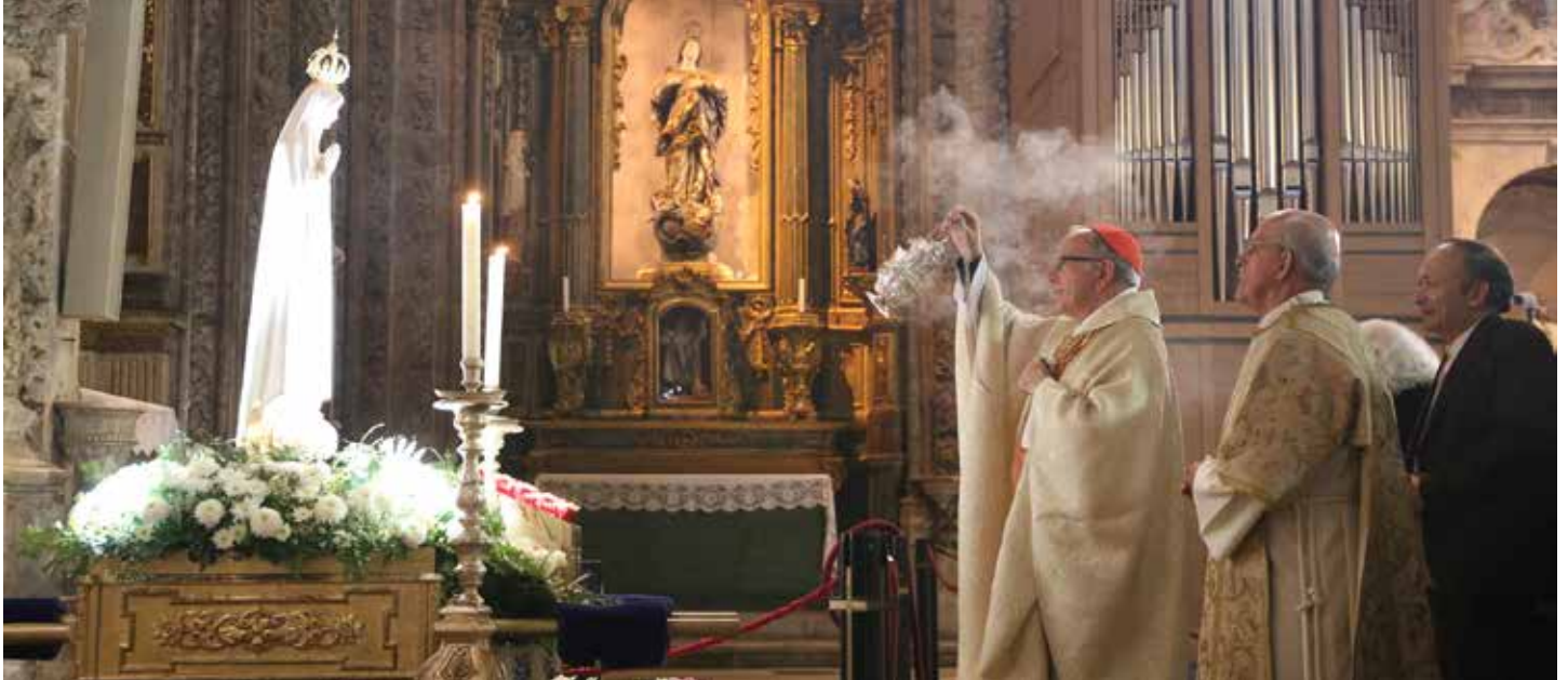
Peregrynacja służyła pogłębieniu wiedzy o orędziu fatimskim

Trwająca od 29 września do 3 listopada 2019 r. peregrynacja przebiegała pod hasłem „Maryja, Królowa Misji”