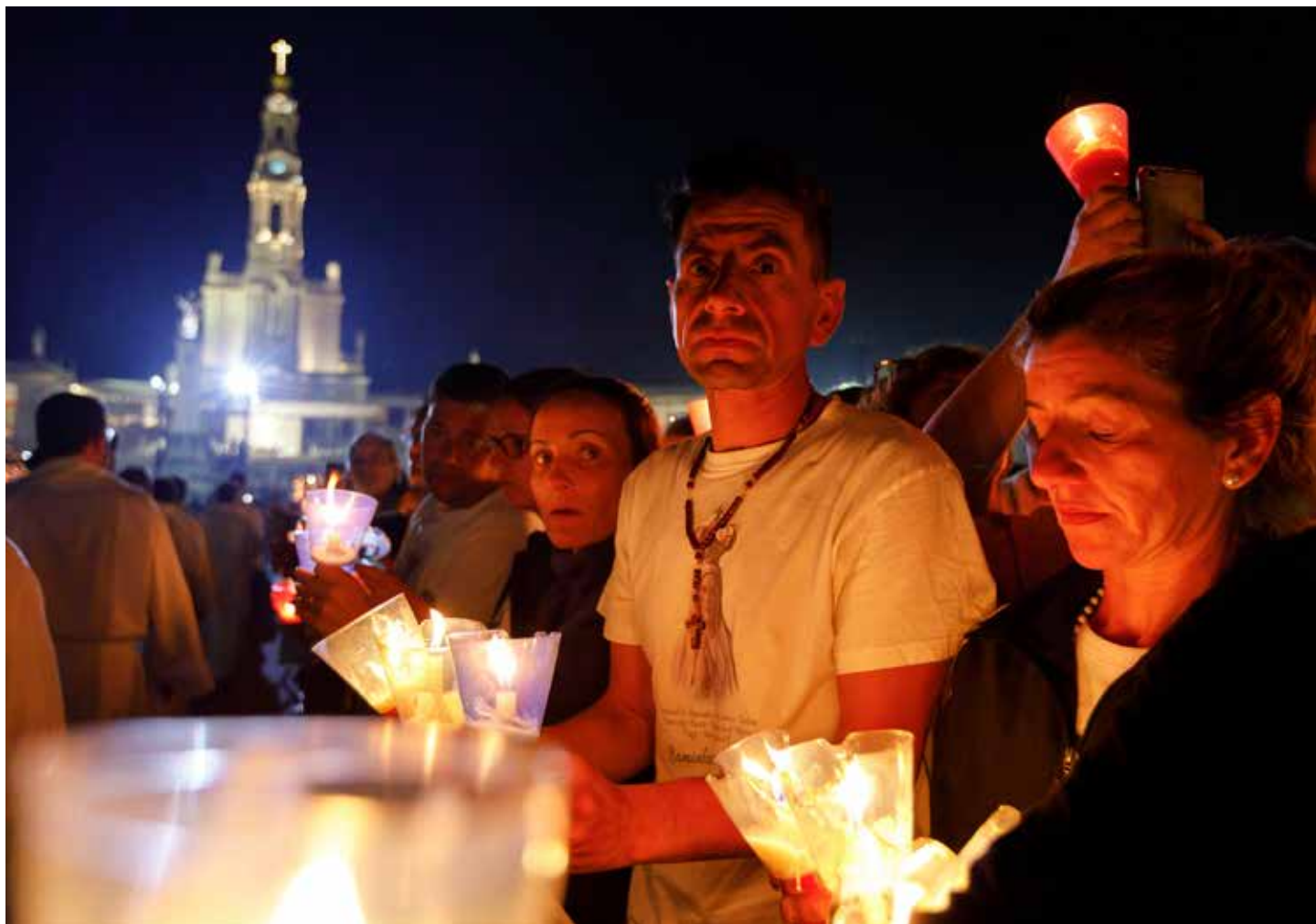
Do Sanktuarium Fatimskiego przybywają tysiące wiernych z całego świata – najwięcej pielgrzymów bierze udział w procesji ze świecami

Podsumowanie najważniejszych wydarzeń roku duszpasterskiego 2018/2019, w którym Sanktuarium Fatimskie dziękowało za pielgrzymowanie we wspólnocie Kościoła