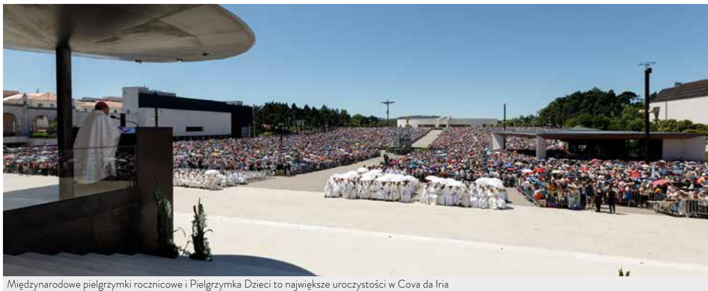
Międzynarodowe pielgrzymki rocznicowe i Pielgrzymka Dzieci to największe uroczystości w Cova da Iria

Według wstępnych danych z października, w pierwszych dziewięciu miesiącach 2019 r. Sanktuarium Fatimskie odwiedziło około 4,5 miliona pielgrzymów , którzy uczestniczyli w 7.658 oficjalnych i prywatnych nabożeństwach. Liczby ukazują utrzymującą się od kilku lat wzrostową tendencję dotyczącą grup z Azji, coraz większą obecność pielgrzymów z kontynentu afrykańskiego oraz tradycyjnie znaczącą liczbę wiernych z Ameryki Łacińskiej.