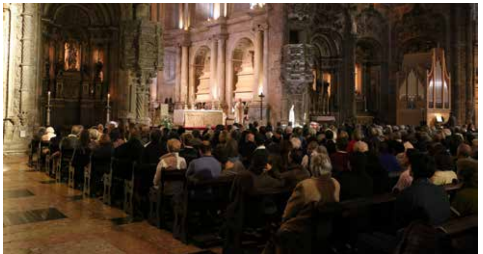
Uroczyste pożegnanie figury pielgrzymującej odbyło się w klasztorze hieronimitów w Lizbonie

Na Eucharystii i uroczystości pożegnania figury obecny był prezydent Portugalii Marcelo Rebelo de Sousa.