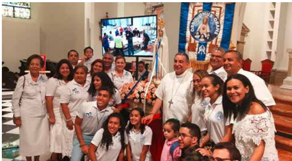
Panamscy katolicy czczą Matkę Boską Różańcową

Rok temu w Panamie odbyły się Światowe Dni Młodzieży 2019