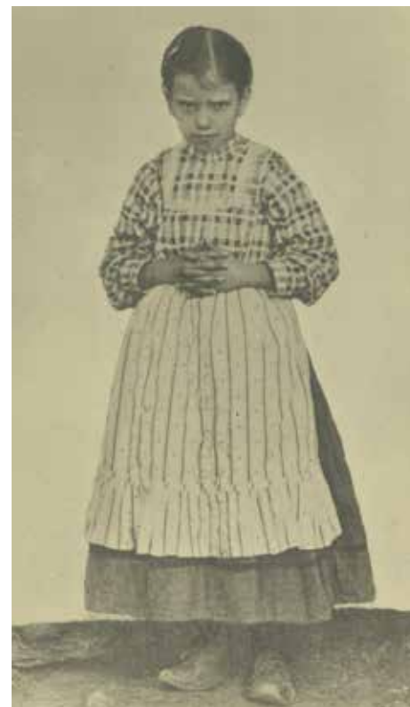
Modlitwa to najważniejszy element obchodów setnej rocznicy śmierci Hiacynty