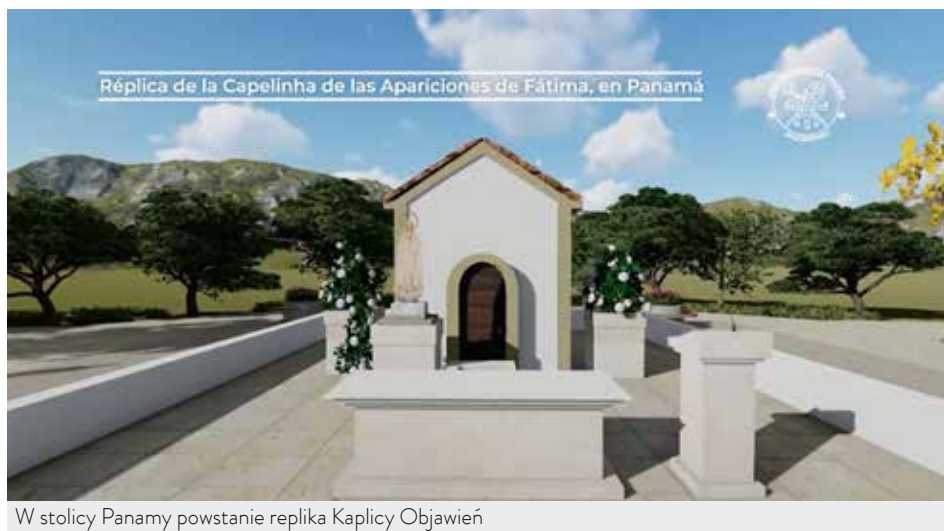
W stolicy Panamy powstanie replika Kaplicy Objawień