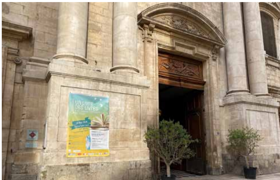
W czwartej edycji targów książki katolickiej w Tulonie uczestniczyła delegacja Sanktuarium Fatimskiego

Czwarta edycja targów książki katolickiej w Tulonie