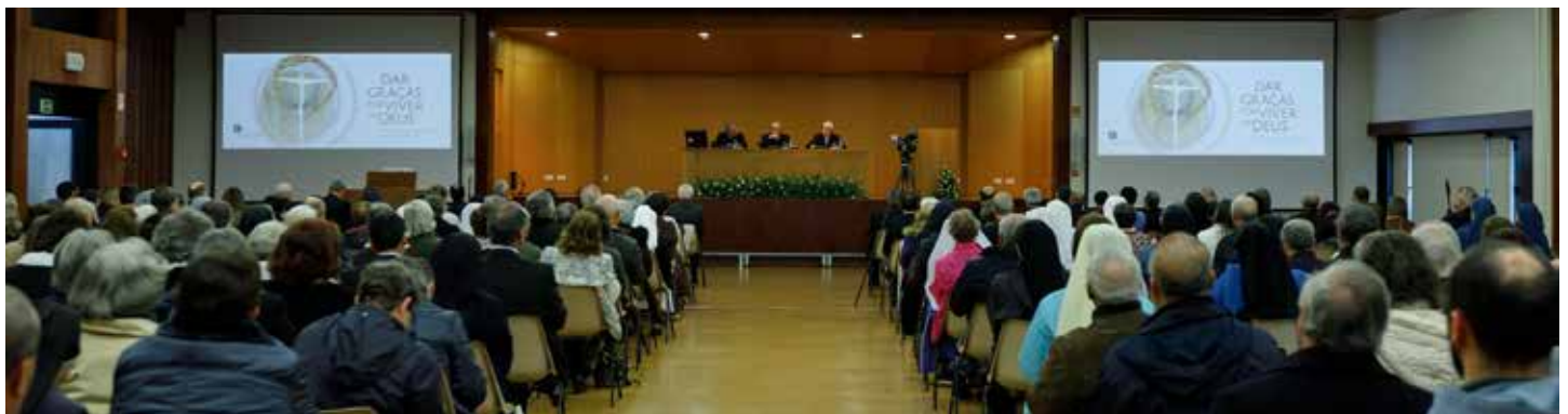
Prezentacja tematu nowego roku duszpasterskiego odbyła się 30 listopada 2019 r.

Sesję inaugurującą rok duszpasterski poprzedziło otwarcie wystawy czasowej zatytułowanej „Odziana w biel”, upamiętniającej stulecie powstania pierwszej figury Matki Boskiej Fatimskiej. Podczas tegorocznej uroczystości wolontariusze współpracujący z Sanktuarium Fatimskim po raz pierwszy mieli okazję złożyć lub odnowić „Zobowiązanie Wolontariusza”, które jest najwyższym wyrazem ofiarowania życia Bogu oraz gotowości służenia drugiemu człowiekowi.