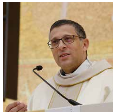
Wicerektor Sanktuarium przestrzegał przez „lenistwem i apatią w wierze”