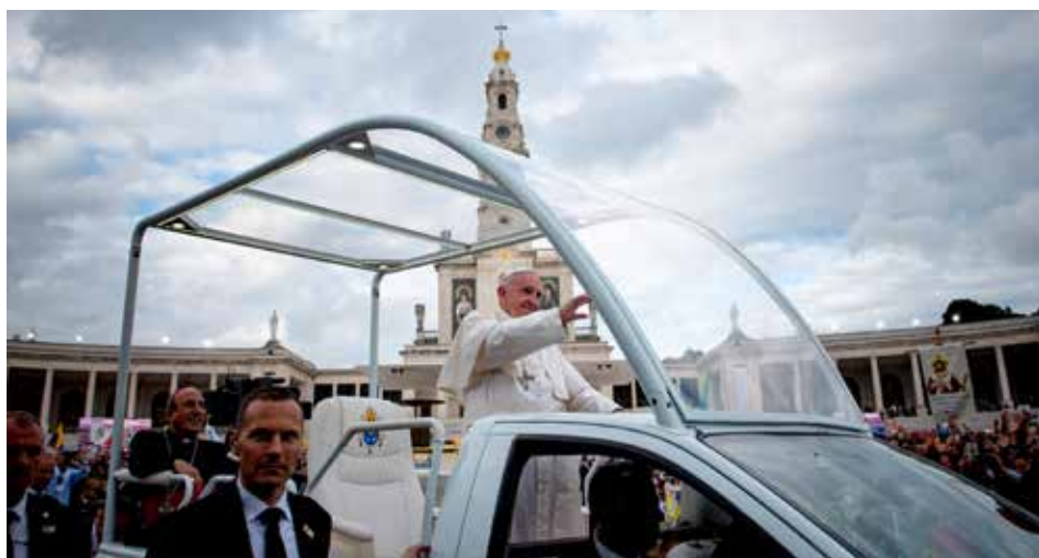
Ojciec Święty Franciszek był czwartym papieżem, który odwiedził Fatimę

arium Fatimskie w dniach 12 i 13 maja 2017 r. Podczas 22-godzinnej podróży apostolskiej z okazji stulecia objawień Matki Boskiej, Ojciec Święty przewodniczył Mszy św. kanonizacyjnej