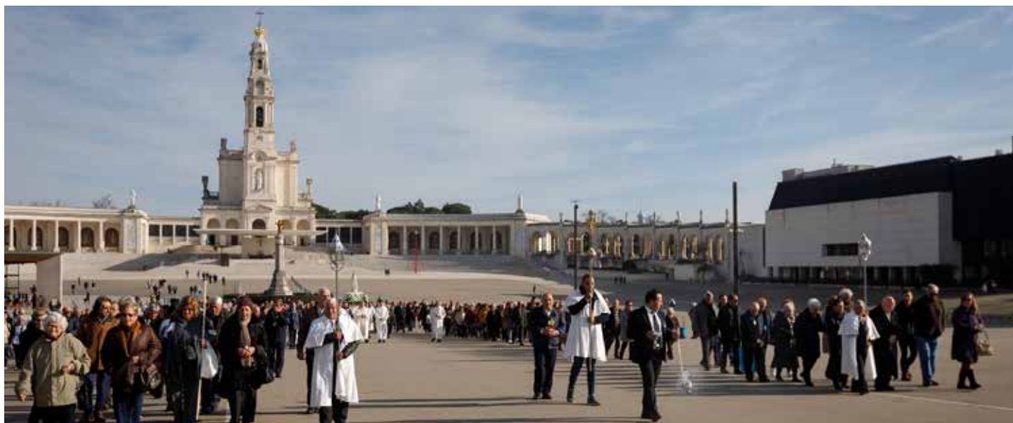
Pielgrzymi odmówili różaniec, a potem przeszli w procesji do bazyliki Trójcy Przenajświętszej

W Mszy św. wotywniej o Matce Boskiej uczestniczyli przedstawiciele różnych ruchów modlitewnych, między innymi członkowie grupy „Amigos de Maria” („Przyjaciele Maryi”) z diecezji Coimbrzy.