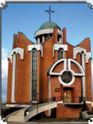
Santuario de Nuestra Señora de Fátima en Wrocław, Polonia