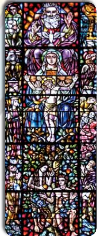
“El árbol de la vida”, propiedad del Seminario del Verbo Divino.

Recuérdese que, con ocasión de la realización del Congreso Teológico Internacional “Figuras del Ángel revisitadas”, en octubre de 2006, el mismo museo, acogió, de octubre a final de marzo de 2007, una exposición de iconografía angélica titulada “Soy el Ángel de la Paz”. Esta muestra fue visitada por 3.275 personas.