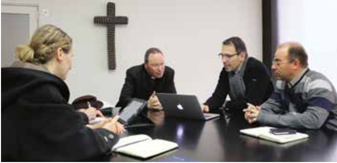
Organisateurs de rencontre internationale ARS en visite au Sanctuaire de Fatima

Le Sanctuaire de Fatima accueillera le congrès et l'assemblée générale de l'Association (française) des Recteurs de Sanctuaires, en janvier 2017.