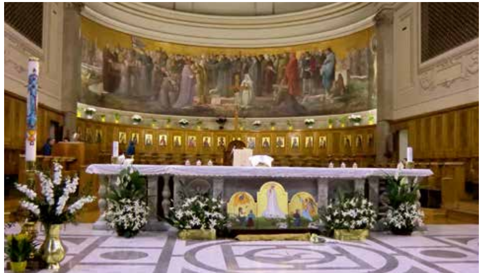
La basilique de Sant'Antonio al Laterano célèbre la journée des Petits Bergers

Une catéchèse sur Jacinthe, un autre protagoniste de l'histoire des Apparitions