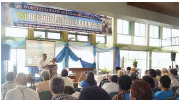
Le congrès a accueilli des centaines de personnes provenant de plusieurs pays

L'Apostolat Mondial de Fatima a réalisé son premier congrès sur le Message de Fatima destiné à la région de l'Océanie, dans l'archidiocèse de Suva, les Îles Fidji, du 26 au 29 novembre 2015. Le thème général de cette rencontre, pendant les quatre jours, a été «La nouvelle évangélisation de l'Océanie et l'urgence de vivre et de diffuser le message de Fatima». Cet événement a réuni des centaines de personnes dévotes de Notre-Dame, provenant des Îles Fidji et de certains pays voisins, comme l'Australie, le Samoa, Salomon, les Samoa Américaines et des représentants de pays plus lointains tels que les Philippines, les États-Unis, le Portugal et Puerto Rico.