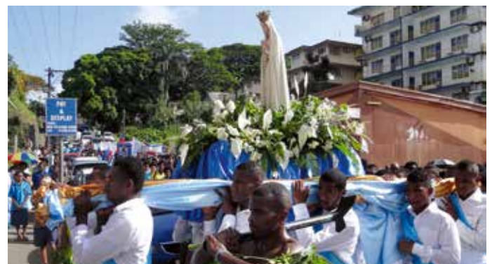
Lors de l'ouverture du congrès, la statue a été portée par un groupe de jeunes

Nuno Prazeres Apostolat Mondial de Fatima