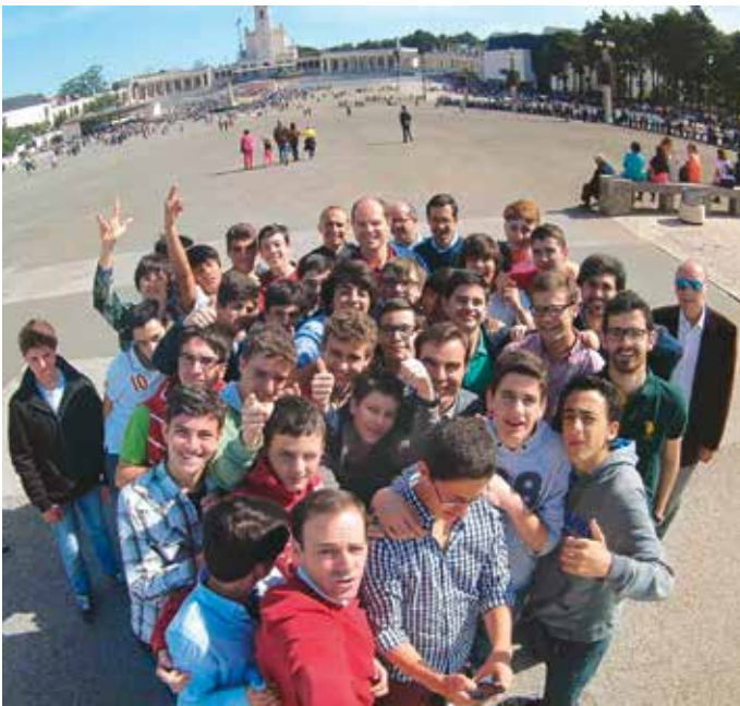
Jeunes de Opus Dei participent à rencontre annuelle de la Semaine Sainte

M eeting International de Fatima – MIF – est une rencontre de jeunes qui a lieu pendant la Semaine Sainte, à Fatima, où les jeunes développent un ensemble d'activités sportives et culturelles.