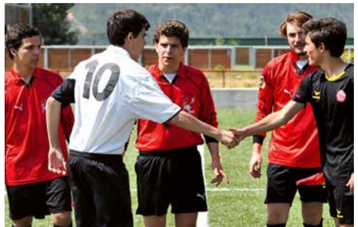
Activités spirituelles intercalées par des activités ludiques et sportives

Au cours de la semaine, ils ont effectué de nombreuses activités telles que le football, le futsal, le basket-ball, des films, des jeux de quiz sur l'Europe et la Littérature. Ces jeunes ont également visité des maisons pour les personnes âgées et le Centre Jean-Paul II de soutien pour les personnes gravement handica-