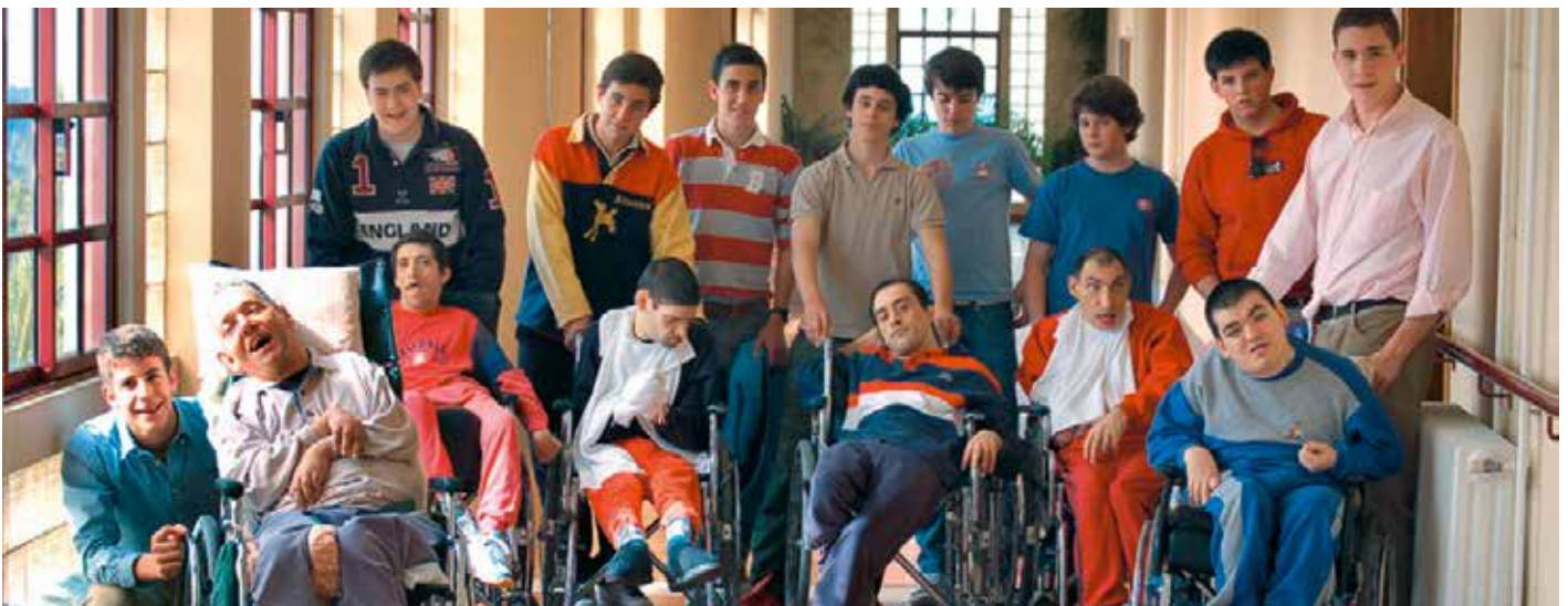
Centre Jean-Paul II, un des lieux visités par les jeunes