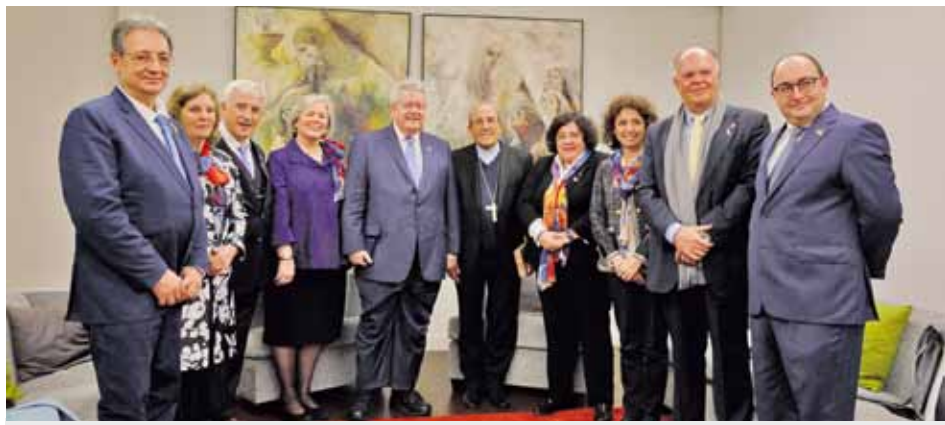
Prowadzone przez rotarian dzieła to przykład „widzialnego oblicza Boga”

„Fatima była zawsze światłem nadziei na burzenie murów. Dlatego narody Europy Wschodniej odczuwają szczególną wdzięczność, która prowadzi je do Cova da Iria”, powiedział wicerektor Sanktuarium Fatimskiego.