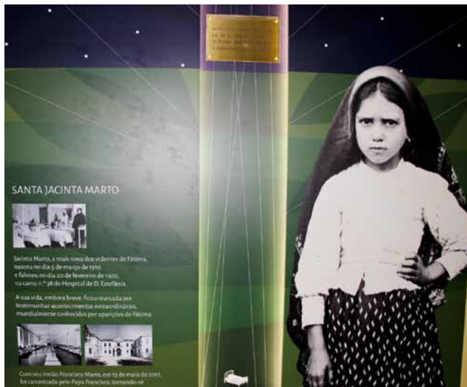
Tablica pamiątkowa w szpitalu Dona Estefânia, gdzie zmarła najmłodsza widząca – ofiara epidemii grypy „hiszpanki”

W setną rocznicę śmierci św. Hiacyncy odsłonięto tablicę pamiątkową w szpitalu Dona Estefânia w Lizbonie / Carmo Rodeia