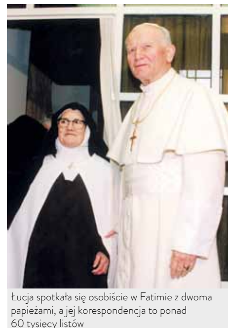
Łucja spotkała się osobiście w Fatimie z dwoma papieżami, a jej korespondencja to ponad 60 tysięcy listów

Łucja jest wielką kobietą, wielką świętą! A źródłem jej świętości jest zanurzenie się w miłości Boga Ojca, Syna i Ducha Świętego oraz zgoda na przemianę serca poprzez obcowanie z Sercem Jezusa i Sercem Maryi; dzięki temu Łucja mogła dotrzeć do serc wszystkich ludzi. Dlatego, nie uprzedzając oczywiście osądu Kościoła, jestem osobiście przekonany o jej świętości. I dlatego im lepiej ją znam, z tym większym entuzjazmem robię to, co robię.