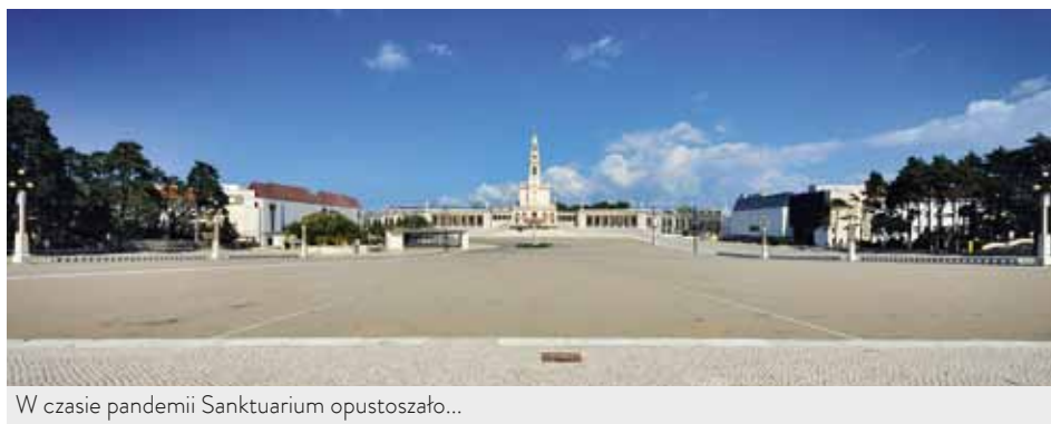
W czasie pandemii Sanktuarium opustoszało...

Kard. António Marto będzie przewodniczył uroczystościom transmitowanym przez środki masowego przekazu, media cyfrowe i społecznościowe