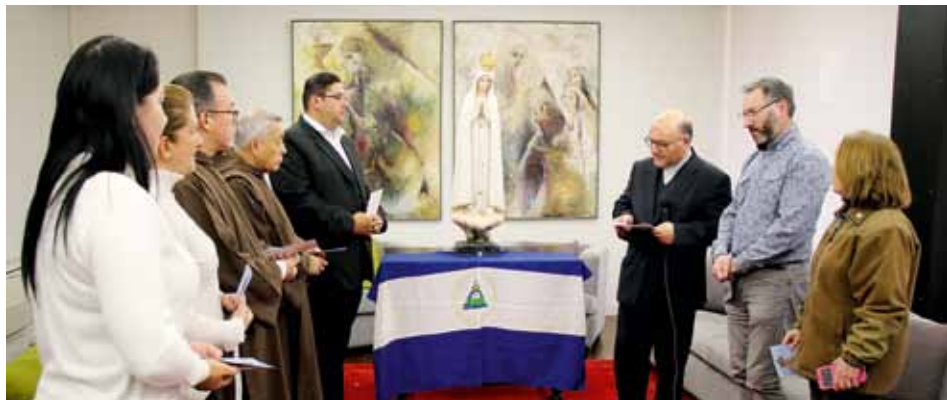
Rok 2020 jest w tym kraju Ameryki Środkowej Rokiem Świętym poświęconym Maryi

25 stycznia fatimską figurę pielgrzymującą nr 6 powitano w katedrze metropolitalnej w Managui / Carmo Rodeia