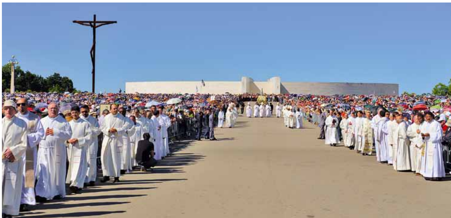
Najwięcej pielgrzymów uczestniczy w wielkich międzynarodowych pielgrzymkach rocznicowych

Statystyki wskazują ustabilizowany poziom odwiedzin Sanktuarium po stuleciu objawień / Carmo Rodeia