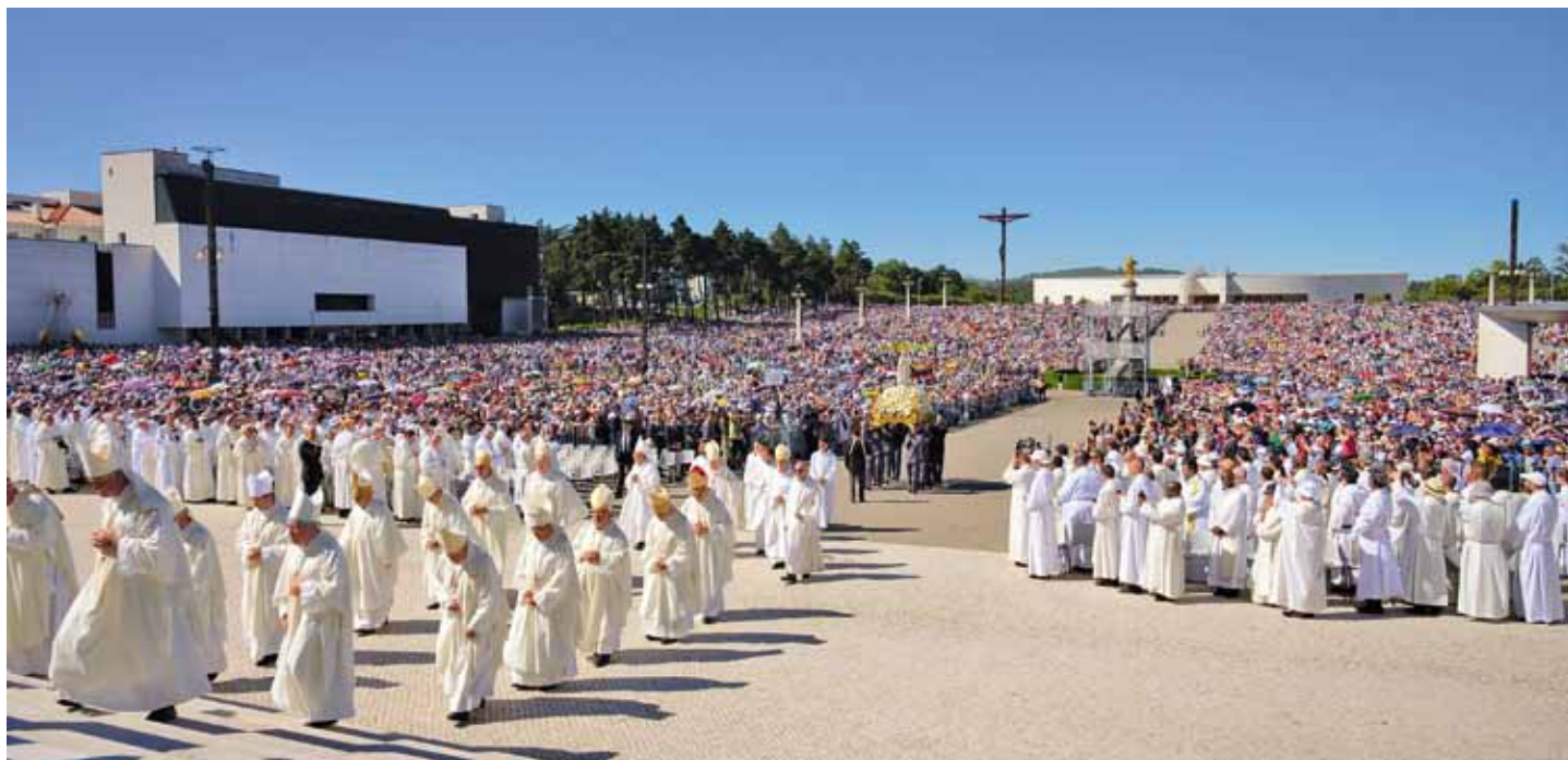
Sanktuarium Fatimskie oczekuje, że w lecie do Cova da Iria przyjedzie wiele grup pielgrzymkowych

Sanktuarium przygotowuje się do międzynarodowych pielgrzymek rocznicowych, które w tym roku duszpasterskim zapraszają pielgrzymów do dziękczynienia za życie w Bogu