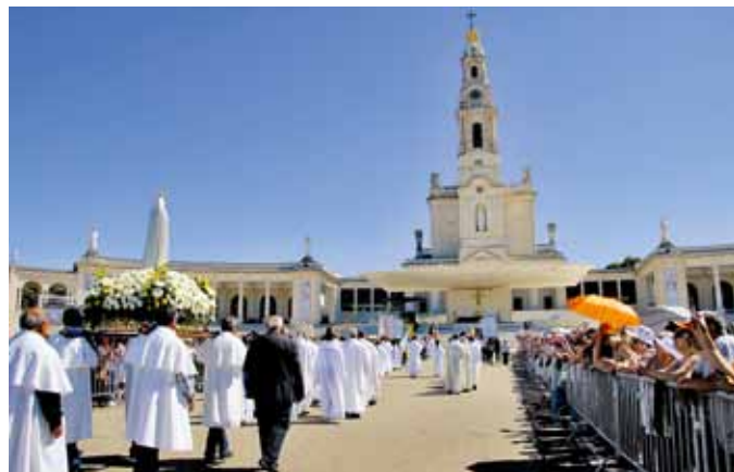
Włosi są trzecią, co do liczebności (po Portugalczykach i Hiszpanach), europejską nacją pielgrzymującą do Cova da Iria

odpowiedzialne za organizację włoskich pielgrzymek. Instytucja ta posiada kilka komisji, których zadaniem jest analiza doświadczeń i tworzenie nowych rozwiązań dla pielgrzymek i turystyki religijnej, postrzeganych w chrześcijańskiej perspektywie jako podróże wiary oraz działanie na rzecz usprawniania relacji pomiędzy organizatorami pielgrzymek a sanktuariami oraz agencjami turystycznymi i hotelarzami.