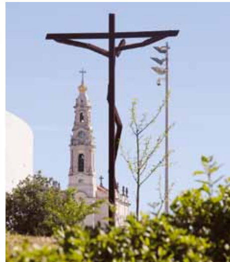
Fatima to bardzo gościnne miejsce!

Przypomnijmy, że Fatima była gospodarzem takiego spotkania w roku 2017 r., w którym obchodzono setną rocznicę objawień w Cova da Iria; wzięło w nim udział około 150 osób.