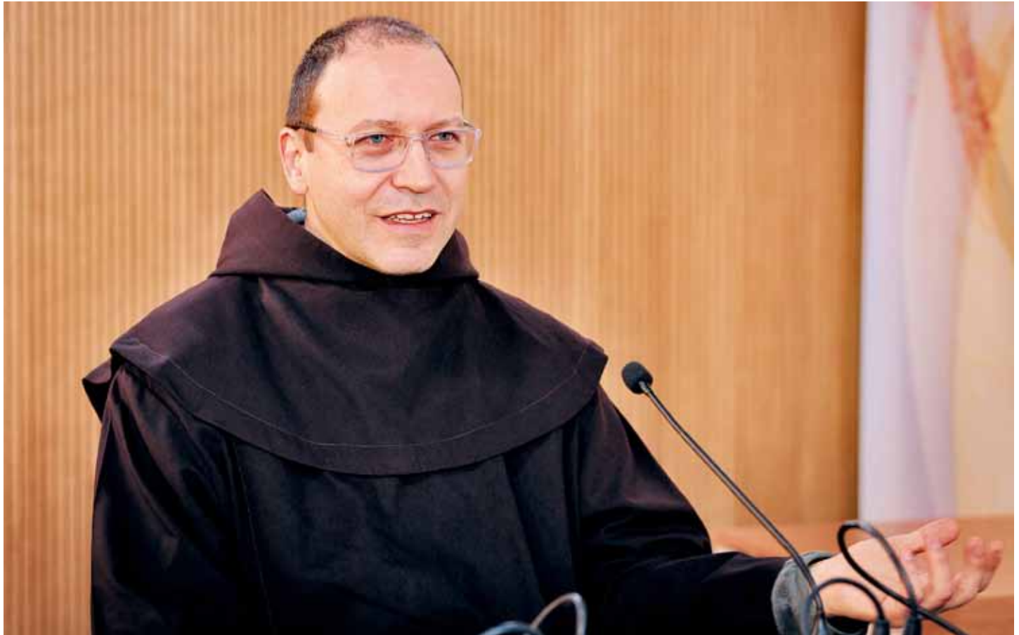
Postulator procesu kanonizacyjnego siostry Łucji uważa, że poznanie życia widzącej z Fatimy przyczynia się do rozwoju duchowości karmelitańskiej