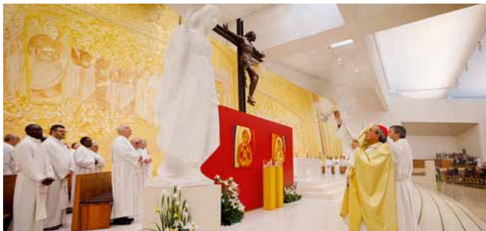
Świętą Hiacyncę stawiano za wzór współczucia dla społeczeństwa, w którym ludzie najłatwiej są odrzucani

W styczniu 1920 r. Hiacyncę Marto zawieziono do Lizbony, do szpitala Dona Estefânia. Zmarła tam 20 lutego 1920 r. 1 maja 1951 r. jej doczesne szczątki złożono w bazylice Matki Boskiej Różańcowej w Sanktuarium Fatimskim.