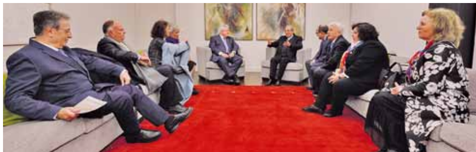
Priorytetem działalności rotarian są zapomniane i peryferyjne rejony świata

Rotary International to światowe stowarzyszenie klubów Rotary . Gromadzą one wolontariuszy, którzy odznaczając się wysokimi wartościami etycznymi, niosą pomoc humanitarną potrzebującym i działają na rzecz globalnego pokoju. Na świecie działa ponad 34 tysiące klubów Rotary , które zrzeszają około 1,2 mln członków z 200 krajów. Organizacja ta powstała w 1905 r w Chicago (Stany Zjednoczone) z inicjatywy Paula Percy'ego Harrisa.