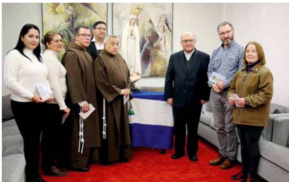
Na prośbę wiernych Konferencja Episkopatu Nikaragui wysłała figurę pielgrzymującą Matki Boskiej Fatimskiej do wszystkich diecezji kraju

Peregrynacja w Nikaragui to jedna z wielu tegorocznych podróży fatimskiej figury pielgrzymującej, zwanej „ambasadorką pokoju”. Poza tym w 2020 r. wizerunki z Fatimy odwiedzą m.in. Argentynę, Chile, Stany Zjednoczone, Włochy, Brazylię, Hiszpanię oraz wiele miejscowości w Portugalii. Pielgrzymki zaplanowano na cały rok, ale najwięcej odbędzie się między majem a lipcem.