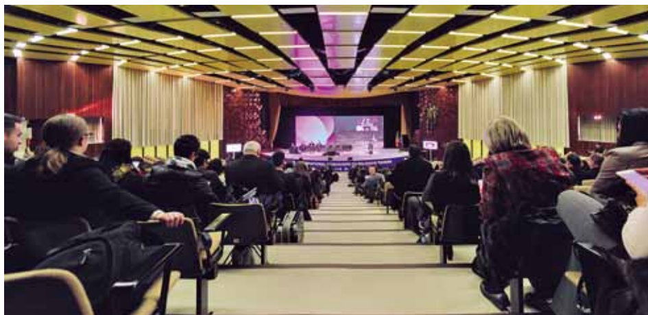
W spotkaniu uczestniczyli przedstawiciele prawie 50 krajów

W spotkaniu uczestniczyło kilkaset osób, w tym 150 gości z 46 krajów, 150 przedstawicieli firm portugalskich oraz 40 wystawców, reprezentujących szeroko rozumiany sektor turystyki religijnej.