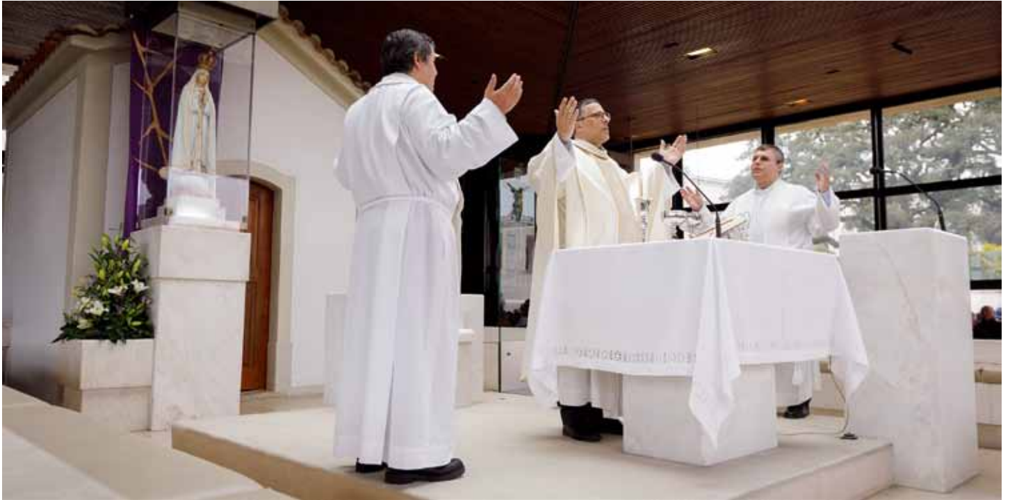
W nietypowych okolicznościach w uroczystościach w Kaplicy Objawień uczestniczyło niewielu pielgrzymów