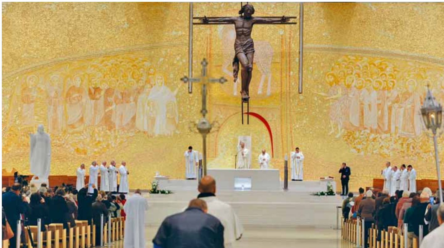
Pielgrzymka w lutym była ostatnią zimową uroczystością w Sanktuarium Fatimskim, w której uczestniczyły tysiące pielgrzymów

Rektor Sanktuarium przewodniczył Mszy św. do Matki Boskiej Fatimskiej w 15. rocznicę śmierci siostry Łucji od Jezusa / Carmo Rodeia