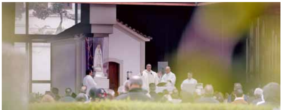
„Wszyscy przeżywamy chwile niepokoju, strachu, niepewności. To naturalne w sytuacji poważnych problemów zdrowotnych, w których obliczu stoimy; ale nawet w takiej sytuacji nie możemy przestać myśleć, że jesteśmy w dobrych rękach”

Organizując uroczystości pielgrzymki marcowej w Kaplicy Objawień, Sanktuarium Fatimskie starało się sprostać wymogom chwili, mając przy tym na uwadze przede wszystkim bezpieczeństwo swoich pielgrzymów i współpracowników.