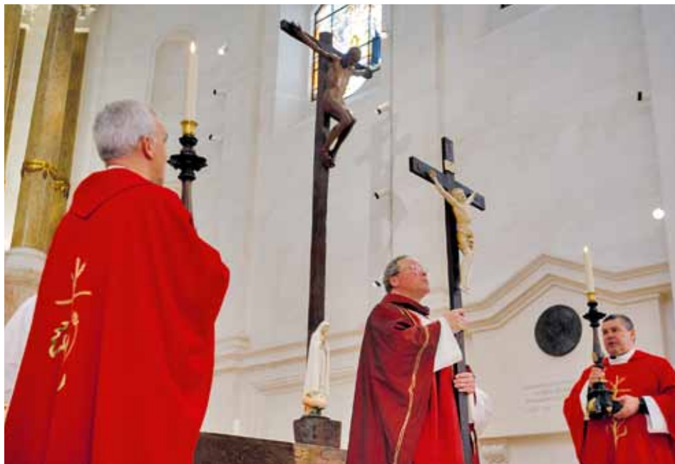
„Rozpostarte ramiona Jezusa, przybitego do krzyża, pokazują jak bardzo pragnie On objąć wszystkich mężczyzn i wszystkie kobiety, aby ofiarować im miłość bez granic”

Orędzie nadziei zabrzmiało w Fatimie podczas wielkanocnych uroczystości, transmitowanych przez środki masowego przekazu, media cyfrowe i społecznościowe