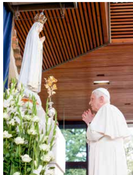
13 maja 2010 r. – papież Benedykt XVI przewodniczy pielgrzymce rocznicowej w Cova da Iria

Kardynał Joseph Ratzinger podkreślał również, że kluczem do odczytania ostatniej części tajemnicy jest trzykrotny okrzyk Anioła trzymającego w lewej ręce ognisty miecz: „Pokuta! Pokuta! Pokuta!”, czyli wezwanie do skruchy i nawrócenia z pewnością, że ostatecznie dobro zwycięży zło. W Komentarzu Teologicznym prefekt waty-