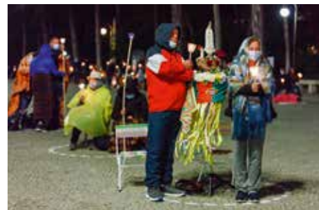
Niektóre grupy pielgrzymów tradycyjnie przyszyły do Fatimy pieszo

bardzo znaczący znak” – pastuszkowie zobaczyli Jezusa Chrystusa, który błogosławił świat. „Orędzie Matki Boskiej niesie naszemu światu Boże błogosławieństwa”, mówił kardynał i zachęcał pielgrzymów, aby „byli orędownikami współczucia, czułości, przywiązania i troski o drugiego człowieka, a przede wszystkim o najsłabszych, najbardziej samotnych, najbardziej potrzebujących”.