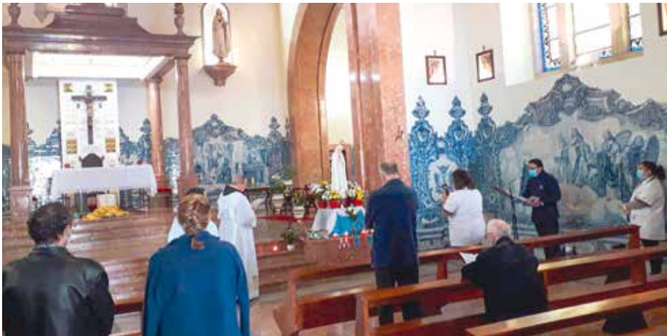
Uroczysta inauguracja peregrynacji odbyła się 10 października – w Światowym Dniu Zdrowia Psychicznego

Uroczysta inauguracja peregrynacji miała miejsce 10 października