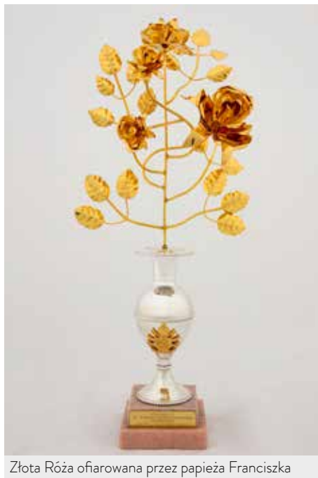
Złota Róża ofiarowana przez papieża Franciszka