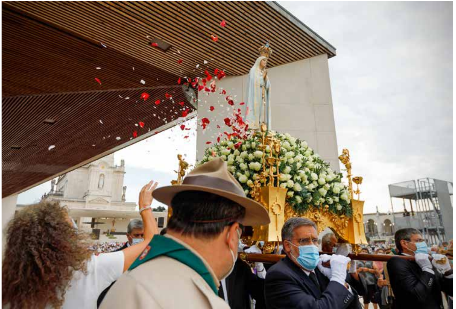
W pielgrzymce uczestniczyło dziewięć grup portugalskich oraz cztery z Hiszpanii, dwie z Włoch i po jednej z Francji i z Polski

Uroczystości 13 września zgromadziły w Cova da Iria największą w tym roku rzeszę pielgrzymów