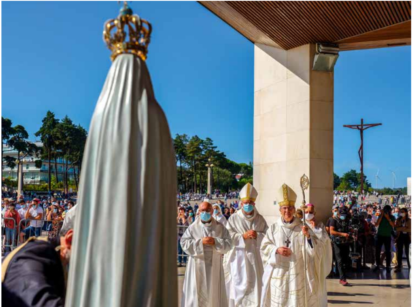
Udział w uroczystościach w Sanktuarium Fatimskim zgłosiło siedem grup, w tym trzy zagraniczne: z Hiszpanii, Włoch i Polski