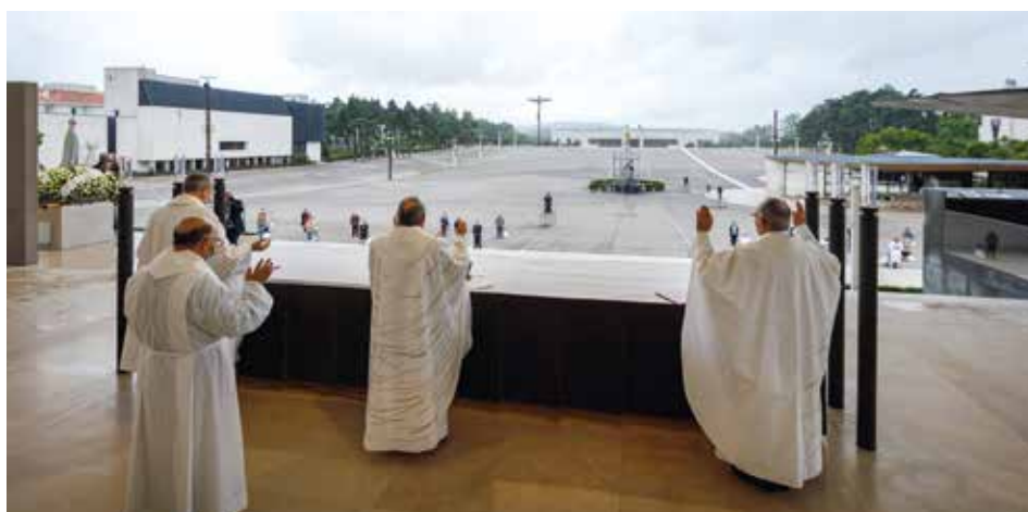
2020 – po raz pierwszy w historii Sanktuarium Fatimskiego pielgrzymi nie uczestniczyli w międzynarodowej pielgrzymce rocznicowej w maju

Znaczący spadek liczby pielgrzymów w Cova da Iria skłania do refleksji o nowych formach upowszechniania orędzia fatimskiego na świecie