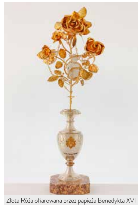
Złota Róża ofiarowana przez papieża Benedykta XVI

W zbiorach Muzeum Sanktuarium Fatimskiego znajdują się już trzy Złote Róże – najwyższe wyróżnienie przyznawane przez papieża ważnym osobistościom (m.in. władcom, książętom i królowym) oraz osobom publicznym albo sanktuariom, kościołom lub miastom jako wyraz uznania i podziękowanie za zasługi na rzecz Kościoła i służbę dla dobra społecznego.