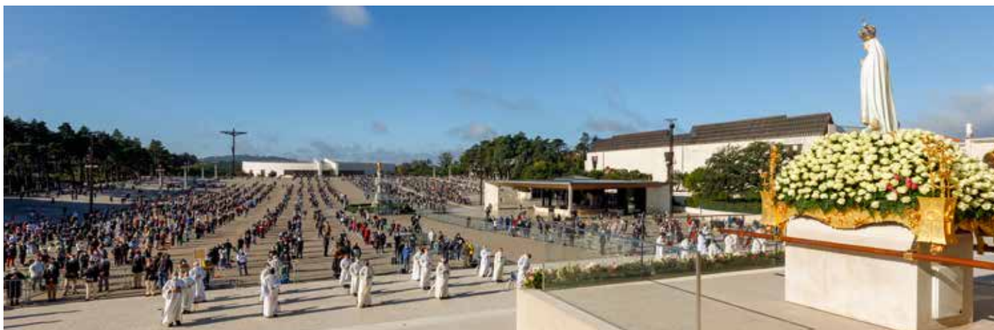
„Dowartościowanie pierwiastka kobiecego i macierzyńskiego jest nie tylko poszukiwaniem równowagi we władzach, we wpływach, w organizacji i funkcjonowaniu Kościoła...”

Eucharystię koncelebrowało 50 kapłanów, wśród nich 9 biskupów. Biuro Prasowe Sanktuarium Fatimskiego wydało akredytacje 132 dziennikarzom z 39 mediów informacyjnych.