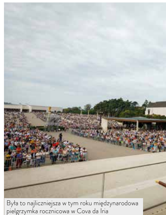
Była to najliczniejsza w tym roku międzynarodowa pielgrzymka rocznicowa w Cova da Iria

Kardynał pozdrowił też chorych na Covid-19, wspominał o zmarłych i skierował słowa solidarności i współczucia do ich rodzin. Prosił także o modlitwę w intencji odbudowy zniszczeń w Libanie oraz uchodźców w obozie Moria na greckiej wyspie Lesbos. „Niech Europa szeroko