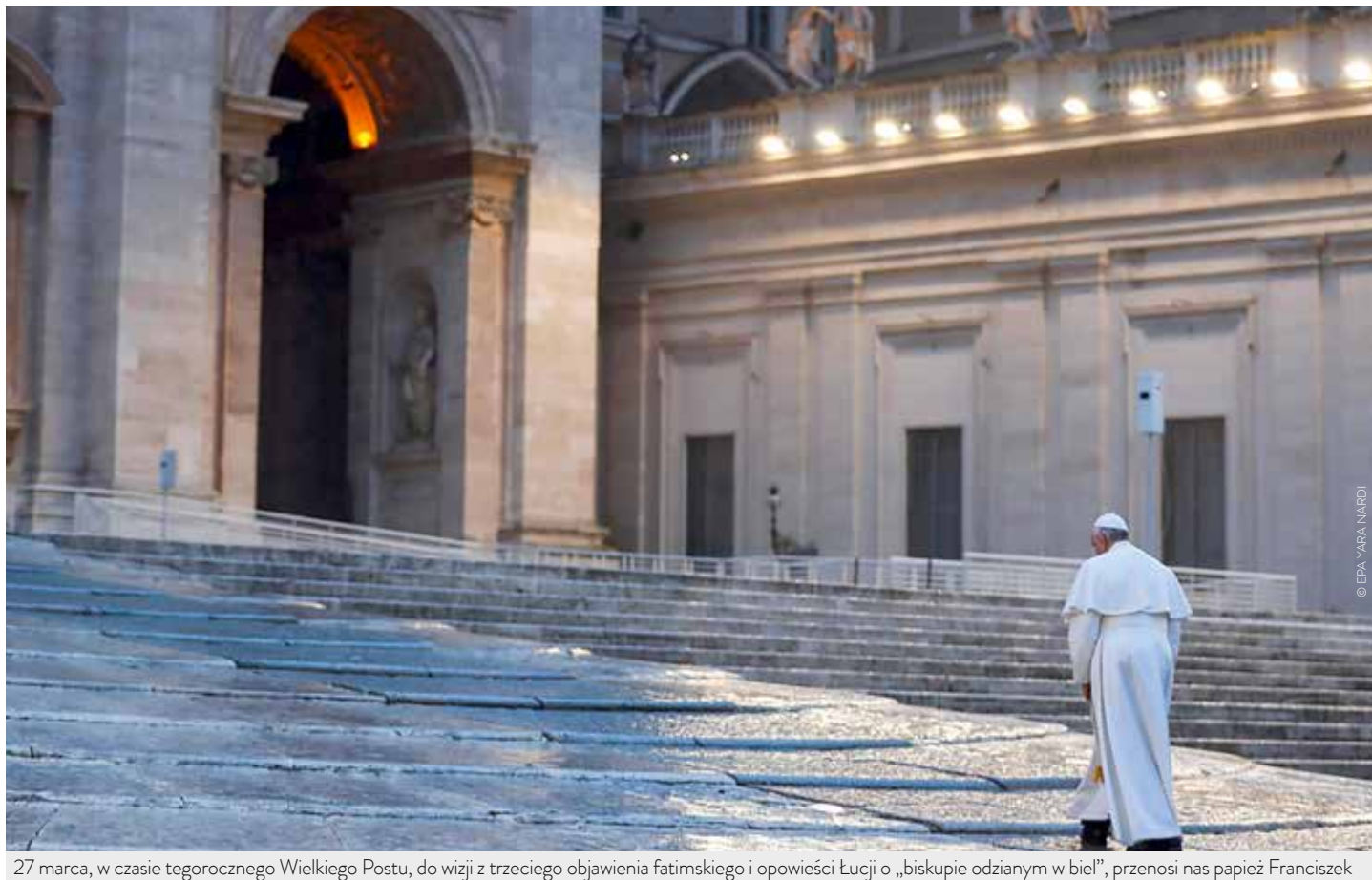
27 marca, w czasie tegorocznego Wielkiego Postu, do wizji z trzeciego objawienia fatimskiego i opowieści Łucji o „biskupie odzianym w biel”, przynosi nas papież Franciszek

Fatima a cierpienia „biskupa odzianego w biel” – refleksja w czasach pandemii / Carmo Rodeia