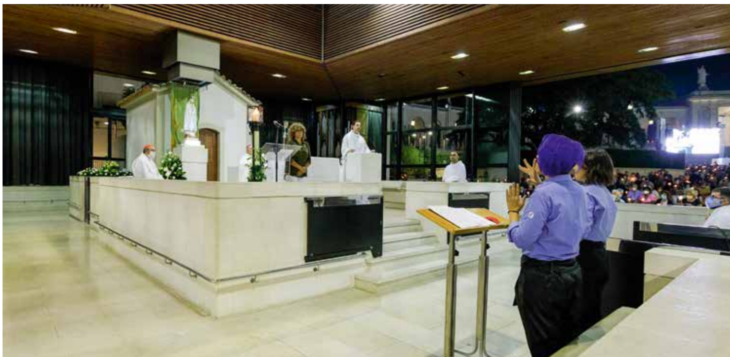
Obchody upamiętniające piąte objawienie Matki Boskiej w 1917 r. po raz pierwszy połączone z VI Narodową Pielgrzymką Osób Głuchych

otworzy dla nich drzwi i przyjmie ich serdecznie”, wzywał kapłan.