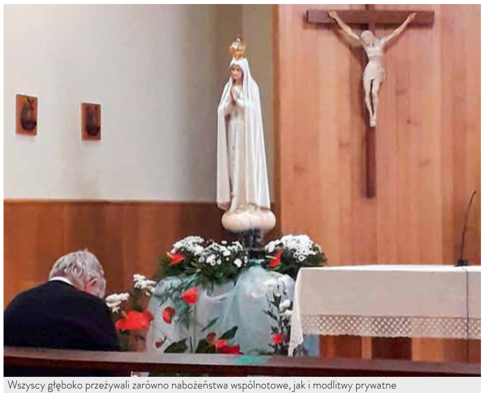
Wszyscy głęboko przeżywali zarówno nabożeństwa wspólnotowe, jak i modlitwy prywatne

W odpowiedzi na napływające z wielu krajów niezliczone prośby o możliwość spotkania z Matką Boską z Cova da Iria, polecono wykonanie kopii pierwszej figury; obecnie Sanktuarium Fatimskie dysponuje trzynastoma wizerunkami pielgrzymującymi.