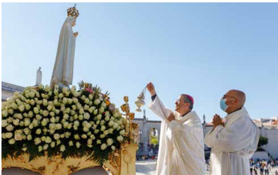
W sierpniowych uroczystościach rocznicowych w Fatimie brali udział uczestnicy 48. Narodowej Pielgrzymki Migrantów i Uchodźców

w Kanie Galilejskiej, wyjaśniał, że sensem świętowania jest przeżywanie radości we wspólnocie – to nadaje sens ludzkiemu życiu; i wszyscy mają prawo uczestniczyć w święcie, na które zaprasza ich Bóg.