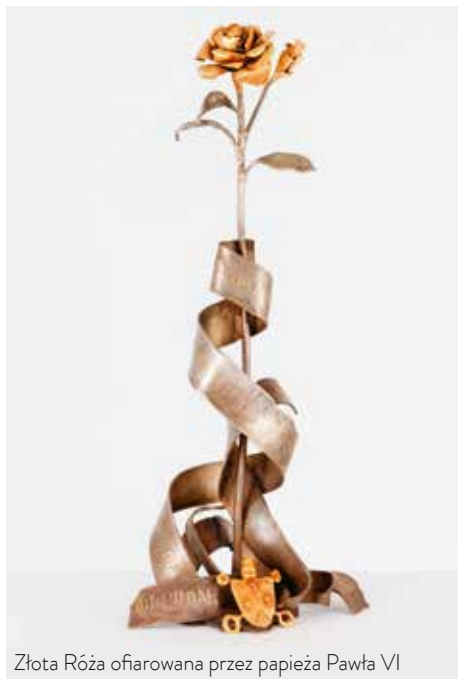
Złota Róża ofiarowana przez papieża Pawła VI

Złota Róża to wyraz uznania za wierność Kościołowi i papieżowi – po raz pierwszy Fatima otrzymała ją od Pawła VI, potem w 2010 r. od Benedykta XVI i w 2017 r. od papieża Franciszka