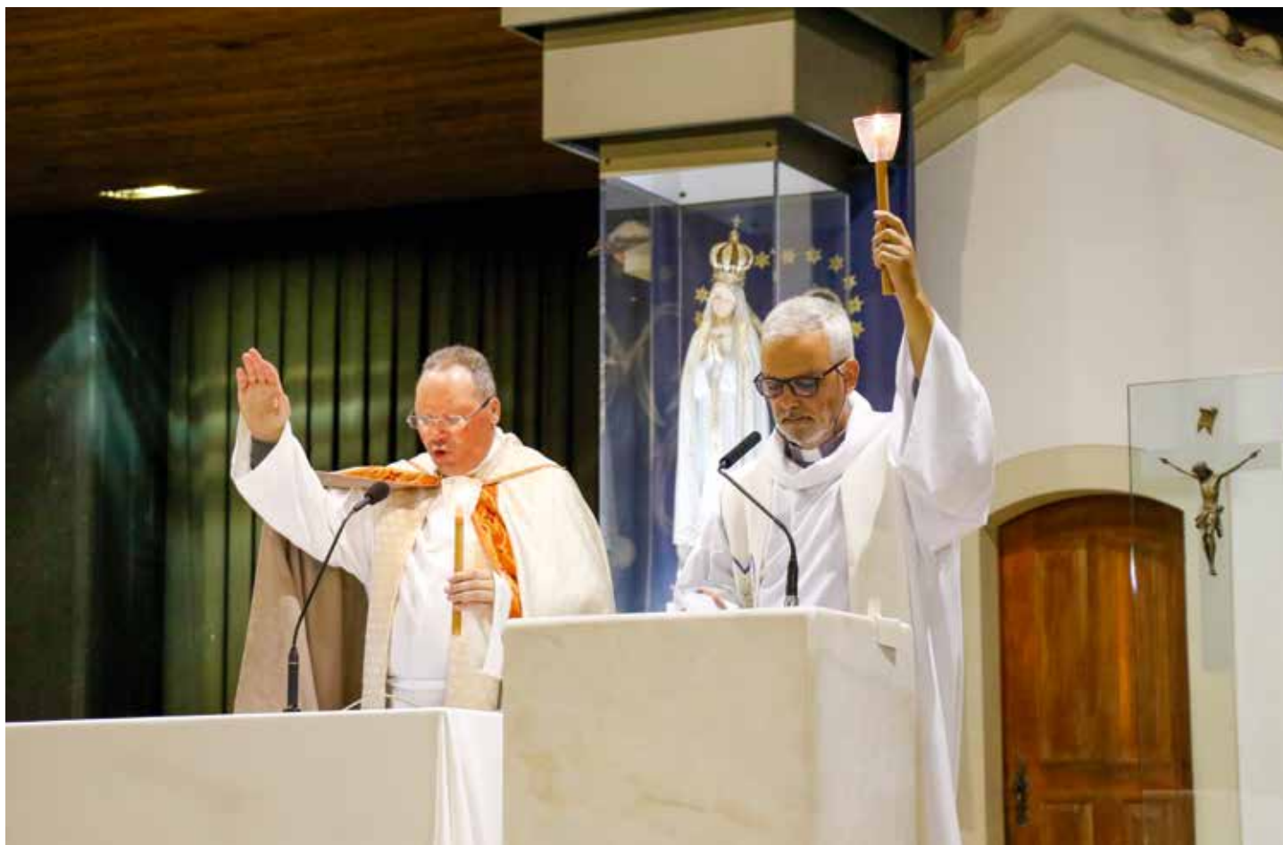
Pielgrzymów zachęcano do nieustannej modlitwy, o którą Matka Boska prosiła podczas objawień