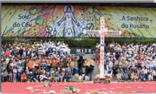
En los 90 años de las Peregrinaciones, el tema de la peregrinación fue “Soy del Cielo... La Señora del Rosario”.

La comitiva visitó la Basílica del Santuario y las localidades de Aljustrel y Valinhos. Al concluir la peregrinación de Gloria Arroyo, el Santuario de Fátima ofreció una comida al grupo.