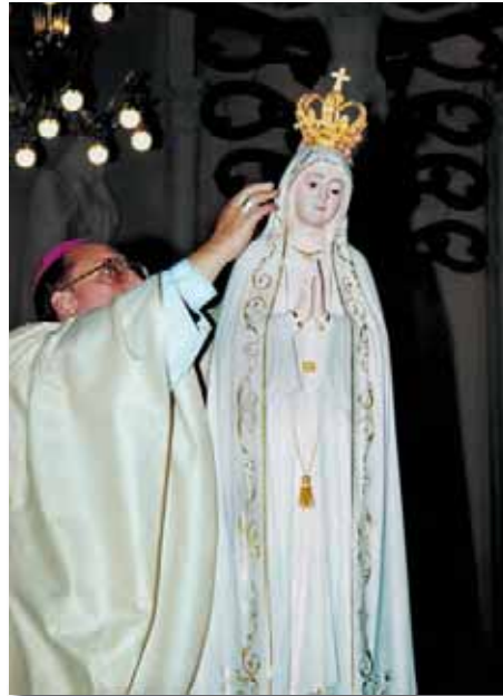
En la Catedral de la Inmaculada Concepción, en Moscú, el 08.10.2000: coronación de la imagen de Nuestra Señora de Fátima, con la corona bendecida por Juan Pablo II

intentaban encontrar, lo más posible, información sobre las apariciones de Nuestra Señora en Fátima, creyendo que un día Su profecía y la esperanza, que de allí (de Fátima) nos había sido dada, sería realidad. Era la esperanza