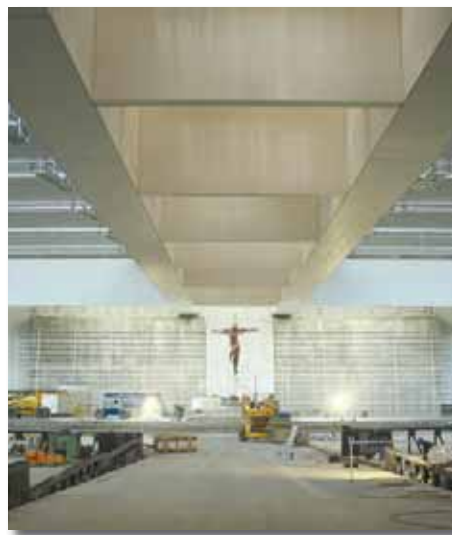
Prototipo de Crucifijo del Altar de la Iglesia de la Santísima Trinidad, de la autoría de la irlandesa Catherine Green.

*Cruz Alta, en el exterior de la Iglesia – Autor: Robert Schad (Alemania)