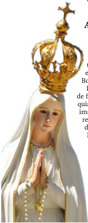
Virgen Peregrina tiene 32 visitas programadas

Año Jubilar del Centenario de las Apariciones estimula mayor número de salidas, un total de 32