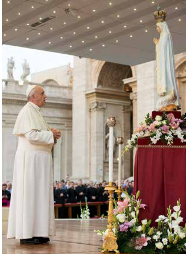
Francisco es el primer Jesuita elegido Papa

Está, por otro lado, desarrollando una reforma de la Curia Romana,