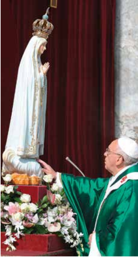
Francisco quiere hacerse peregrino en Fátima

Francisco vendrá “en peregrinación al Santuario de Nuestra Señora de Fátima del 12 al 13 de mayo”