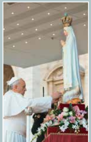
Acto de consagración a la Virgen de Fátima, al final de la Misa con ocasión de la Jornada mariana (Plaza de San Pedro, 13 de octubre de 2013)