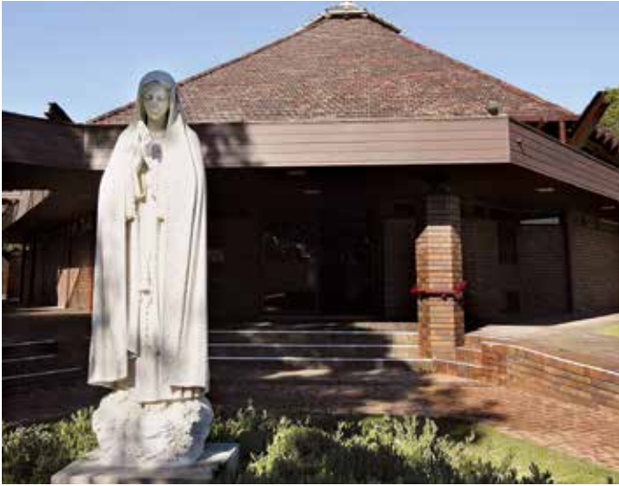
La Virgen María tiene santuario en Sidney

En el archivo del Santuario de Fátima hay referencia a una parroquia dedicada a Nuestra Señora de Fátima, cerca de Pekín. Una imagen de Nuestra Señora de Fátima se encuentra en el pico del Everest. En Sidney, Australia,