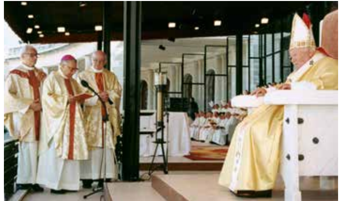
Juan Pablo II estuvo tres veces en Cova de Iria

13 de mayo de 1991 – Juan Pablo II preside la Eucaristía en el Santuario de Fátima.