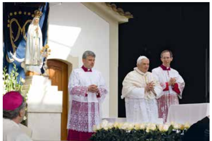
Benedicto XVI visitó el Santuario de Fátima en mayo de 2010