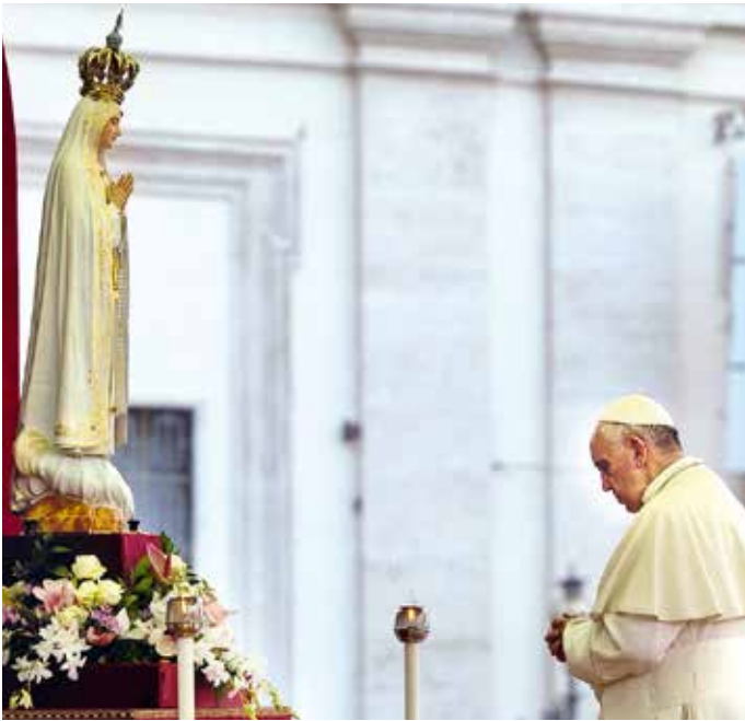
Francisco consagró su pontificado a Nuestra Señora

El cardenal Bergoglio fue elegido Papa el 13 de marzo de 2013, en el segundo día del cónclave, con el nombre de Francisco.