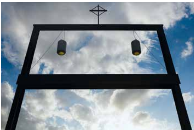
Centenario de las Apariciones está señalado por el Pórtico Jubilar

De acuerdo con el Derecho Canónico, para alcanzar la indulgencia, que puede ser parcial o plenaria -conforme liberados parcial o totalmente de la pena debida por los pecados- se requiere, además de la exclusión de cualquier afecto al pecado, el cumplimiento de la obra prescrita por la Iglesia, los sacramentos de la Reconciliación (Confesión) y de la Eucaristía, así como la oración por las intenciones del Papa.