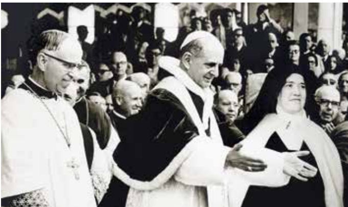
Pablo VI fue el primer Papa en visitar Fátima

«Tan grande es nuestro deseo de honrar a la Santísima Virgen María, Madre de Cristo y, por eso, Madre de Dios y Madre nuestra, tan grande es nuestra confianza en su benevolencia para con la santa Iglesia y para con nuestra misión apostólica, tan grande es nuestra necesidad de su intercesión junto a Cristo, su Divino Hijo, que venimos, peregrino humilde y confiante, a este santuario bendito, donde se celebra hoy el cincuentenario de las apariciones de Fátima y donde se conmemora el vigésimo quinto aniversario de la consagración del mundo al Corazón Inmaculado de María», dijo en su homilía.