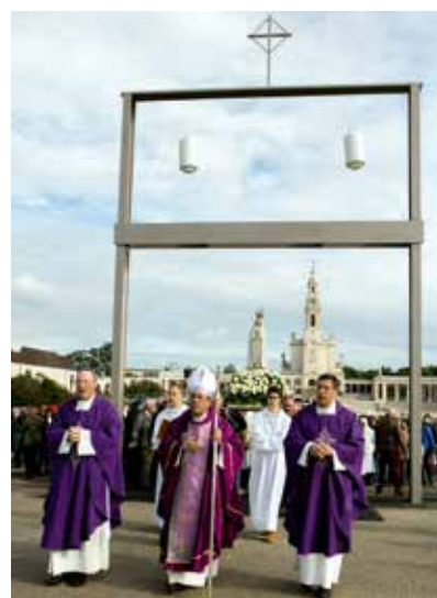
Pórtico Jubilar señala 100 de las apariciones

"Fátima - Tiempo de Luz" es un espectáculo de Video Mapping, programado para las noches del 12, 13 y 14 de mayo en el Recinto del Santuario de Fátima.