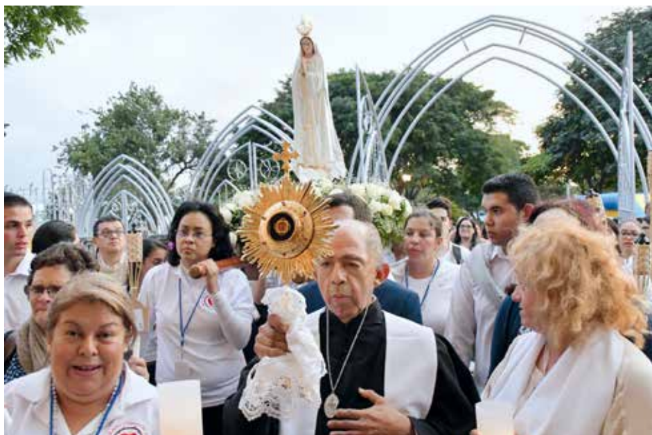
Las reliquias de los Pastorcitos fueron veneradas en Costa Rica

Las vidas de Francisco y de Jacinta se transformarán definitivamente a la luz del Mensaje de Misericordia. Francisco asume una vida de contemplación, comprometido con el consuelo de Dios, que le parece que está “tan triste”. La Señora recomendará que él rezase muchos rosarios. Y mucho rezará Francisco, buscando la soledad del monte o la compañía del Jesús escondido en el sagrario de la iglesia parroquial, para “pensar en Dios”. Jacinta se deja impresionar por el sufrimiento de los pecadores y reza y se sacrifica por su conversión, por la paz en el mundo, y por el Santo Padre: “Sufro mucho,