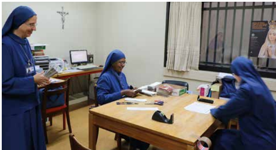
Hermanas Oblatas recogen y separan cartas que llegan con las peticiones de oración

Mensajes que cuentan la historia de Fátima y del mundo