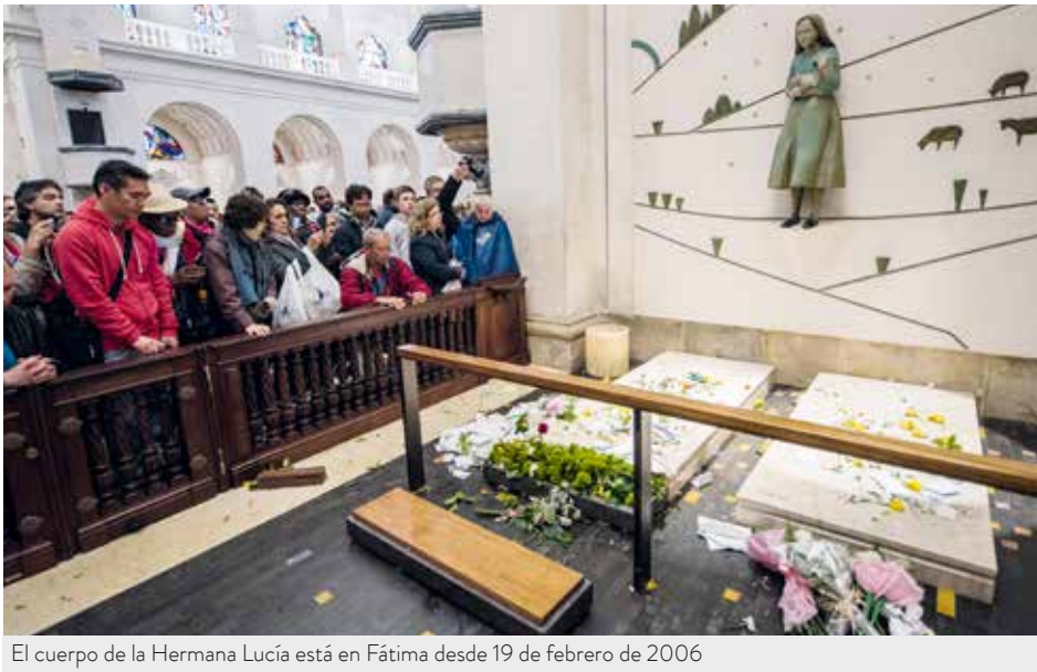
El cuerpo de la Hermana Lucía está en Fátima desde 19 de febrero de 2006

sia, que brilla cuando es misionera, acogedora, libre, fiel, pobre de medios y rica en el amor”, dijo también el Papa.