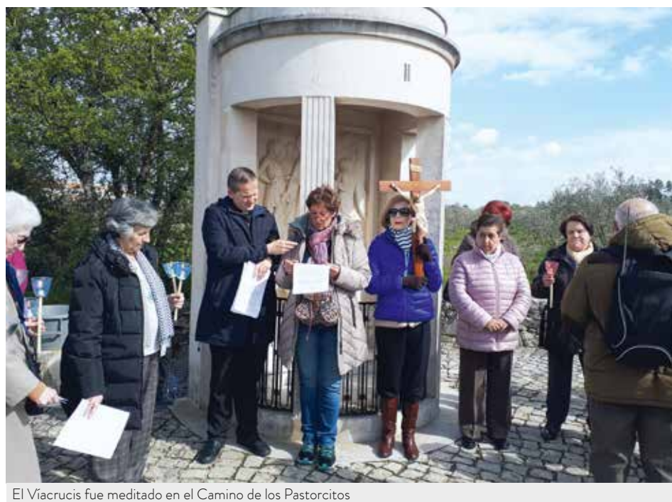
El Viacrucis fue meditado en el Camino de los Pastorcitos

Los testimonios de los peregrinos que nos acompañaron, el día de regreso a nuestras casas, mostraban que todos iban muy llenos de amor a la Santísima Virgen, repletos de una gracia espiritual, y todos esperaban volver a Fátima el próximo año, si Dios y Nuestra Señora lo permiten.