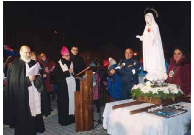
La región tiene una fuerte unión al Mensaje de Fátima

La autarquía colocó a disposición una pequeña plaza que queda en la entrada del pueblo, dándole el nombre de "Oasis de Nuestra Señora de Fátima", y en este lugar fue entronizada la imagen adquirida en Fátima, en el Santuario, y bendecida en la Capilla de las Apariciones.