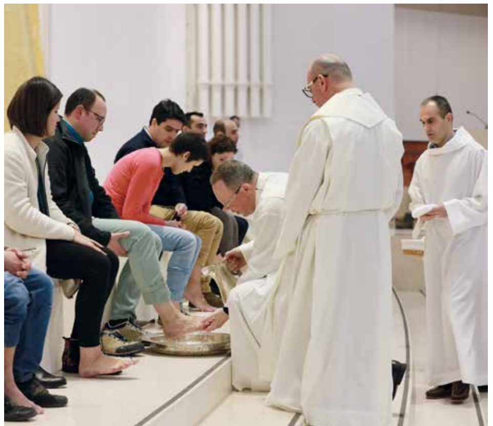
Misa de la Cena del Señor contó con la presencia de colaboradores del Santuario de Fátima

Con la Pascua comienza un nuevo horario conmemorativo en el Santuario de Fátima, que puede ser consultado en www.fatima.pt .