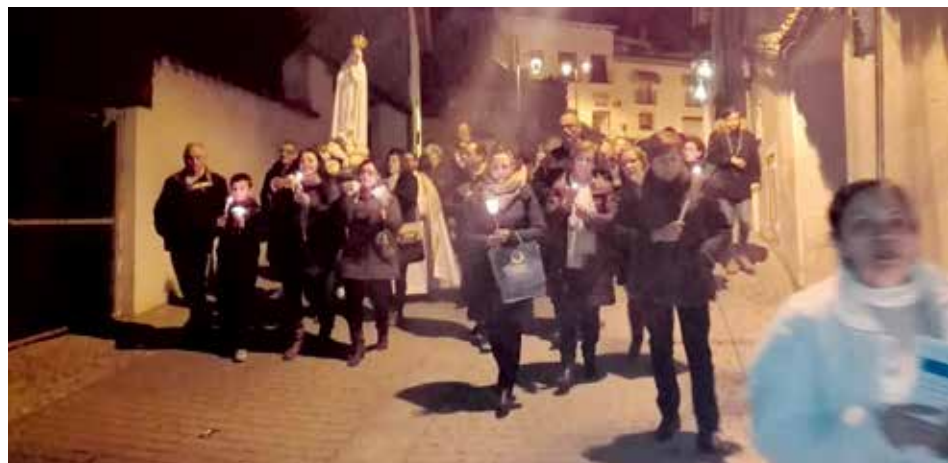
La devoción a la Virgen de Fátima fue sentida a lo largo de la visita

la paz en nuestras angustias, sustentando nuestra fe y aumentándola, curando nuestros corazones, agradecida por nuestras oraciones, maestra en el conocimiento de su Hijo Jesucristo, piadosa y digna de devoción es nuestra Santísima Virgen de Fátima, que nos trajo tantas bendiciones y amor, y que consiguió unir a un pueblo necesitado de una caricia de su madre, para que, entre lágrimas de emoción, pañuelos blancos y el canto de su himno, de ella nos despidiésemos con pena pero con la esperanza de que viaje por el mundo elevando los corazones, y que en breve vuelva a nosotros y así podamos alabarla.