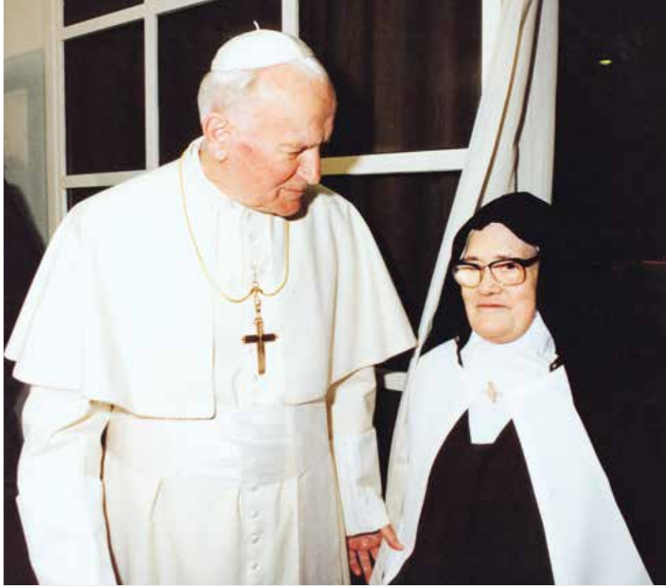
Hermana Lucía recibió a Juan Pablo II cuando este visitó Portugal