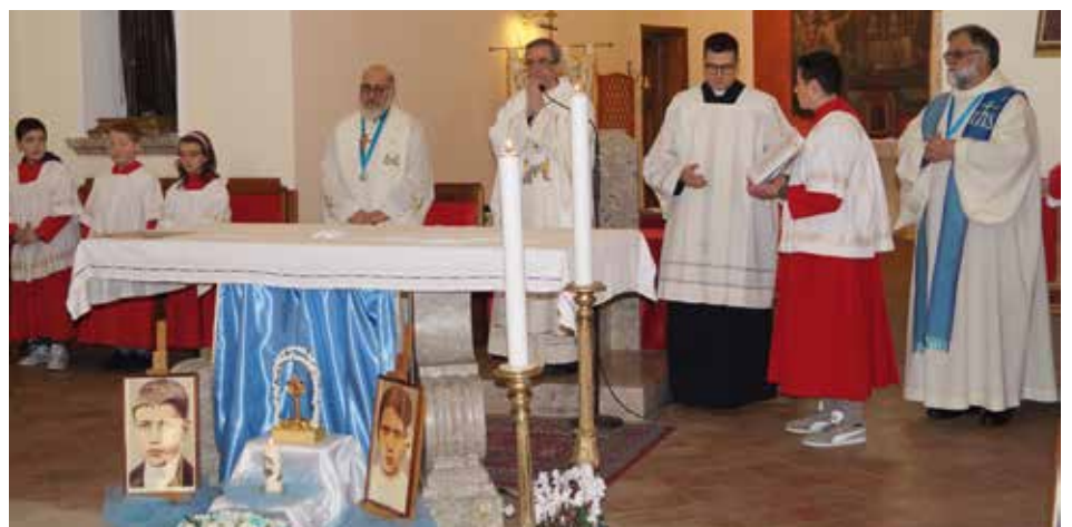
Día 20 de febrero fue vivido con profunda devoción