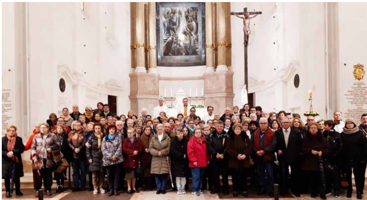
La eucaristía dominical fue celebrada en la Basílica de Nuestra Señora del Rosario

Peregrinación ocurrió entre los días 12 y 15 de abril