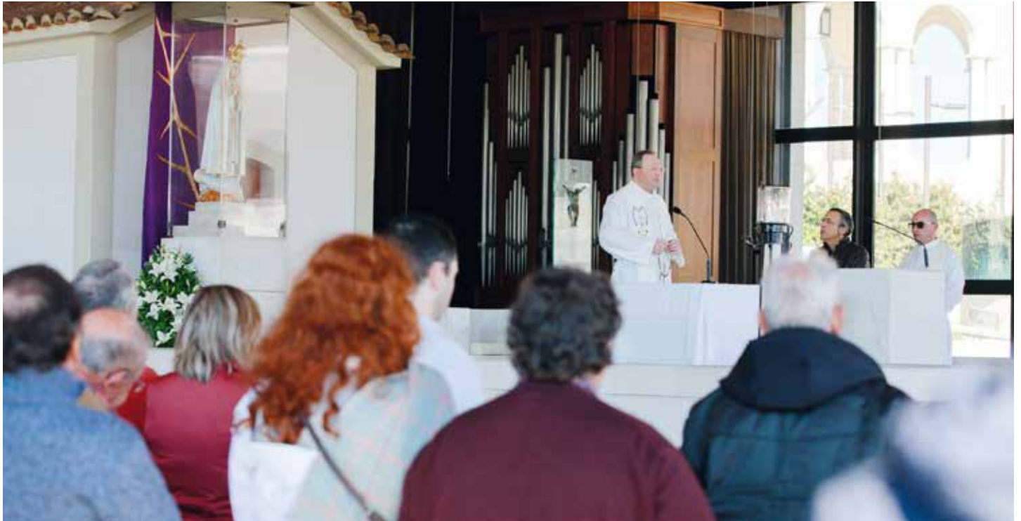
Jornada de Oración fue convocada por el Papa Francisco el 4 de febrero

Iniciativa fue convocada por el Santo Padre, el Papa Francisco