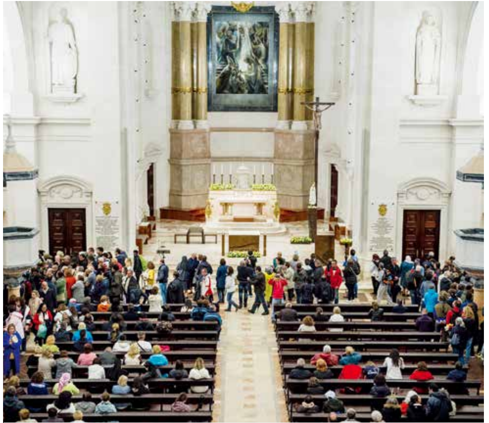
Tumbas de los Pastorcitos reciben diariamente centenares de visitantes

“Las personas piden con mucha frecuencia reliquias. Eso ha aumentado de forma exponencial y las peticiones llegan de todas las partes del mundo, desde Australia al Este europeo, sin olvidar América Latina”, se refiere la reli-