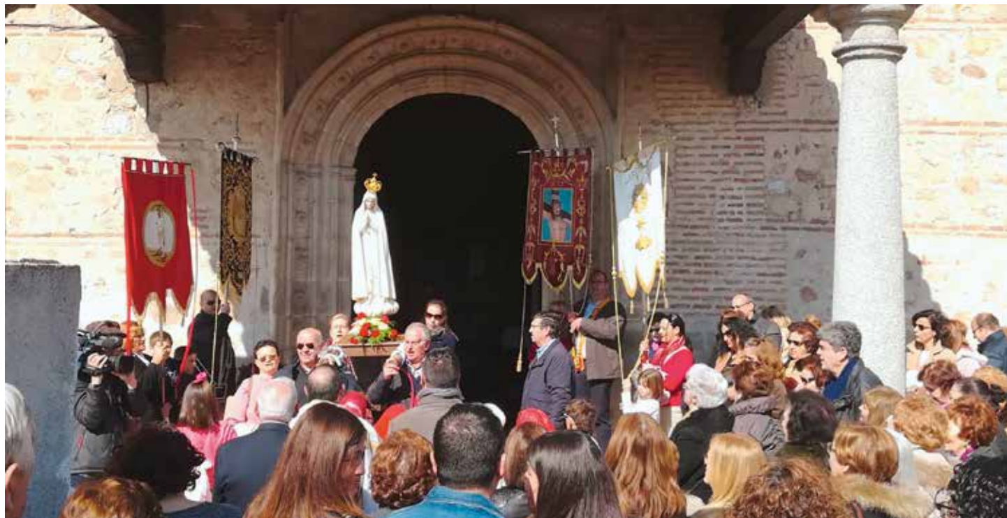
Fue preparado un intenso programa de oración para recibir la Imagen Peregrina

Visita sucedió del 13 al 25 de febrero en clima de fiesta y devoción