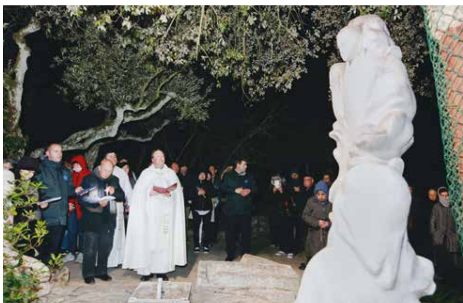
En el Poço do Arneiro los peregrinos recuerdan las peticiones del Ángel a los Pastorcitos

En el recorrido de 950 metros, en el camino de los Pastorcitos hasta el monte de los Valinhos, los peregrinos fueron invitados a escuchar el Evangelio, seguido de una pequeña oración, hecha por el rector del Santuario que terminó con la Letanía de la Paz.