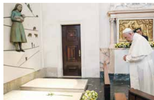
Papa Francisco rezó en las tumbas el 13 demayo de 2017