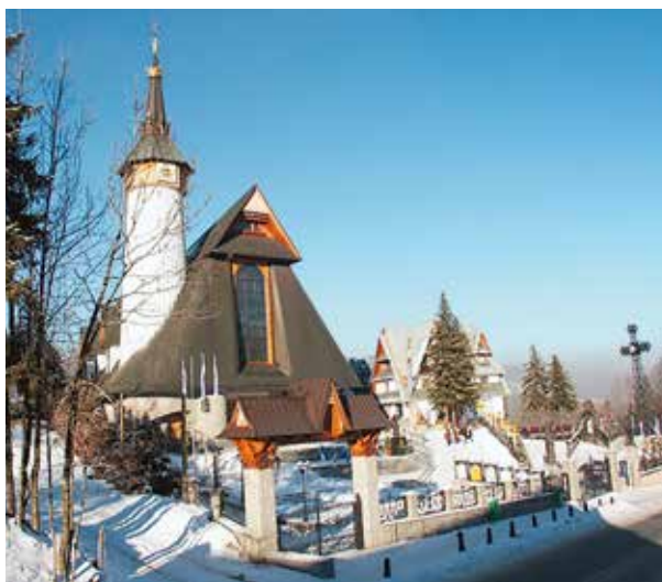
Decisión fue anunciada el 28 de marzo de 2018