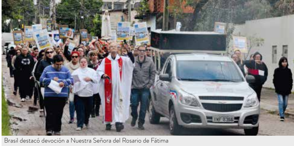
Brasil destacó devoción a Nuestra Señora del Rosario de Fátima

Las escuelas de la red municipal y estado que forman parte de la parroquia estudiantil, también tuvieron la alegría de recibir la Imagen Peregrina