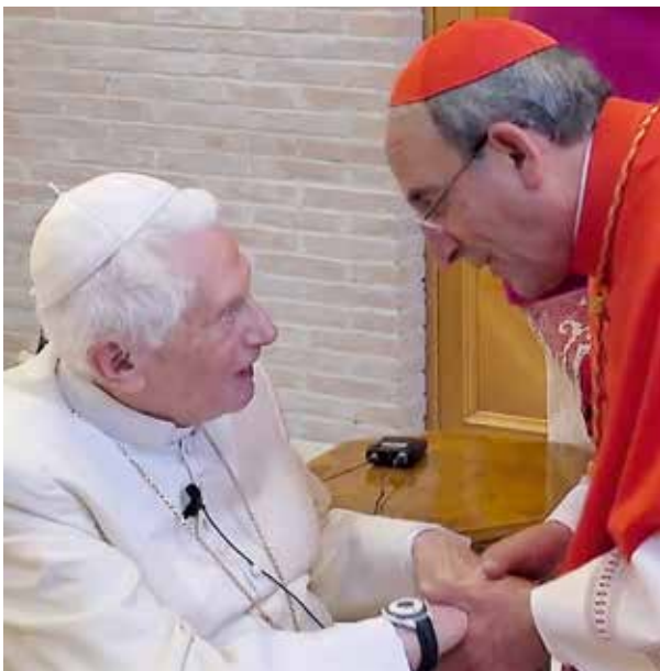
Los nuevos Cardenales saludaron al Papa Emérito, Benedicto XVI

“Está en el ADN de Fátima la unión al Papa”, reiteró el sacerdote, explicando que “esta elección es naturalmente personal, además, porque D. António es obispo de Leiria-Fátima, acaba por unirnos aún más al Santo Padre y a la oración que diariamente hacemos por él”.