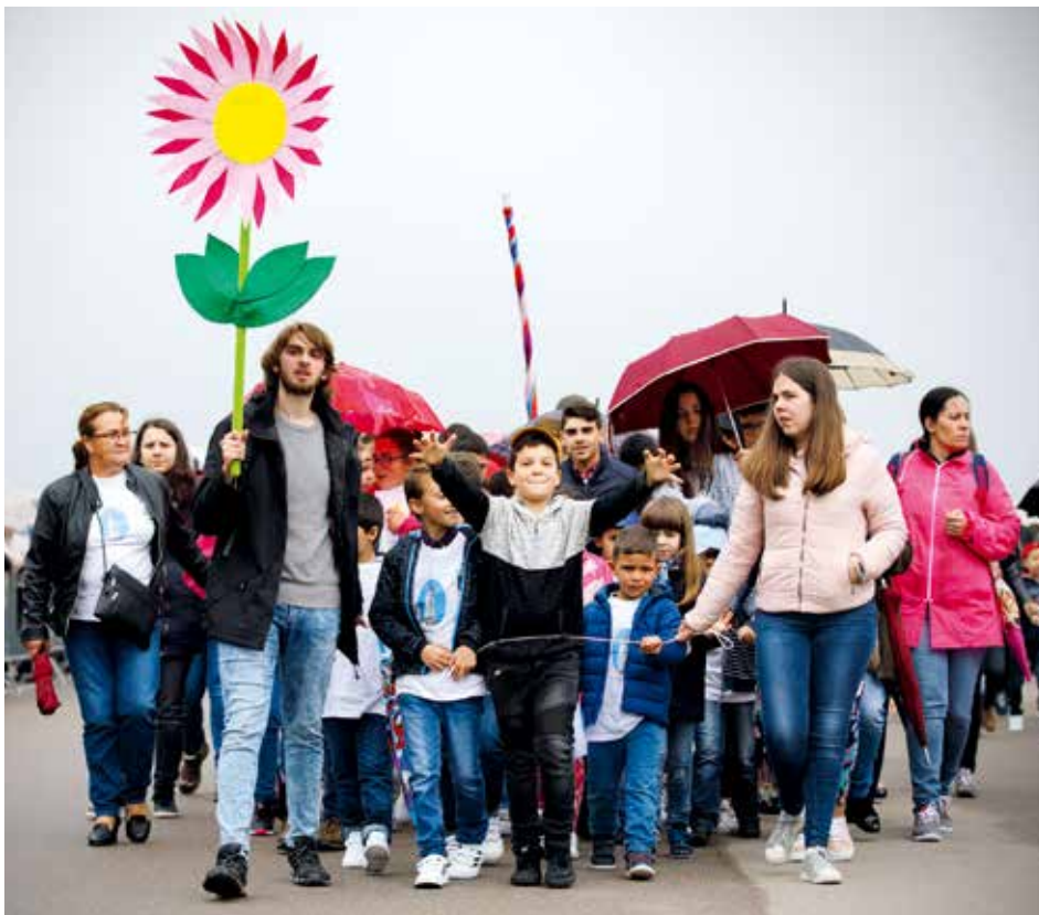
Una carta para Nuestra Señora, fue el desafío lanzado por el Santuario a los más pequeños

Por eso, también la ofrenda entregada a los niños fue una carta, dirigida a cada uno de ellos, conteniendo en el interior un oratorio. El oratorio reproduce la imagen de la Capelinha y dentro tiene una imagen de Nuestra Señora flanquea-