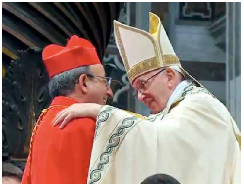
Francisco dijo que el Cardenalato de D. António era una “caricia de Nuestra Señora”