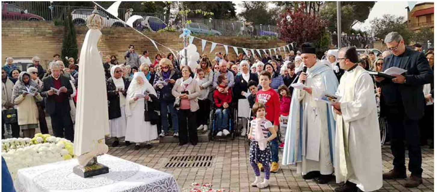
Virgen Peregrina prosigue periplo por Italia

Itinerario Mariano sucedió del 7 de abril al 31 de julio de 2018 / Mons. Ernesto Mandara