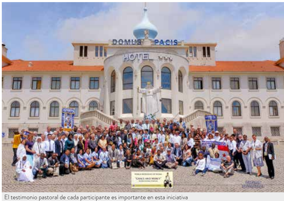
El testimonio pastoral de cada participante es importante en esta iniciativa

Ana Reis / Nuno Prazeres, Secretariado Internacional de la A.M.F.