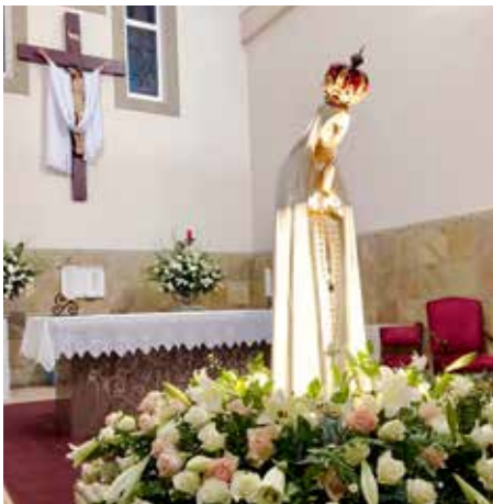
La Imagen de Nuestra Señora de Fátima antes del inicio de la peregrinación

La comunidad portuguesa predominantemente católica es una de las mayores comunidades de emigrantes en África del Sur / Manny de Freitas – Co-coordinador de la Peregrinación de Fátima