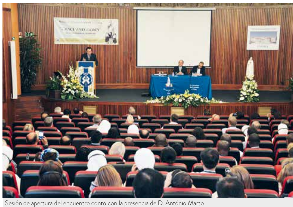
Sesión de apertura del encuentro contó con la presencia de D. António Marto

El Apostolado Mundial de Fátima es una asociación pública internacional de fieles que tiene como principal objetivo conocer, vivir y difundir el mensaje de Fátima en el mundo entero.