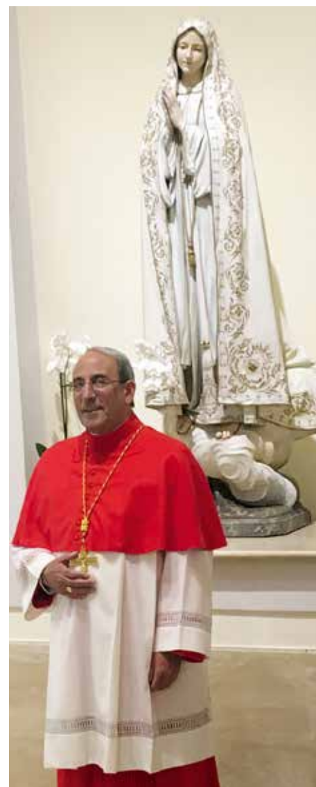
Prelado de Leiria-Fátima garantiza simplicidad

“Yo de cualquier manera no quería que las expectativas fuesen demasiadas. Yo formo parte de la Conferencia Episcopal, que tiene un presidente y donde cada obispo tiene su voz, y es en conjunto como trabajamos los problemas de la Iglesia en Portugal”, concluyó.