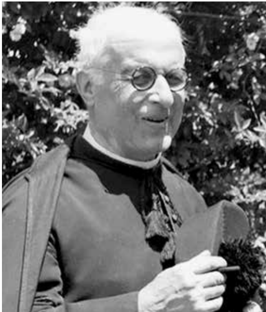
Canónigo Formigão fue por primera vez a Cova de Iria el 13 de septiembre de 1917

El “Apóstol de Fátima” fue declarado venerable el pasado día 14 de abril. Santuario de Fátima manifestó alegría y regocijo