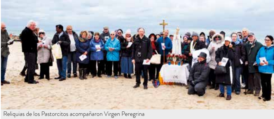
Reliquias de los Pastorcitos acompañaron Virgen Peregrina

400 localidades de las Islas Británicas rezaron el Rosario / Oliver Abassolo