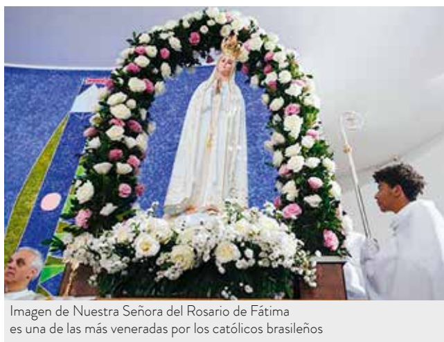
Imagen de Nuestra Señora del Rosario de Fátima es una de las más veneradas por los católicos brasileños