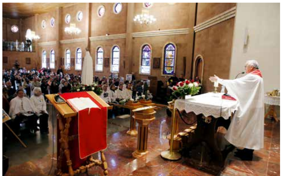
Celebración Mariana en Porto Alegre, en Brasil

En el mes dedicado a María, nuestra Madre, Nuestra Señora de Fátima, son innumerables las gracias recibidas y incontables las alegrías, la fuerza y la fe renovadas en cada una de las personas que entran en ese Santuario. Renovados por el amor de Cristo y por la protección de la Madre de Fátima, los laicos y laicas asumen la misión de ser sal de la tierra y luz del mundo.