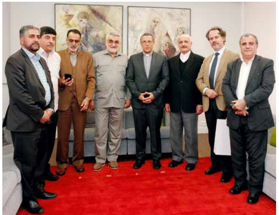
Delegación Parlamentaria se desplazó a Fátima para visitar el Santuario

El vicerrector destacó también “la relación cariñosa” que el Santuario tiene con los países del Este “por causa de la historia de los acontecimientos y del Mensaje de Fátima”, en especial con la comunidad ucraniana que fue de las primeras comunidades inmigrantes en el país “con los que se crearon lazos muy fuertes”. Por lo demás, con el Santuario de Fátima colaboran dos sacerdotes ucranianos en la atención permanente de la comunidad que visita regularmente Cova de Iria.