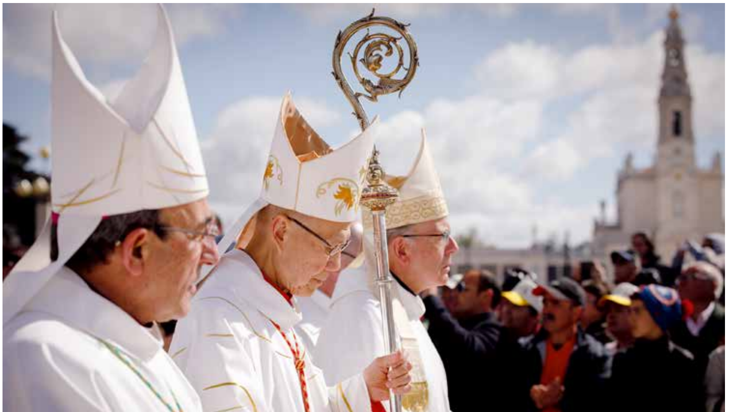
Obispo Emérito de Hong Kong fue el primer asiático en presidir una Peregrinación Aniversaria en Fátima

“Santísima Virgen de Fátima, dirige tu mirada sobre nosotros, sobre nuestras familias, sobre nuestro país, sobre el mundo”, se puede leer.