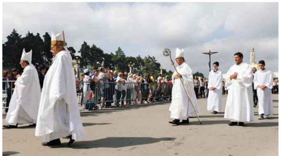
Obispo auxiliar llamó a la necesidad “de líderes sabios y competentes” en el mundo actual

“La peregrinación es un viaje santo, una experiencia espiritual de oración, de silencio interior, de búsqueda de luz y de verdad, de pureza de corazón, de reconciliación, de conversión y de paz con nosotros, con Dios y con los demás”.