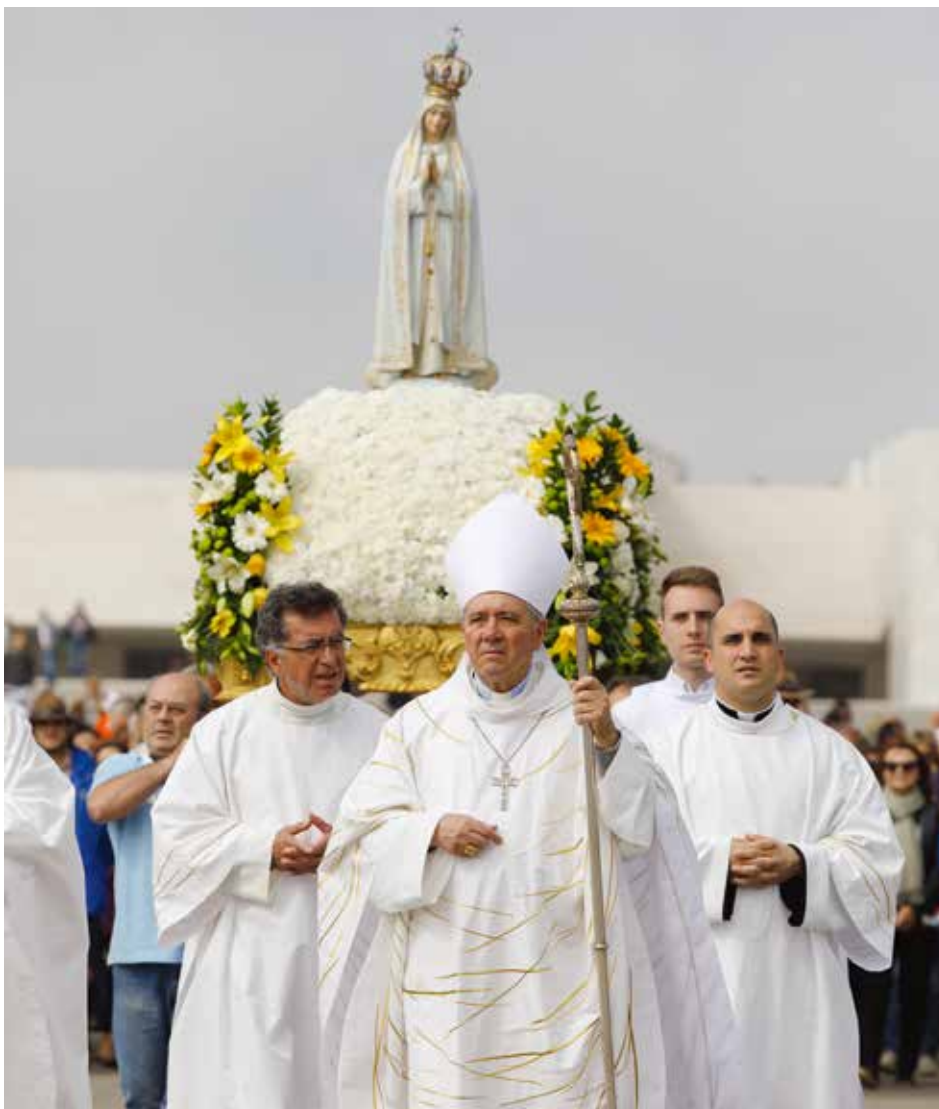
Obispo Emérito de Santarém reforzó importancia del Mensaje de Fátima en nuestros días

“La gracia y la misericordia con que Dios coronó la vida de Nuestra Señora son fundamento de la esperanza de estar acompañados y protegidos por su amor materno. Así sucedió en las Bodas de Caná y en Fátima... Así sucede, hoy, con aquellos que en El creen y lo siguen, a ejemplo de María, su Madre”, concluyó.