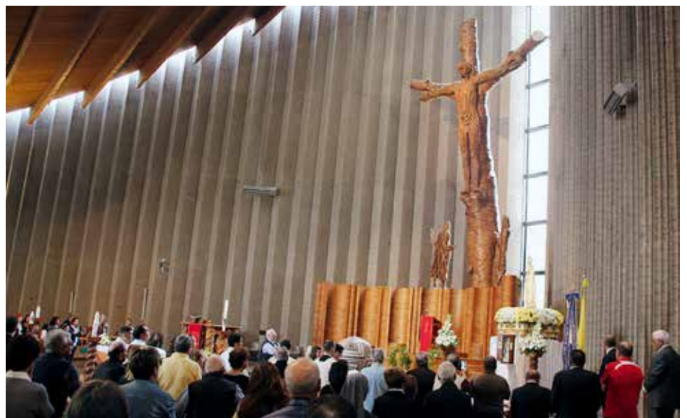
Italianos rezaron por la paz delante de la Imagen Peregrina

Son siempre abundantes los frutos de la gracia concedidos por el Señor en estas ocasiones, durante las cuales muchos fieles se unen alrede-