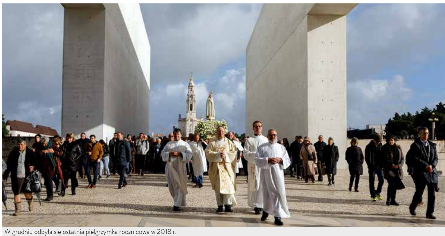
W grudniu odbyła się ostatnia pielgrzymka rocznicowa w 2018 r.

Grudniowa pielgrzymka była pierwszą pielgrzymką rocznicową w nowym roku duszpasterskim, który rozpoczął się 2 grudnia.