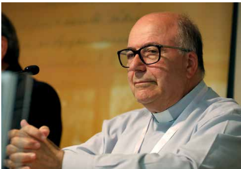
Uroczystość ku czci byłego dyrektora Departamentu Studiów (2017 r.)

15 sierpnia 1962 r. przyjął święcenia kapłańskie i w tym samym roku wstąpił na Papieski Uniwersytet Gregoriański w Rzymie, gdzie uzyskał licencjat z teologii dogmatycznej oraz historii Kościoła. W czasie pięcioletniego pobytu w „wiecznym mieście” mógł z bliska obserwować inaugurację Soboru Watykańskiego II oraz wybór Pawła VI – pierwszego papieża, który pielgrzymował do Fatimy.