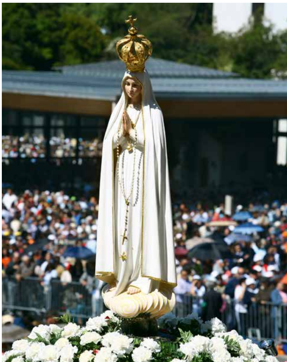
W latach 1947-2003 figura pielgrzymująca nr 1 przebyła 630 tys. kilometrów, pięciokrotnie okrążając ziemię

„Jest to dla nas wyjątkowy wizerunek – pierwsza i oryginalna figura pielgrzymująca, ta, która odwiedziła wszystkie kontynenty, wielokrotnie okrążyła