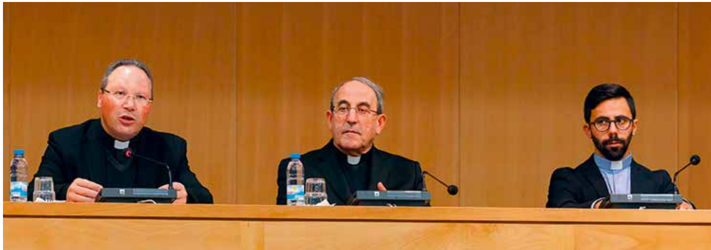
Rektor Sanktuarium Fatimskiego: „Kościół pielgrzymujący zbudowany jest z «żywych kamieni» – pielgrzymów, którzy idą razem”

2 grudnia rozpoczął się nowy rok liturgiczny – Sanktuarium Fatimskie zaprezentowało temat roku duszpasterskiego 2018-2019 / Carmo Rodeia