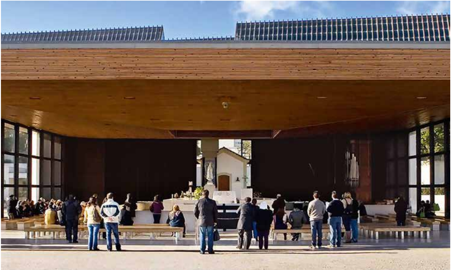
W sercu Sanktuarium Fatimskiego codziennie gromadzą się setki wiernych

W ybudowana sto lat temu Kaplica Objawień od pierwszych chwil swego istnienia jest najważniejszym i najczęściej odwiedzanym przez pielgrzymów miejscem w Sanktuarium w Cova da Iria