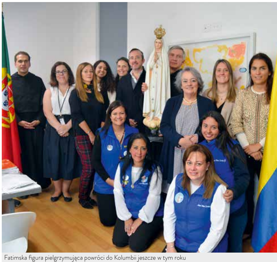
Fatimska figura pielgrzymująca powróci do Kolumbii jeszcze w tym roku