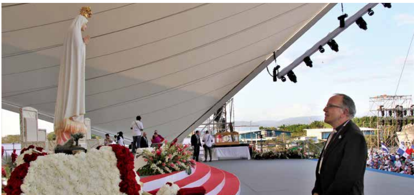
Kardynał patriarcha podkreśla bardzo ważną rolę, jaką Matka Boska Fatimska będzie miała podczas ŚDM w Lizbonie

Prezydent Republiki Portugalii Marcelo Rebelo de Sousa podkreślił, że dokonany przez papieża wybór Lizbony na organizatora ŚDM 2022 jest wielkim wyróżnieniem dla całej wspólnoty państw portugalskojęzycznych, przy czym czynnikiem mającym decydujący wpływ na decyzję Watykanu miało „znaczenie Portugalii, znaczenie Fatimy, znaczenie wiary katolickiej dla portugalskiego ludu”.