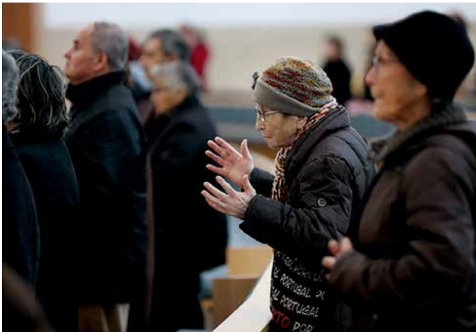
Rektor Sanktuarium Fatimskiego: „Maryja jest Matką zawsze gotową wysłuchać naszych prośb”

w sposób szczególny ukazała swą opiekę jako Matka, która wysłuchuje naszych trosk. Dlatego codziennie przybywają tu tysiące pielgrzymów, aby zawierzyć się Jej macierzyńskiej opiece, aby