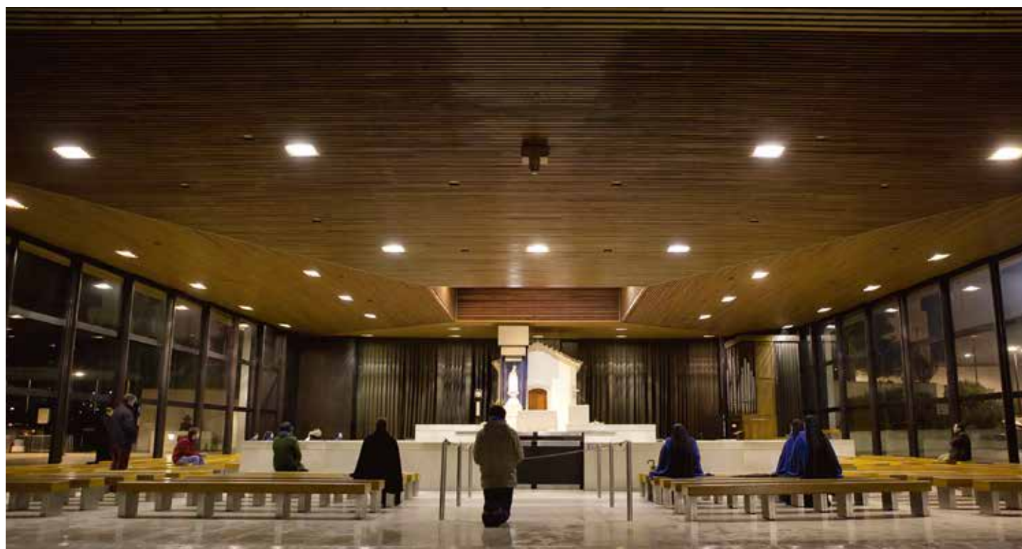
Projekt zadaszania nawiązuje do koncepcji baldachimu procesyjnego, pod którym chronią się pielgrzymi

Dla upamiętnienia 100. rocznicy budowy Kaplicy Objawień, Sanktuarium Fatimskie przygotowało wystawę czasową zatytułowaną „Capela Mundi”. Można ją zwiedzać w sali św. Augustyna (w podziemiach bazyliki Trójcy Przenajświętszej) do 15 października 2019 r., codziennie od 9.00 do 18.00. Od 2 stycznia, codziennie o 11.30 i 15.30, Muzeum Sanktuarium Fatimskiego organizuje zwiedzanie wystawy z przewodnikiem. W pierwszą środę miesiąca od maja do października (1 maja, 5 czerwca, 3 lipca, 7 sierpnia, 4 września i 2 października) odbywają się specjalne zwiedzania poświęcone wybranemu tematowi i prowadzone przez zaproszonych przewodników.