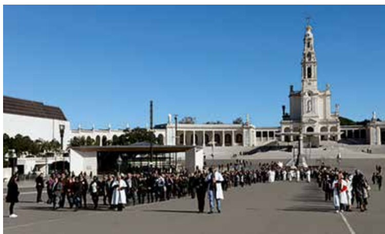
Procesja przed uroczystą Mszą św. prowadzi pielgrzymów z Kaplicy Objawień do bazyliki Trójcy Przenajświętszej

Kościół Trójcy Przenajświętszej został poświęcony 12 października 2007 r. przez kardynała Tarcisio Bertone, ówczesnego sekretarza stanu Stolicy Apostolskiej i legata papieża Benedykta XVI na zamknięcie obchodów 90. rocznicy objawień Matki Boskiej groju widzącym pastuszkom.