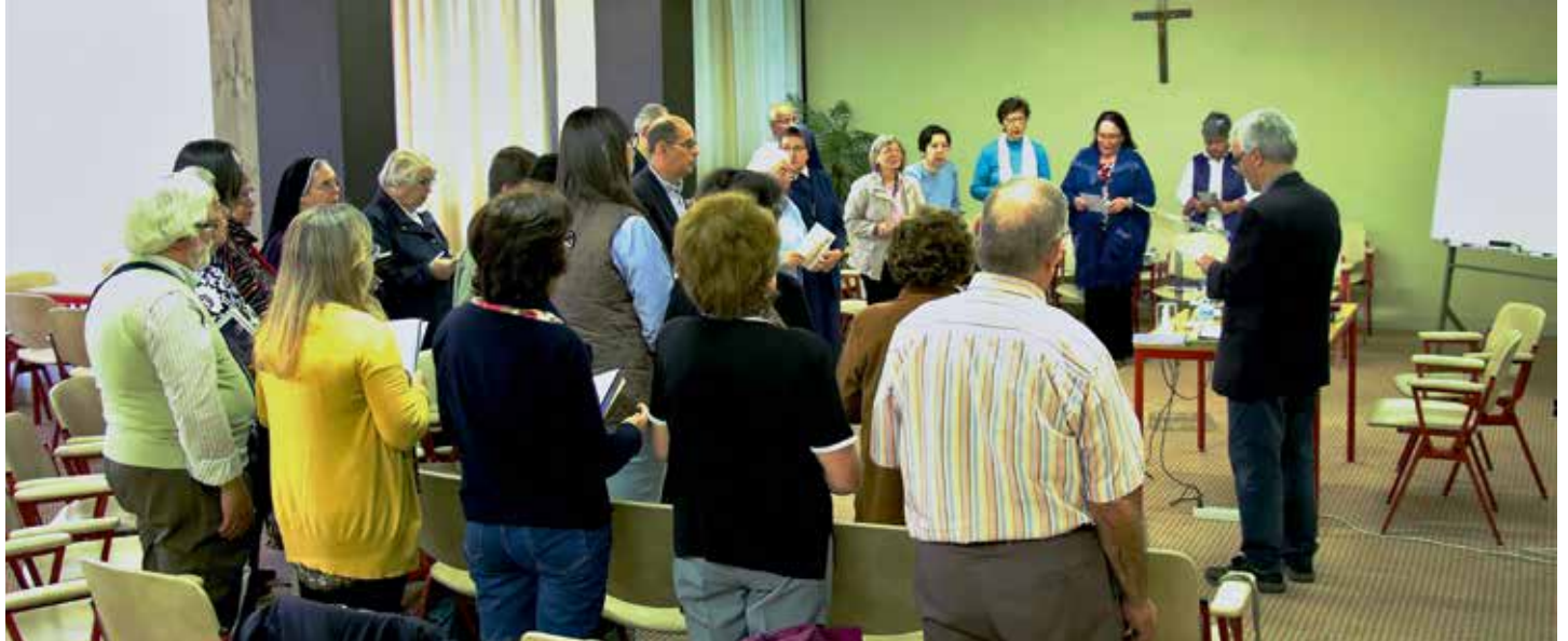
W zajęciach uczestniczy maksymalnie 40 osób

Różaniec jako ewangeliczny przewodnik życia teologalnego – tajemnice różańcowe w rozważaniach duchowości Adwentu, Okresu Zwykłego, Wielkiego Postu i Wielkanocy / Carmo Rodeia