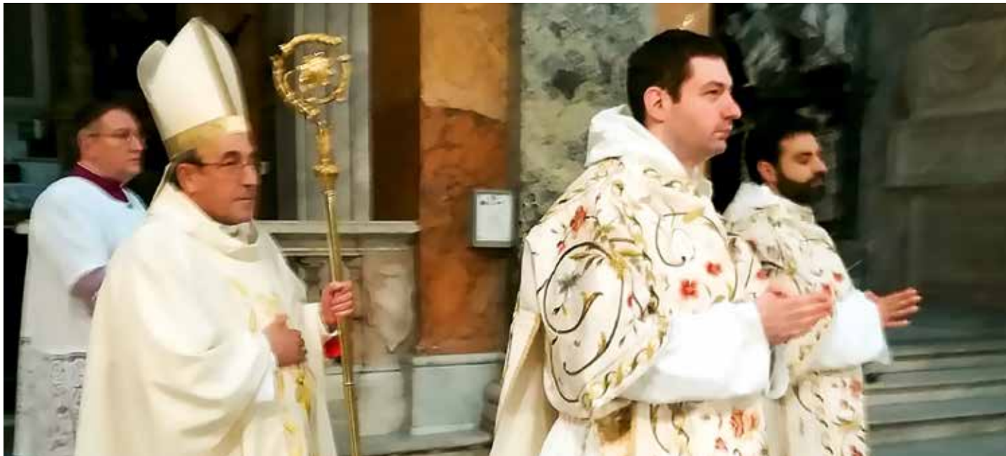
W bazylice Santa Maria sopra Minerva codziennie odmawiany jest różaniec – tak, jak o to prosiła Matka Boska w Fatimie

Biskup diecezji Leirii-Fatimy objął kościół tytularny nadany mu przez papieża Franciszka podczas kreacji kardynalskiej