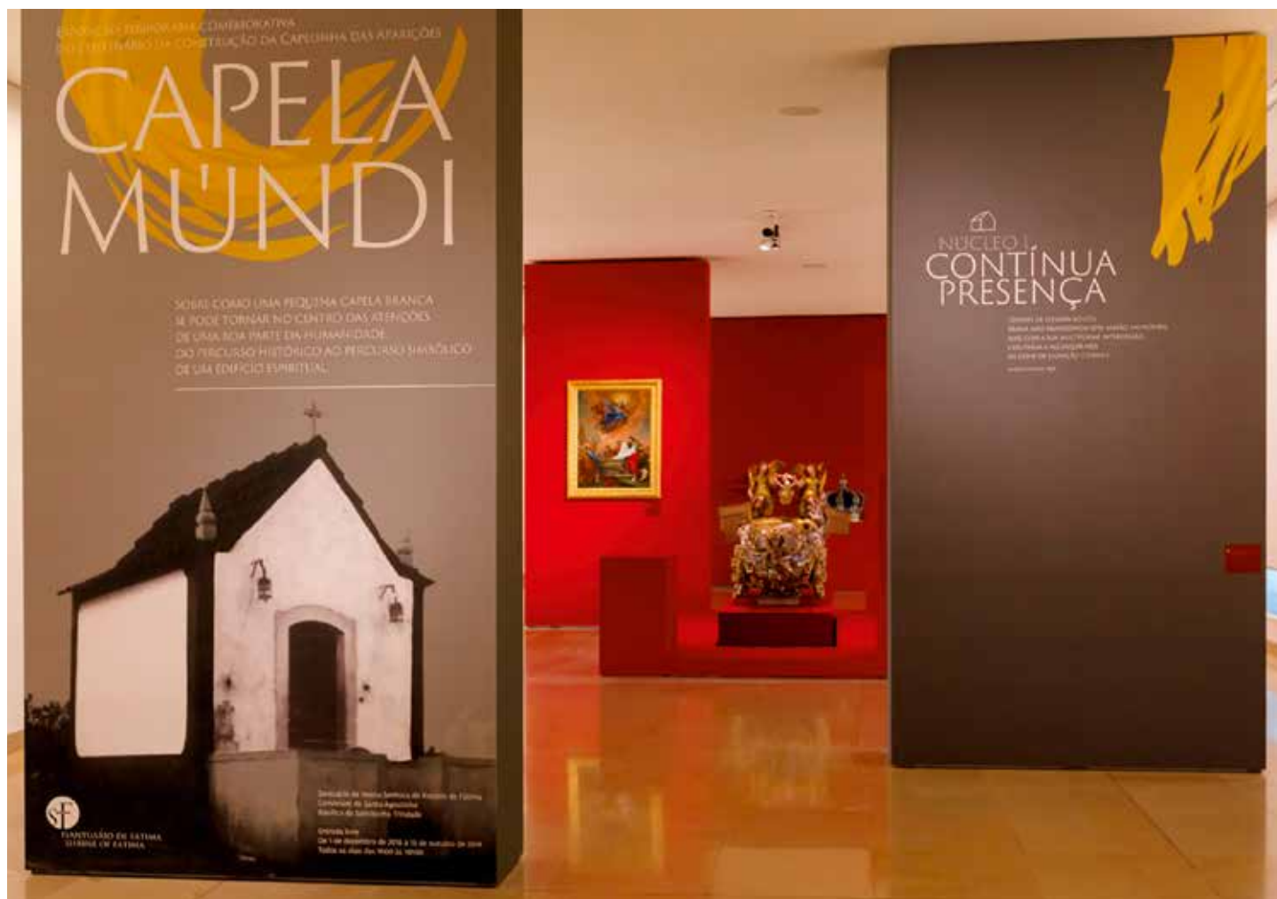
Wystawa proponuje dialog między historią a współczesnością

Kaplica Objawień jest sercem Sanktuarium Fatimskiego