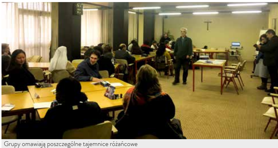
Grupy omawiają poszczególne tajemnice różańcowe

W roku duszpasterskim 2018-2019 „Szkoła” proponuje trzy typy spotkań formacyjnych: przewodniki duchowe, kursy poświęcone orędziu fatimskiemu i warsztaty duszpasterskie.