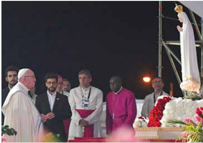
Fotografia do Vaticana

U stóp figury pielgrzymującej Matki Boskiej Fatimskiej papież zachęcał młodych ludzi, aby stali się „Bożym teraz”, czerpali inspirację z Maryi i wpływali na historię Kościoła / Carmo Rodeia