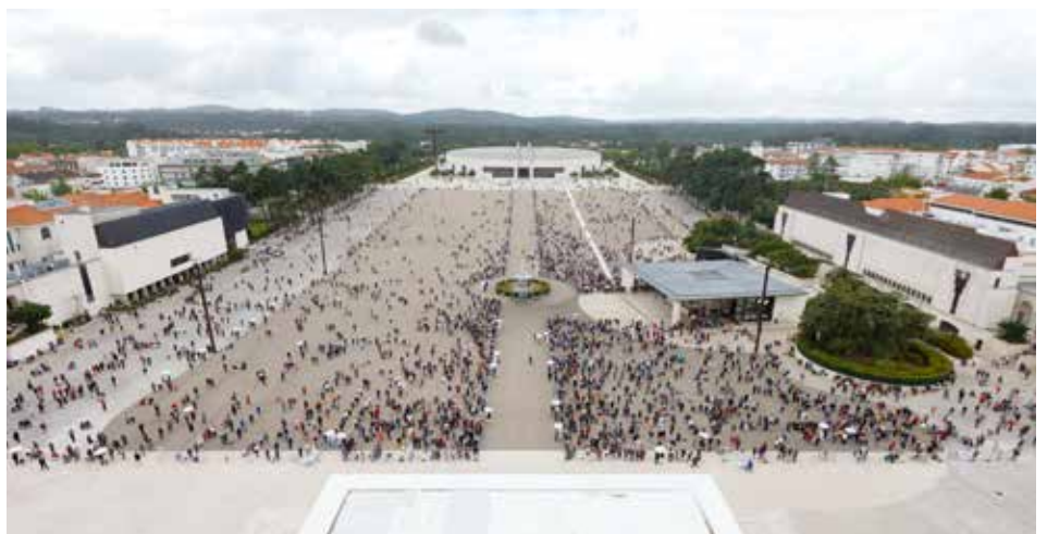
Des milliers de pèlerins présents sur l'Esplanade de Prière, en respectant la distanciation sociale imposée en ces temps

L'évêque auxiliaire de Lisbonne a tenu à se souvenir « des autorités de l'État, des municipalités, des professionnels de santé, des institutions de charité, des établissements pour les personnes âgées, des aides-soignants et des soignants informels », des personnes qui, « en première ligne et de façon anonyme », ont pris soin des frères et des concitoyens décédés ».