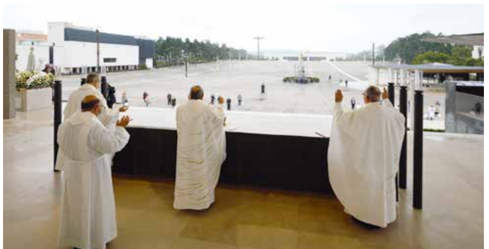
Pour la première fois depuis 1917, les pèlerins dévots étaient absents du Sanctuaire

« Une vie meilleure dans notre maison commune, en paix avec les créatures, avec les autres et avec Dieu, une vie riche en sens exige de la conversion ! Demandons-nous alors si nous avons du temps pour Dieu, si nous lui