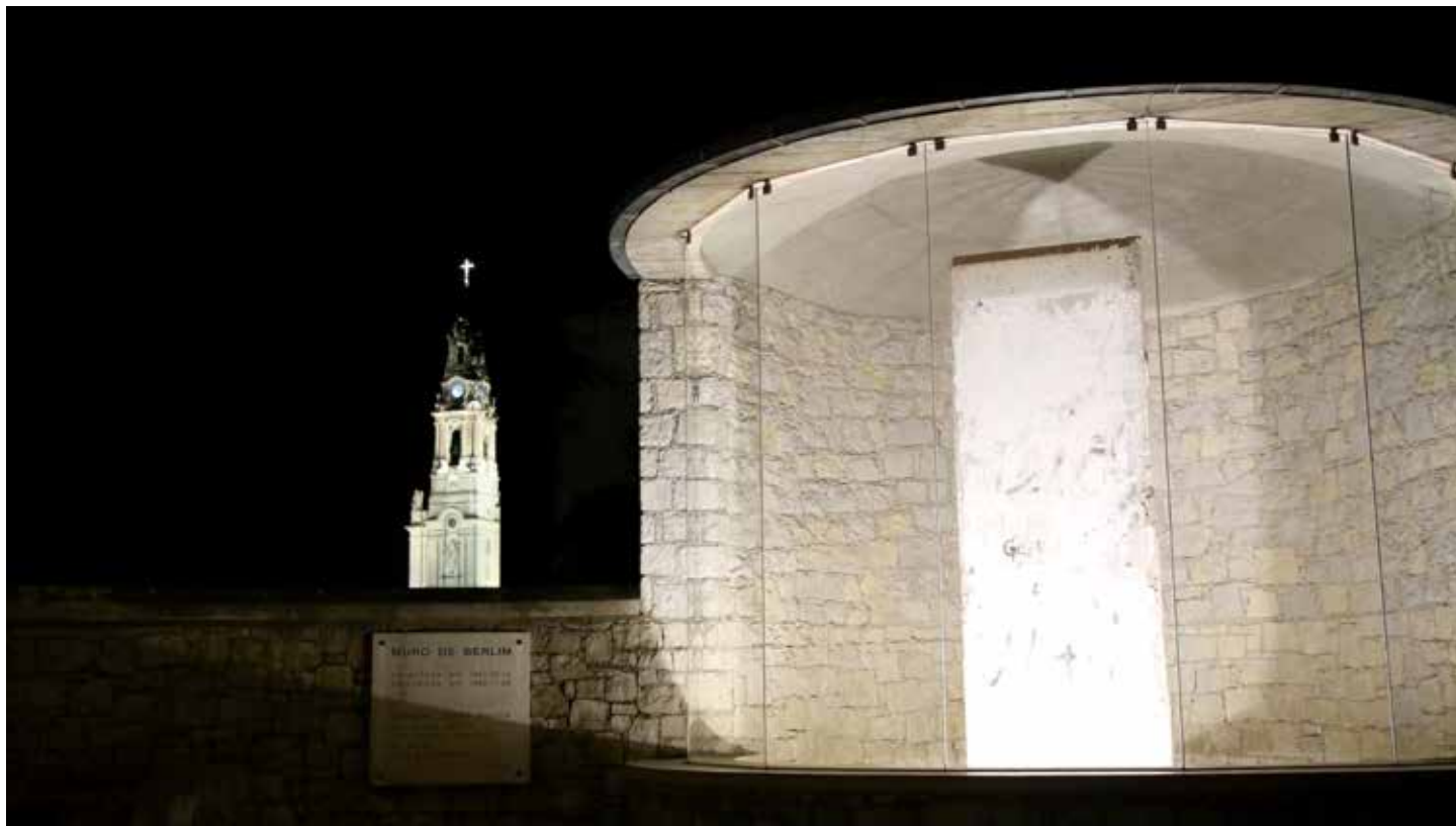
Tous les 13 août, le Sanctuaire promeut un moment de prière auprès du monument