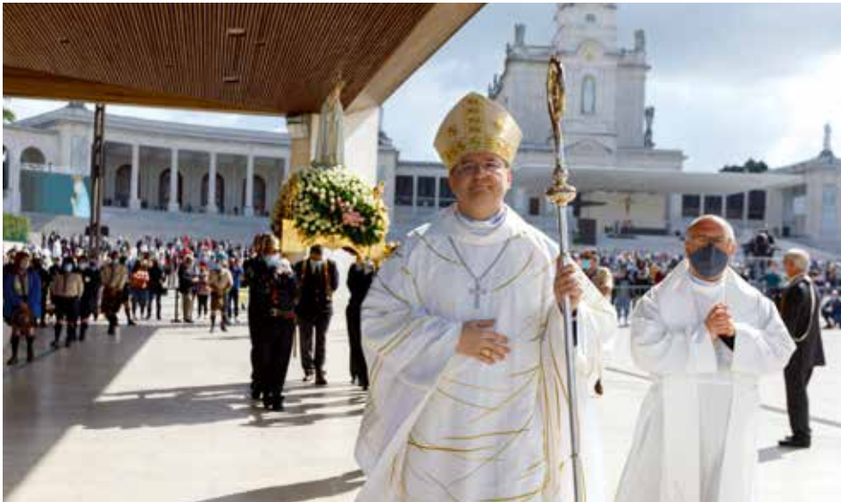
L'évêque auxiliaire de Lisbonne préside pour la première fois un Pèlerinage International Anniversaire à Cova da Iria