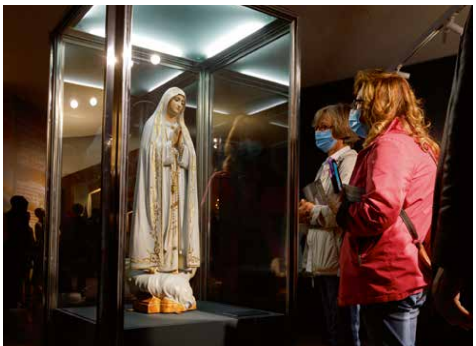
Pendant six heures la Statue était « plus proche » des pèlerins