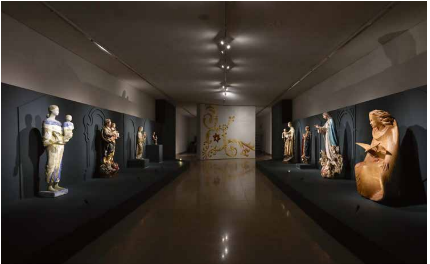
L'exposition commémorative du Centenaire de la Statue vénérée à la Chapelle des Apparitions déjà visitée par 66.198 pèlerins