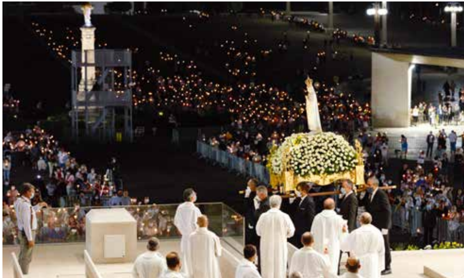
Ce fut le deuxième pèlerinage de l'année à être célébré sur l'Esplanade de Prière, ouvert à la présence de pèlerins

Le président du Pèlerinage International Anniversaire de juillet parle du « triomphe » du Bien promis dans les apparitions de 1917 / Carmo Rodeia