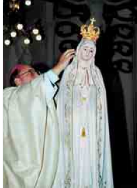
Dans la Cathédrale de l'Immaculée Conception à Moscou le 8.10.2000: couronnement de la statue de Notre Dame de Fátima, avec une couronne bénie par Jean Paul II

Notre Dame à Fátima, croyant qu'un jour Sa prophétie et l'espérance venant de Fátima et qui nous avaient été données, serait la réalité. C'était l'espérance qui ne désillusionne pas: nous sommes témoins du pénible mais heureux