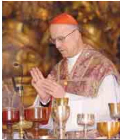
Le Cardinal Bertone a présidé les obsèques de la Sœur Lucie

petits bergers de Fátima) Ce fût une époque de lumière, non seulement parce que le message a pu ainsi être connu de tous, mais aussi parce que la vérité était révélée dans le cadre confus des interprétations et