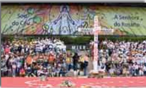
Pendant les Apparitions des 90 ans, le thème fût: "Je suis du Ciel... La Dame du Rosaire"

Le groupe a encore visité la Basilique du Sanctuaire et Aljustrel et Valinhos. Pour clôturer le pèlerinage de Glória Arroyo, le Sanctuaire a offert un dîner au groupe.