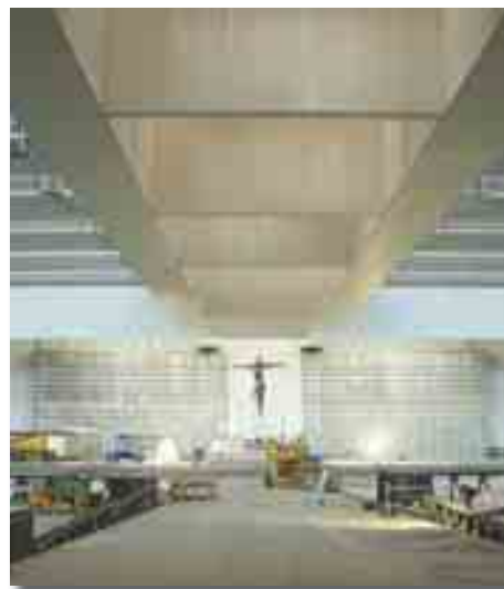
Prototype du Crucifix de l'autel de l'Eglise de la Sainte Trinité, dont l'auteur est l'Irlandaise Catherine Green

* Croix Haute, à l'extérieur de l'Eglise – Auteur: Robert Schad (Allemagne)