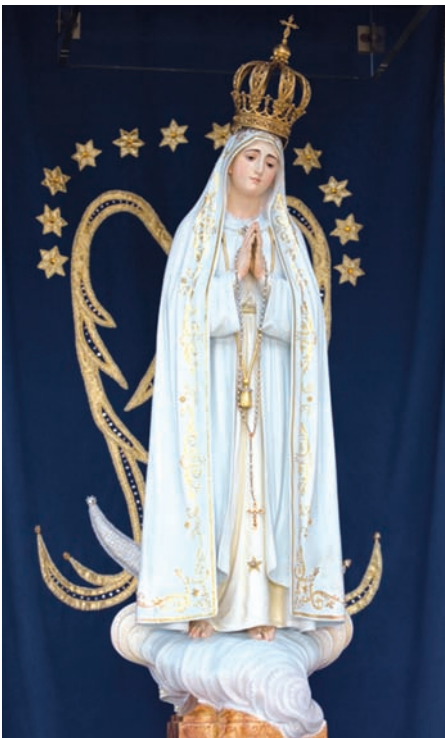
Figura Matki Boskiej Różańcowej z Fatimy opuszcza Kaplicę Objawień tylko przy wyjątkowych okazjach.

Pierwsza podróż figury Matki Boskiej Fatimskiej z Kaplicy Objawień odbyła się w dniach 7-13 kwietnia 1942 roku w związku z zamknięciem kongresu zorganizowanego