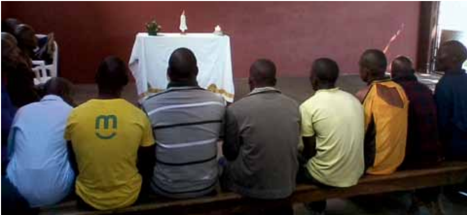
Privés de liberté, mais dans la liberté d'unir le ciel et la terre, par Marie

Il y a quelques semaines, un détenu de la Prison Centrale de Maputo m'a demandé si nous pouvions commencer à prier le chapelet en prison. J'ai accepté avec joie sa demande et j'ai proposé d'organiser la prière, en demandant aux autres détenus s'ils avaient intérêt à cette initiative.