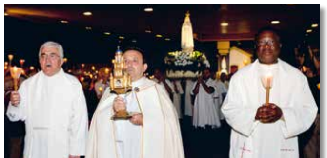
tableau en plâtre du Cœur Immaculé de Marie a versé des larmes, sans arrêt, pendant 75 heures.