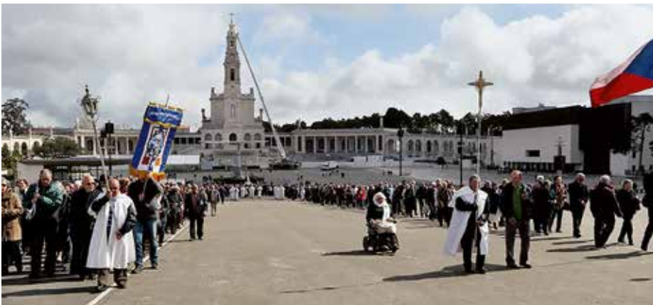
Peregrinación de abril contó con la presencia de cinco grupos de peregrinos