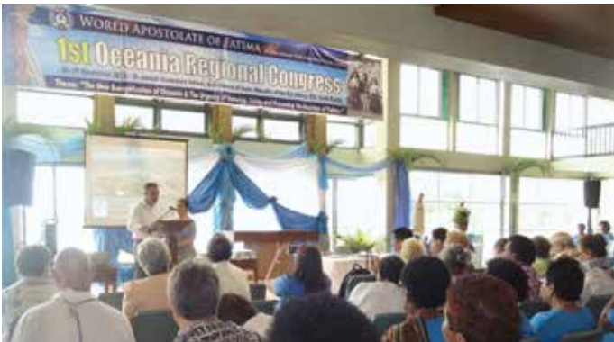
El congreso acogió a centenares de personas oriundas de varios países

El Apostolado Mundial de Fátima realizó su primer congreso sobre el mensaje de Fátima destinado a la región de Oceanía, en la archidiócesis de Suva, Islas Fiji, del 26 al 29 de noviembre de 2015. Los cuatro días de encuentro tuvieron como tema general “La nueva evangelización de Oceanía y la urgencia de vivir y difundir el mensaje de Fátima”. El evento reunió a centenares de personas devotas de Nuestra Señora, oriundas de las Islas Fiji y de algunos países vecinos, como Australia, islas Samoa, Salomón, Samoa Americana y representantes de países más distantes, tales como Filipinas, Estados Unidos, Portugal y Puerto Rico.