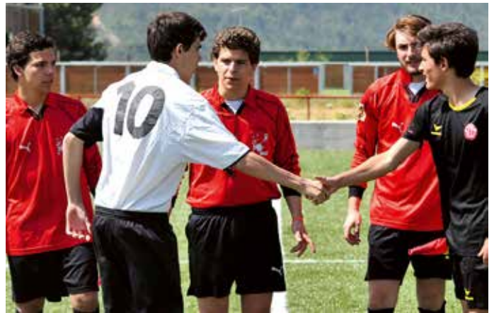
Actividades espirituales son intercaladas con actividades lúdicas y deportivas

Durante esta semana realizan innumerables actividades como fútbol, baloncesto, cine, juegos de preguntas sobre Europa y literatura. Estos jóvenes visitan también hogares de enfermos y el centro de apoyo a deficientes profundos Juan Pablo II, para animar y compartir la experiencia del sufrimiento humano.