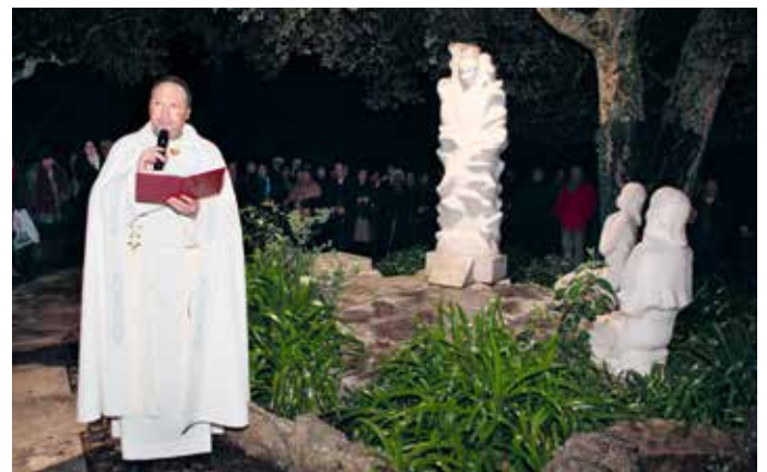
Reitor relembrou mensagem do Anjo no poço do Arneiro