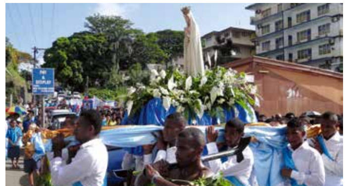
Na abertura do congresso, a imagem de Nossa Senhora foi levada por um grupo de jovens