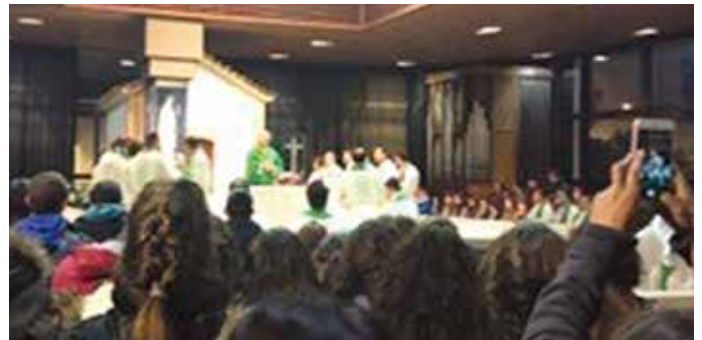
Grupo espanhol ofereceu uma custódia ao Santuário de Fátima

«Começamos geralmente em novembro com cartas dirigidas às paróquias, aos mosteiros e conventos para que rezem