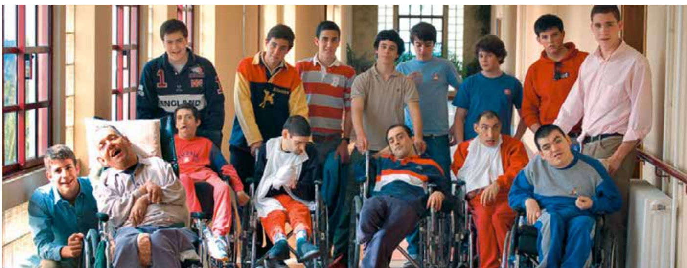
Centro João Paulo II foi um dos locais visitados pelos jovens