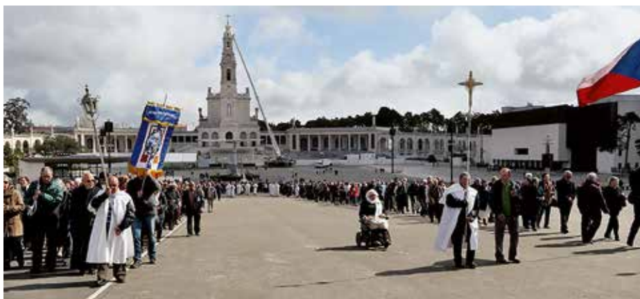
Peregrinação de abril contou com a presença de cinco grupos de peregrinos

O Reitor do Santuário de Fátima, Pe. Carlos Cabecinhas, disse na homília da missa da peregrinação mensal de abril no Santuário, celebrada na Basílica da Santíssima Trindade, que «só a fé pode abrir os nossos olhos para esta realidade nova, capaz de transformar as nossas vidas», que é a experiência de Cristo ressuscitado.