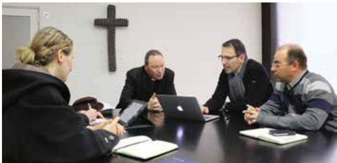
Organizadores de encontro internacional de ARS visitaram o Santuário de Fátima

O Santuário de Fátima vai receber o congresso e a assembleia-geral da Associação (francesa) de Reitores de Santuários, em janeiro de 2017.