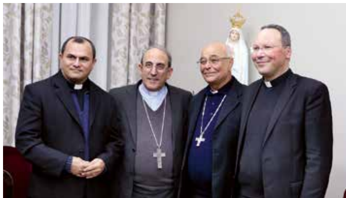
Paróquia de Nossa Senhora de Fátima, em Aracaju, realiza peregrinação ao Santuário em novembro