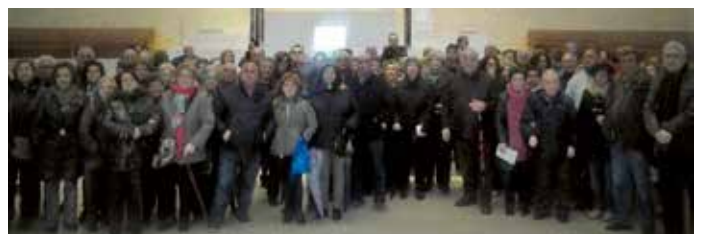
A peregrinação decorreu de 3 a 6 de março