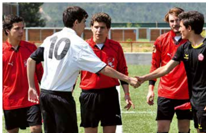
Atividades espirituais são intercaladas com atividades lúdicas e desportivas

Durante esta semana realizam inúmeras atividades como futebol, futsal, basquetebol, cinema, jogos de quiz sobre a Europa e literatura. Estes jovens visitam ainda lares de idosos e o centro de apoio a deficientes profundos João Paulo II, para fazer animação e partilhar a experiência do sofrimento humano.