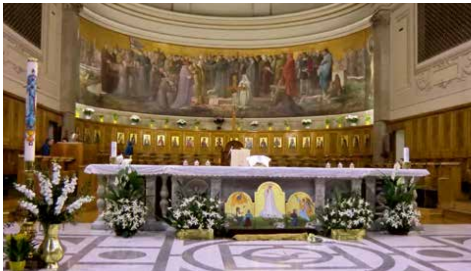
Basílica de Sant'Antonio al Laterano celebrou dia dos Pastorinhos

No dia 18 de fevereiro foram acolhidas a imagem de Nossa Senhora de Fátima e as dos beatos Francisco e Jacinta Marto, assim como as suas relíquias. Neste mesmo dia foi realizada uma catequese sobre Francisco Marto, onde foram abordados a vida e os ensinamentos do jovem vidente que, apesar da curta vida que teve, a passou em momentos de adoração. Durante a missa vespertina, todos os que o desejaram tiveram a oportunidade de venerar as relíquias dos Pastorinhos.