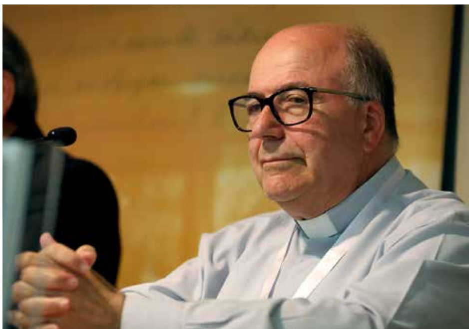
Ancien directeur du Département d'Études honoré en 2017

Le 15 août 1962, il est ordonné prêtre et cette même année est entré à l'Université pontificale grégorienne, à Rome. Durant ces cinq années passées dans la ville éternelle, il obtient une licence en théologie dogmatique, en histoire ecclésiastique et a encore pu suivre de près l'ouverture du Concile Vatican II et l'élection de celui qui allait devenir le premier Pape à se