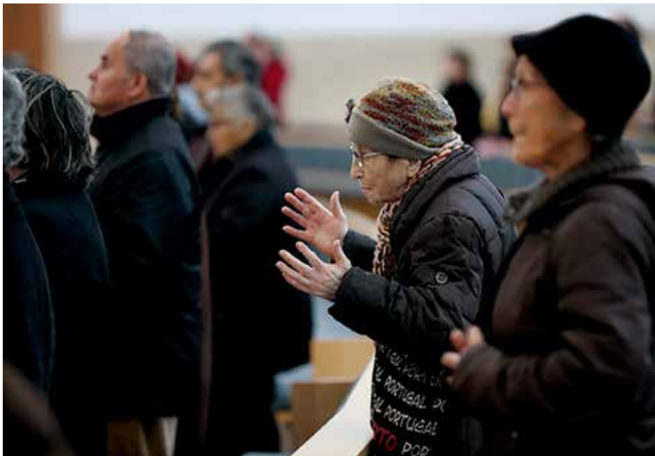
Marie est la « Mère toujours attentive à nos supplications » dit le Recteur

Au long de l'histoire de l'Église et de l'humanité, Marie a toujours eu une place primordiale et c'est pour cela que les chrétiens ont recouru et recourent « confiants à son aide et à sa protection, parce qu'elle est Mère, toujours attentive à nos supplications ; et nous recourons confiants en Elle en toutes difficultés ».