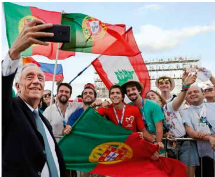
L'Église et l'État portugais organiseront les Journées mondiales de la jeunesse 2022 à Lisbonne

La décision du pape François, annoncée au Panama, a été applaudie par l'Église et par la société civile