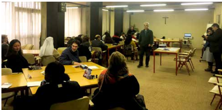
Les groupes sont divisés selon les mystères

Pour l'année pastorale 2018-2019, l'École dispose de trois propositions de formations différentes : les Itinéraires de Spiritualité, un Cours sur le Message de Fatima et les Ateliers Pastoraux.