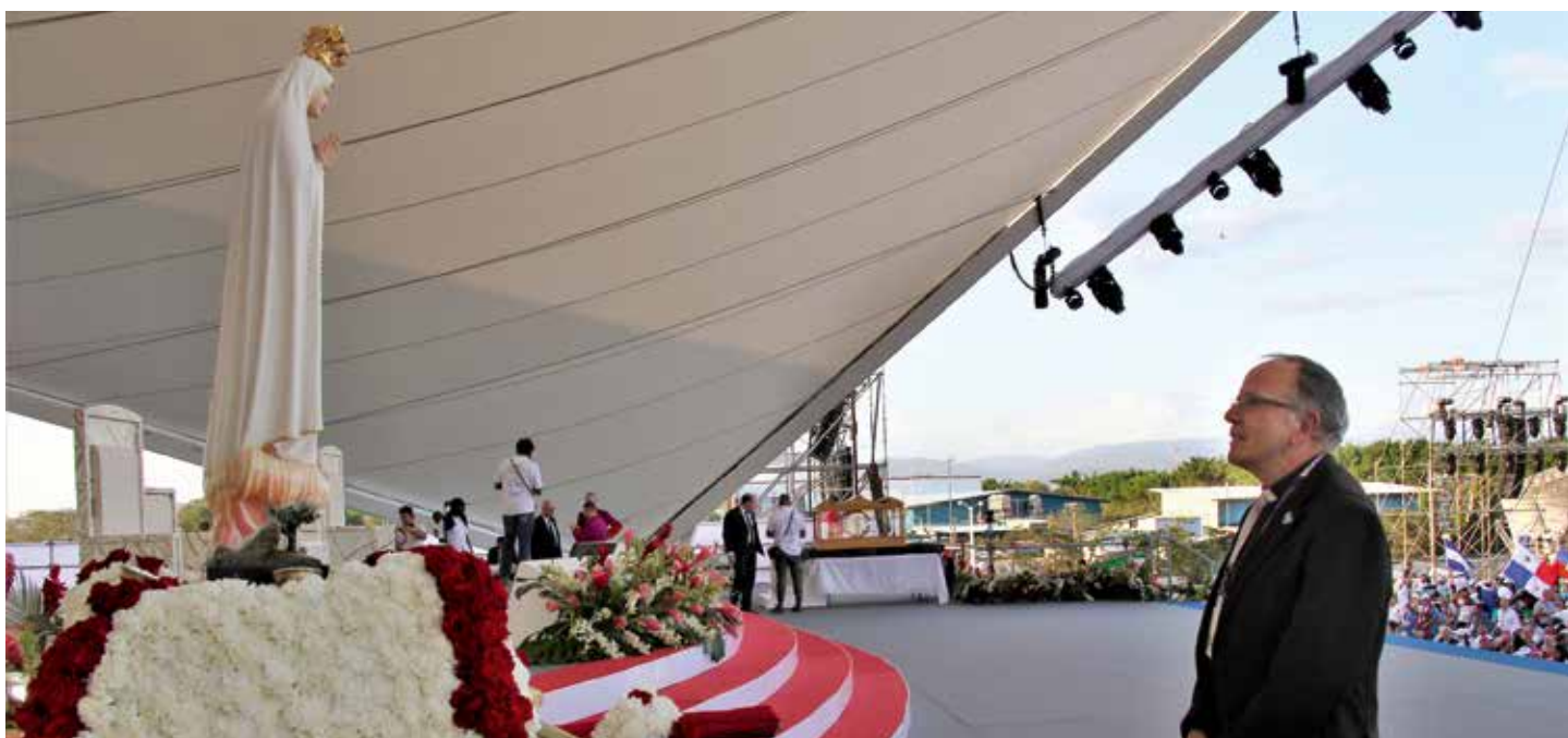
Le cardinal patriarche insiste sur le rôle « extrêmement fort » de la Vierge pèlerine lors des futures JMJ de Lisbonne

Le président de la République, Marcelo Rebelo de Sousa, a souligné, pour sa part, l'importance de ce choix pour l'affirmation de la lusophonie, et le chef de l'État a insisté sur « le poids du Portugal, le poids de Fatima, le poids du peuple catholique » pour justifier le choix du Vatican.