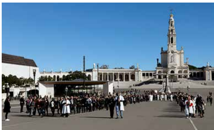
Procession précède la messe du pèlerinage et conduit les pèlerins de la Chapelle à la Basilique de la Très Sainte Trinité

La Basilique de la Très Sainte Trinité fut consacrée le 12 octobre 2007 par le Cardinal Tarcisio Bertone, alors Secrétaire de l'État du Vatican et légat de Benoît XVI pour la clôture du 90 ème anniversaire des apparitions de Notre-Dame aux trois petits bergers voyants.