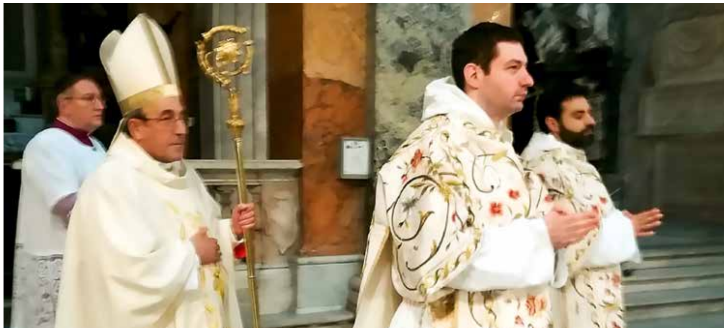
À Sainte Marie sur Minerve on prie le chapelet tous les jours, conformément à la demande de Notre-Dame aux Petits Bergers

L'Évêque de Leiria-Fatima a pris possession de la Basilique qui lui fut attribuée par le Pape François lors de sa création cardinalice