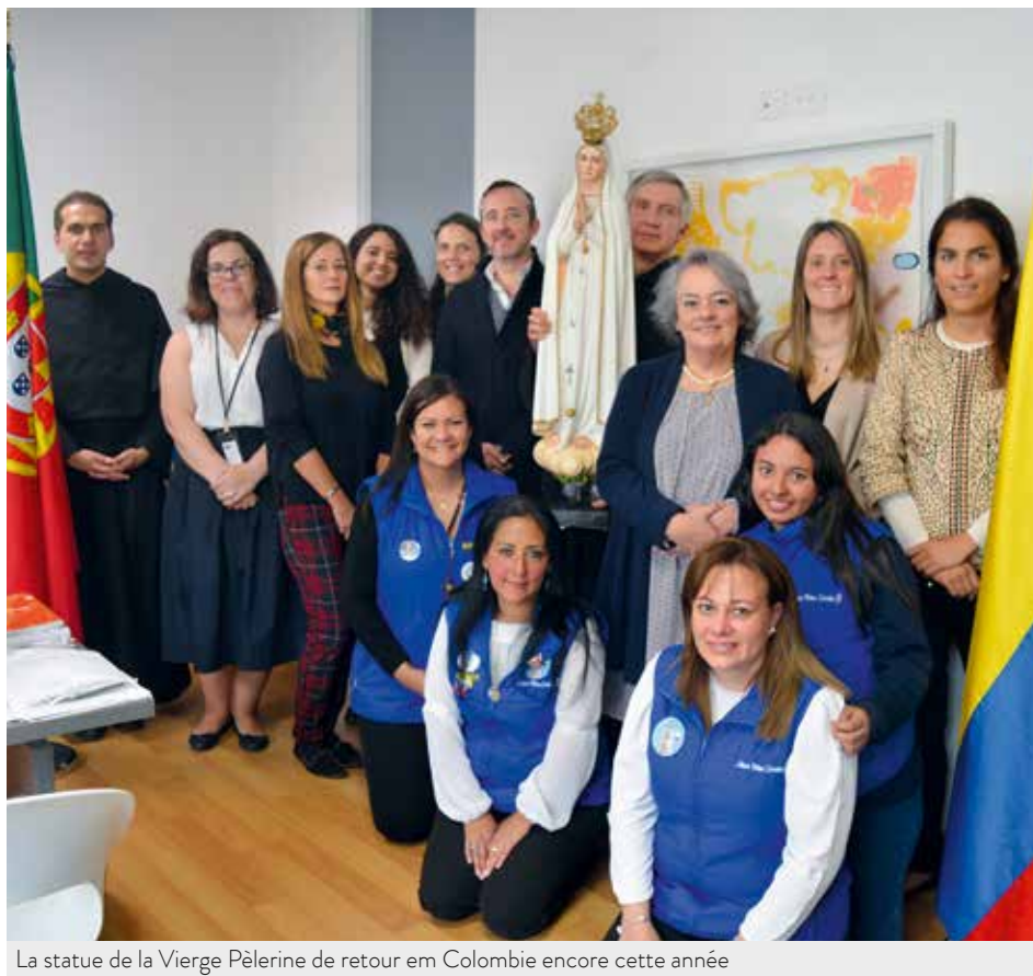
La statue de la Vierge Pèlerine de retour em Colombie encore cette année