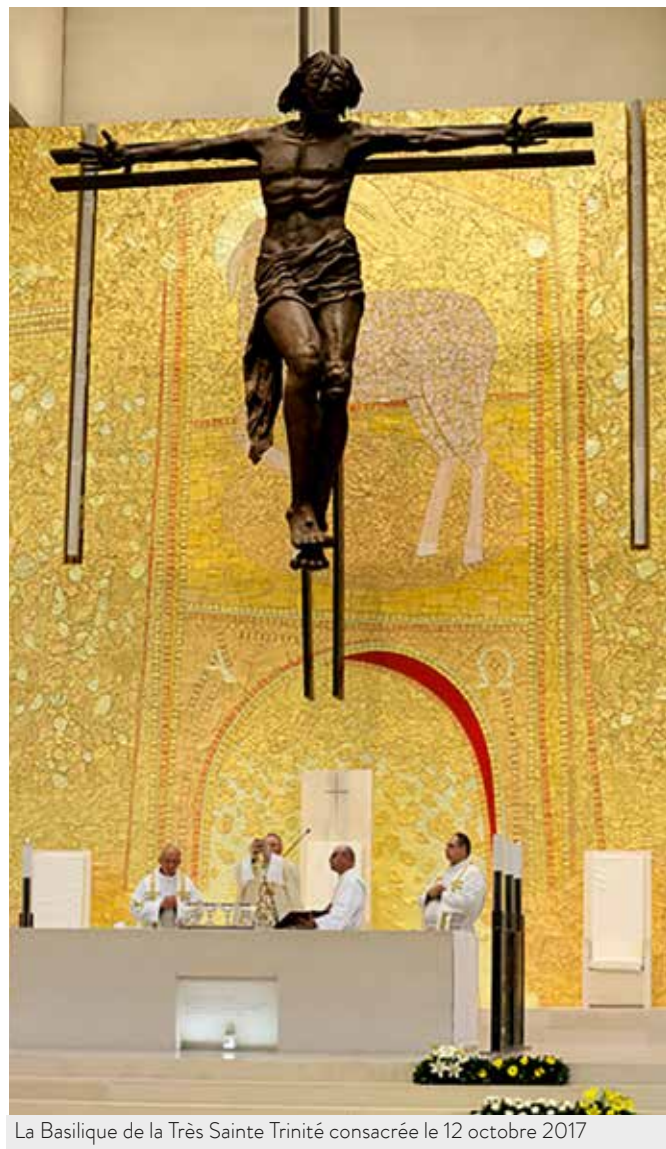
La Basilique de la Très Sainte Trinité consacrée le 12 octobre 2017

Les nouvelles de ce bulletin peuvent être publiées librement. La source et l'auteur, selon le cas, doivent être identifiés.