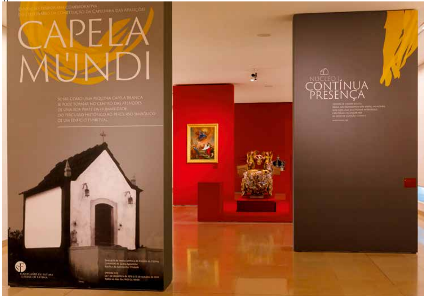
L'Exposition propose un dialogue entre l'histoire et la contemporanéité

L'Exposition prétend montrer la Chapelle des Apparitions comme le cœur du Sanctuaire / Diogo Carvalho