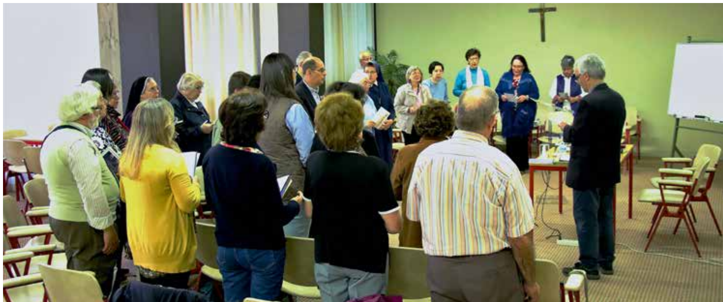
Les Itinéraires s'organisent en groupes de 40 participants

Le Rosaire est présenté comme itinéraire évangélique de vie théologique en accordant les mystères à la spiritualité de l'Avent, du Temps Ordinaire, du Carême et de Pâques / Carmo Rodeia