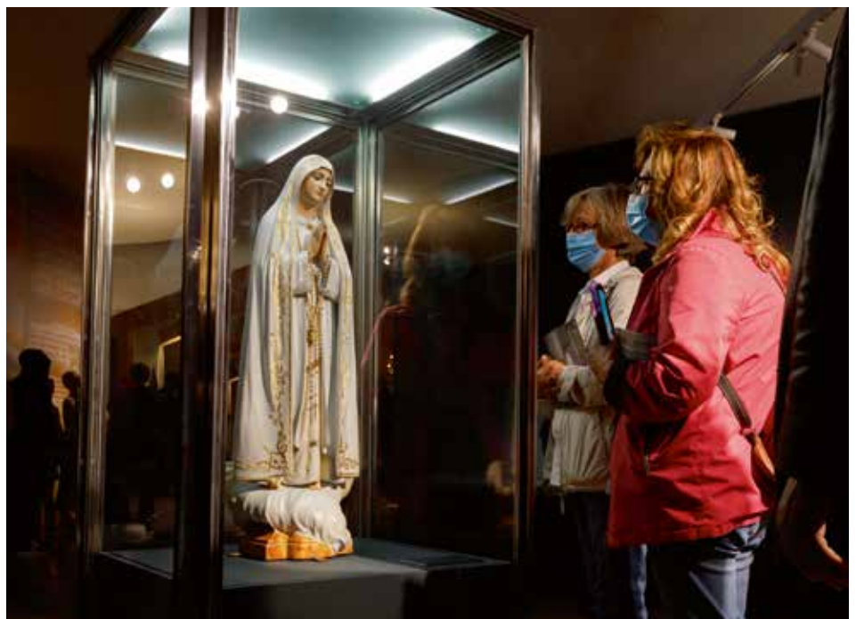
Durante seis horas la imagen estuvo “más cerca” de los peregrinos