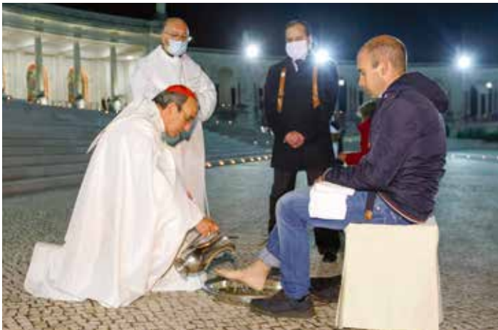
El cardenal repite el gesto del lavado de pies, como el Jueves Santo