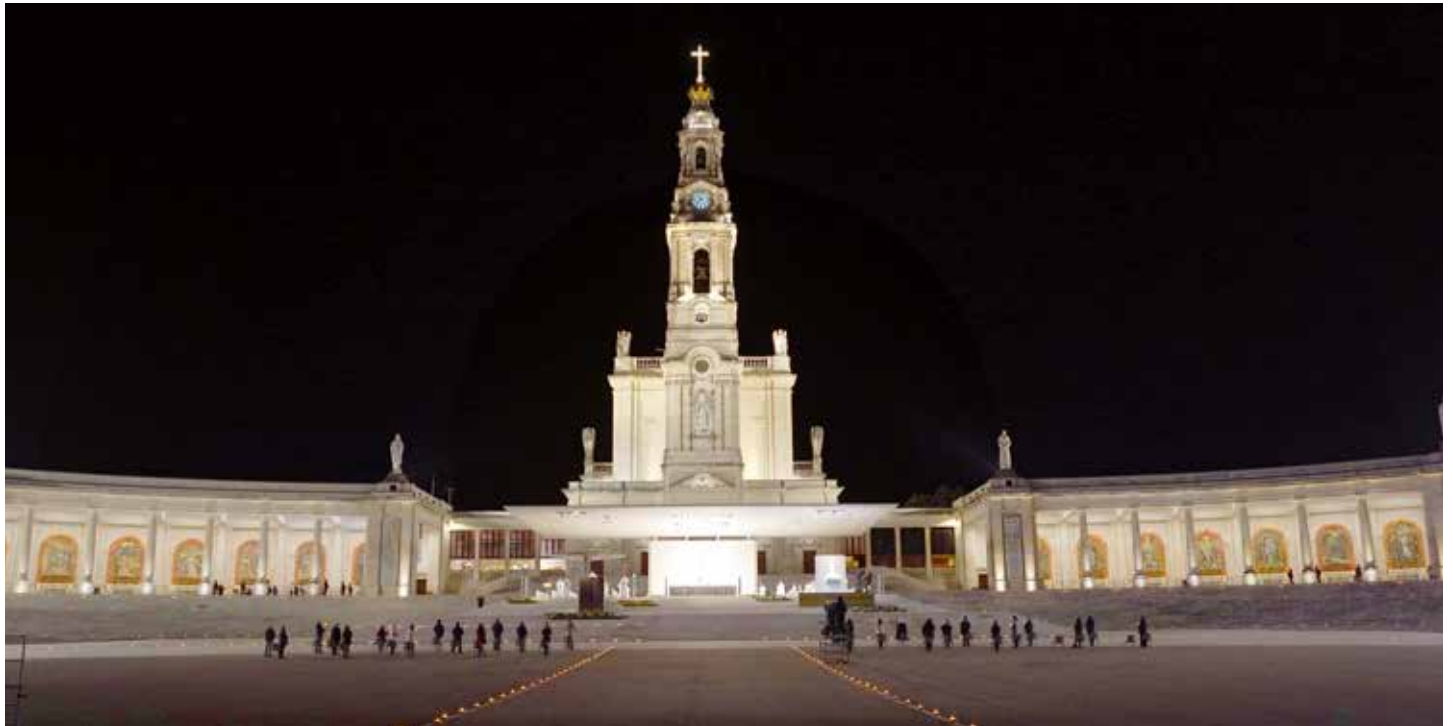
A la celebración minimalista contó solamente con la presencia de empleados del Santuario

Durante 24 horas, por primera vez en su historia, los peregrinos no pudieron entrar en el Santuario de Fátima.