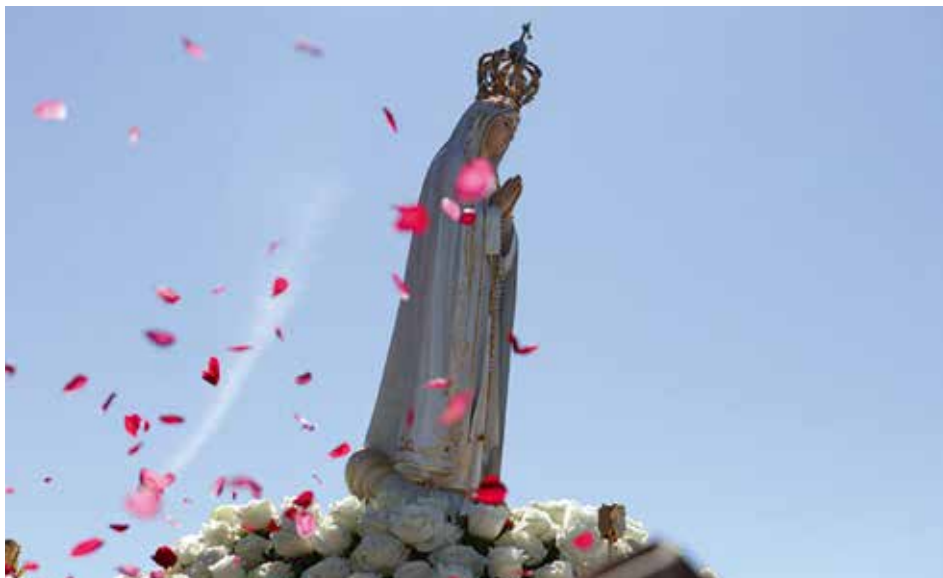
La imagen que se venera en la Capelinha ha estado en el Vaticano tres veces

del Secreto de Fátima: “Según la interpretación de los “Pastorcitos”, una interpretación también recientemente confirmada por la Hermana Lucía, el “Obispo vestido de blanco” que reza por todos los fieles es el Papa. Él también, caminando cansinamente hacia la cruz entre los cadáveres de los mártires (obispos, sacerdotes, religiosos y religiosas, y muchos laicos, cae al suelo como muerto, bajo los golpes del arma de fuego)».