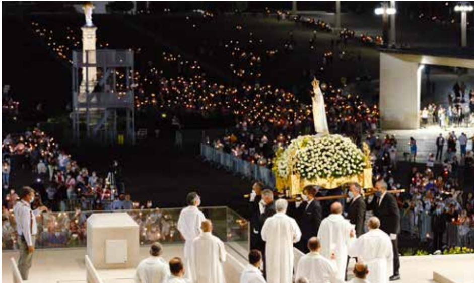
Esta fue la segunda peregrinación del año que se celebró con el Recinto abierto a la participación de los peregrinos

El presidente de la Peregrinación Internacional Aniversaria de julio habla del “triumfo” del bien, prometido en las apariciones de 1917