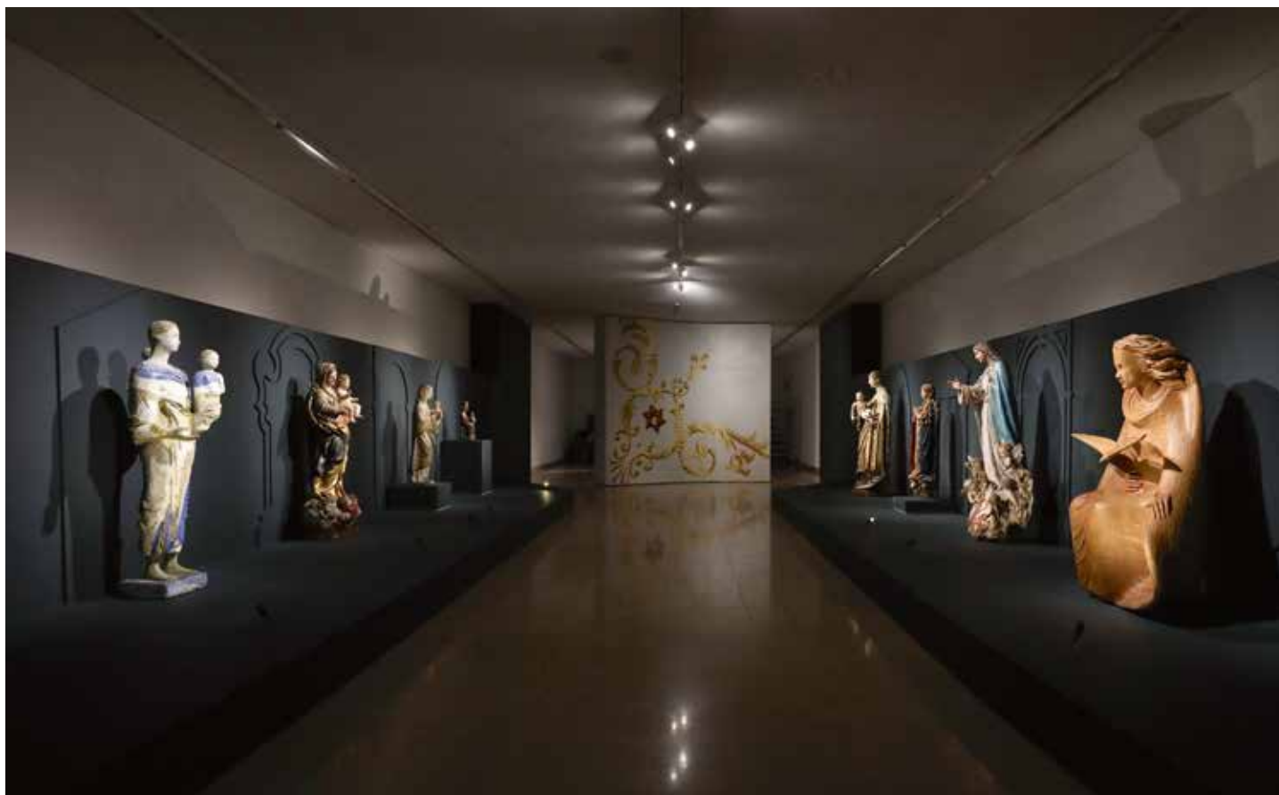
La exposición conmemorativa del Centenario de la Imagen que se venera en la Capilla de las Apariciones ya ha sido visitada por 66.198 peregrinos.

inferior de la Basílica de la Santísima Trinidad, hasta el 15 de octubre, y se puede visitar entre las 9:00h y las 12:45h (última entrada) y las 14:00h y las 17:45h (última entrada), de martes a domingo.