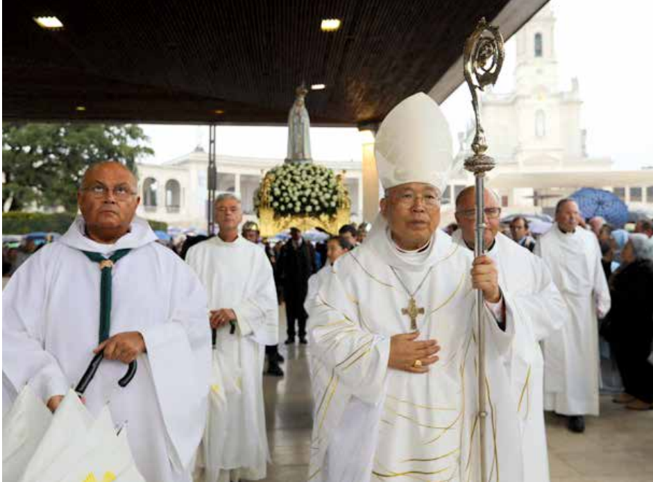
El cardenal surcoreano presidió la Peregrinación Internacional Aniversaria de octubre de 2019

La iniciativa del cardenal surcoreano Andrew Yeom fue anunciada en una celebración el pasado día 25 de junio