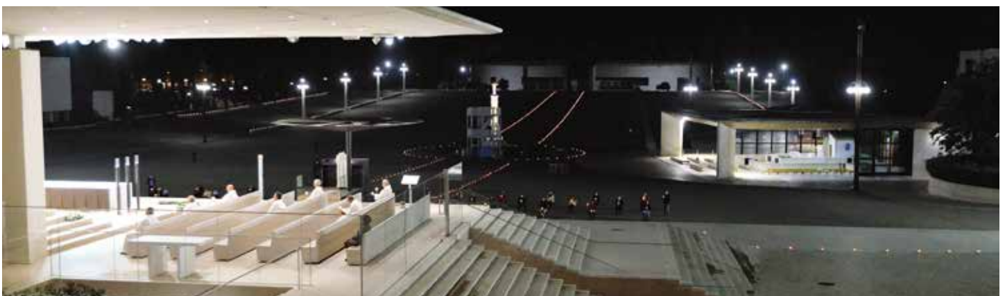
Físicamente ausentes de Cova da Iria, los peregrinos fueron el elemento más presente de la celebración

"Me gustaría acercarme, con el corazón, a la Diócesis de Leiria-Fátima, al Santuario de Nuestra Señora, hoy: saludo a los peregrinos que rezan allí, saludo al Cardenal-Obispo, saludo a todos, todos unidos con Nuestra Señora, que nos acompaña en este camino de conversión diaria a Jesús. Que Dios los bendiga", dijo, durante la audiencia general que tuvo lugar en la biblioteca del Palacio Apostólico, a puerta cerrada, con retransmisión on-line .