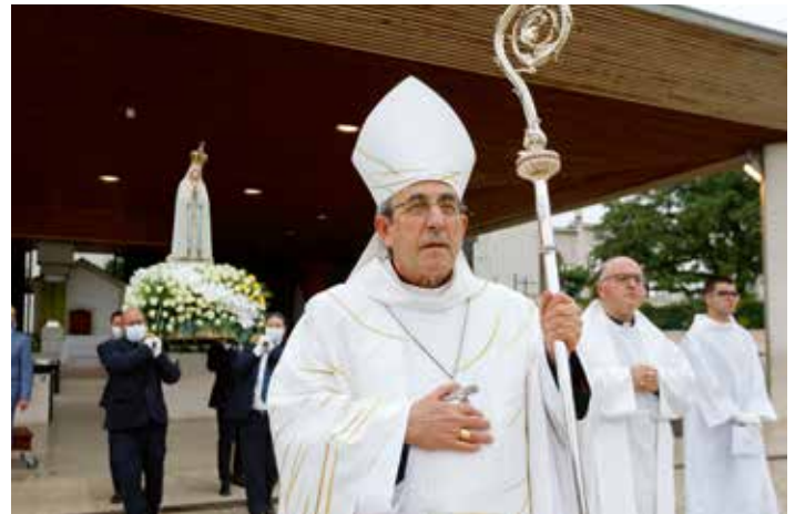
El obispo de Leiria Fátima no pudo ocultar "la tristeza que había en el alma"

merece en nuestros corazones y en nuestras vidas", subrayó.