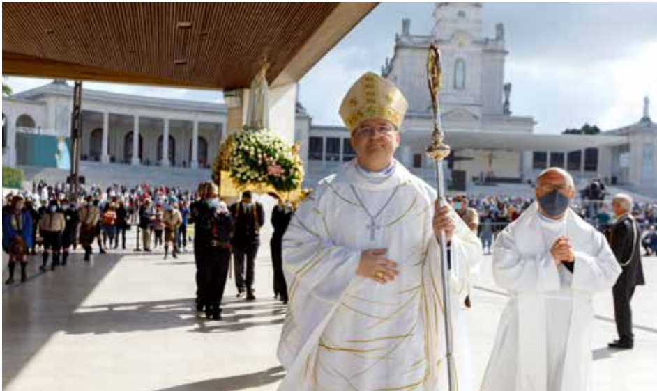
El obispo auxiliar de Lisboa preside por primera vez una Peregrinación Internacional Aniversaria en Cova da Iria