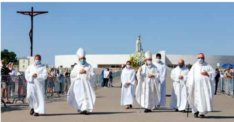
“Todos te necesitamos, Madre, Señora de Fátima, porque todos somos y queremos ser tus hijos, escuchando tus llamadas y respondiendo a tus invitaciones”

El obispo auxiliar de Oporto también subrayó la promesa dejada en Fátima de la victoria definitiva del “corazón de la Paz, del Bien, de la Bondad”.