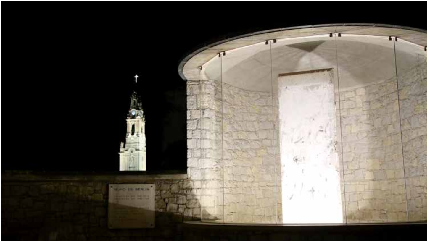
Cada 13 de agosto, el Santuario siempre promueve un momento de oración al lado del monumento

El día en el que se celebra el centenario del nacimiento del Papa polaco, un fragmento del Muro de Berlín llegó al Museo de Juan Pablo II y al Primado Wyszyński en Varsovia. El documento que prueba la donación fue entregado a los representantes del gobierno polaco por el embajador alemán en Polonia, Rolf Wilhelm Nikel.