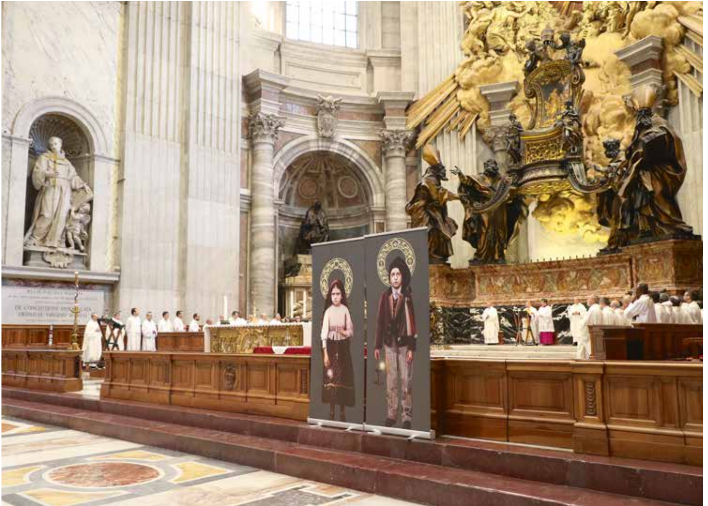
Las dos lámparas que iluminan a la humanidad cobraron vida propia desde los altares de la Iglesia

Las peticiones de reliquias, que continúan creciendo, y la aparición de muchos lugares de culto y oración con la designación de sus nombres muestran cómo este culto se está expandiendo / Carmo Rodeia