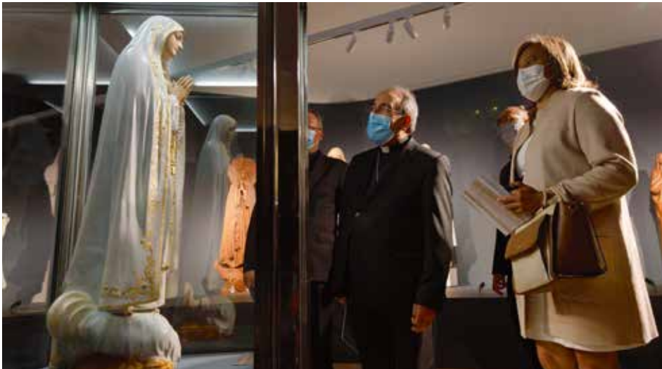
Santuario marcó el evento proporcionando una relación más estrecha entre la Imagen y los peregrinos

Exposición temporal puede ser visitada hasta el 15 de octubre