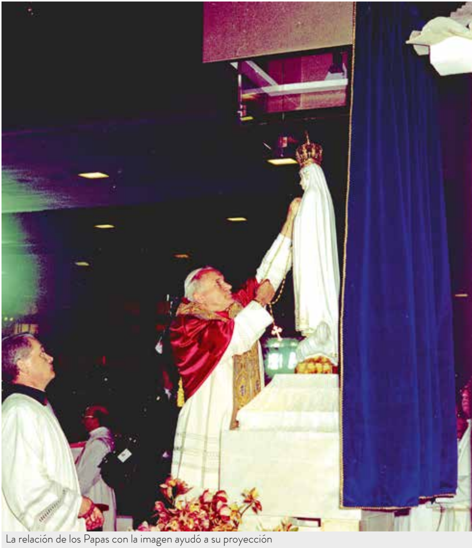
La relación de los Papas con la imagen ayudó a su proyección

“La conexión entre San Juan Pablo II y la Virgen María fue ciertamente muy intensa y su rasgo característico es el sentido materno-filial” / *Piero Marini