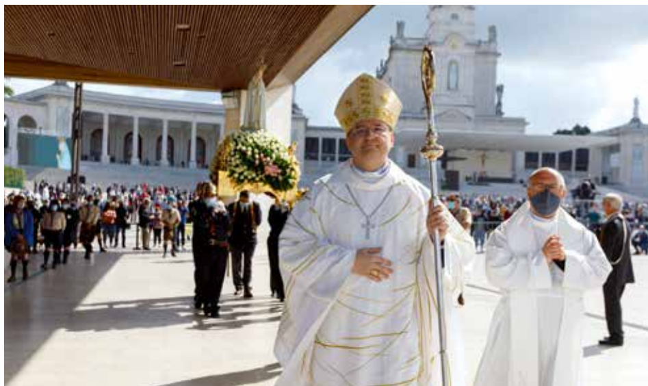
Biskup pomocniczy Lizbony po raz pierwszy przewodniczył międzynarodowej pielgrzymce rocznicowej w Cova da Iria