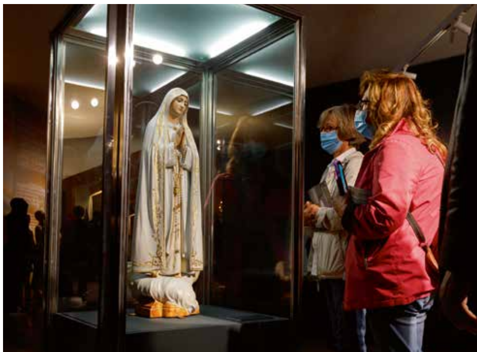
Przez sześć godzin pielgrzymi mieli figurę „na wyciągnięcie ręki”