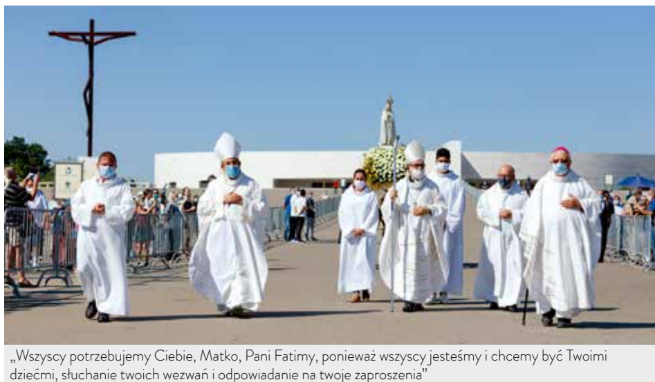
„Wszyscy potrzebujemy Ciebie, Matko, Pani Fatimy, ponieważ wszyscy jesteśmy i chcemy być Twoimi dziećmi, słuchanie twoich wezwań i odpowiadanie na twoje zaproszenia”

Pielgrzymka w lipcu była drugą w tym roku uroczystością rocznicową objawień, którą świętowano na Placu Modlitwy, otwartym dla pielgrzymów. Przypomnijmy, że pielgrzymka w maju odbywała się w czasie, spowodowanego przez pandemię zakazu sprawowania nabożeństw z udziałem wiernych. Sanktuarium Fatimskie realizowało wówczas skrócony program uroczystości (bez trwającego aż do świtu czuwania modlitewnego).