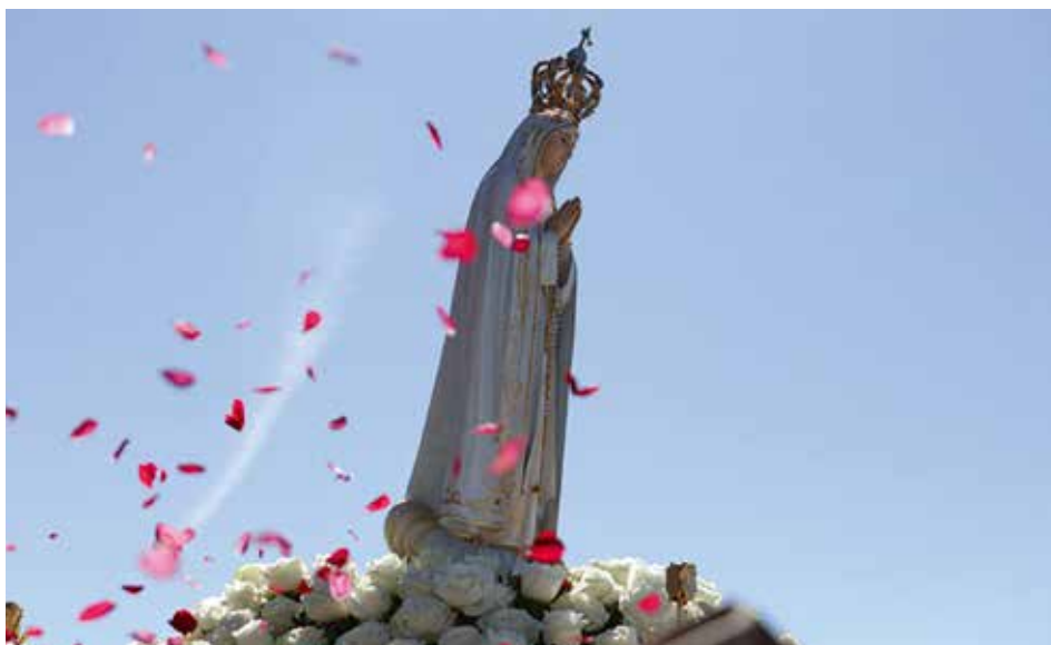
Figura Matki Boskiej z Kaplicy Objawień trzy razy odwiedziła Watykan

mi przez Sekretarza Stanu, kardynała Angelo Sodano, na temat trzeciej części tajemnicy fatimskiej: „Według interpretacji samych pastuszków, potwierdzonej też niedawno przez siostrę Łucję, «biskup odziany w biel», który modli się za wszystkich wiernych, to papież. Również on, krocząc z trudem ku krzyżowi pośród ciał zabitych męczenników (biskupów, kapłanów, zakonników, zakonnic i licznych wiernych świeckich), pada na ziemię jak martwy, rażony strzałami z broni palnej”.