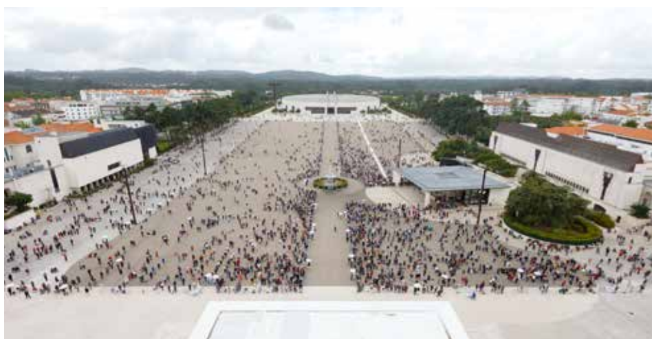
Tysiące pielgrzymów obecnych na Placu Modlitwy przestrzegało wyznaczonych zasad dystansu społecznego

Podczas uroczystości biskup pomocniczy Lizbony dziękował także władzom państwowym i samorządowym, pracownikom służby zdrowia, opieki społecznej, domów pomocy i organizacji dobroczynnych oraz rodzinom i nieformalnym opiekunom, czyli tym wszystkim, którzy „niczym na linii frontu, często w sposób anonimowy i bezinteresowny” troszczą się o bliźnich; modlił się także w intencji zmarłych.