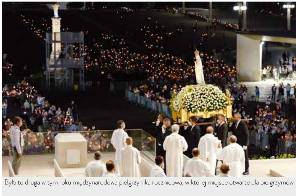
Była to druga w tym roku międzynarodowa pielgrzymka rocznicowa, w której miejsce otwarte dla pielgrzymów

Portugalski dostojnik, przewodniczący międzynarodowej pielgrzymce rocznicowej w lipcu, mówił triumfie dobra obiecany przez Maryję podczas objawień w 1917 r. / Carmo Rodeia