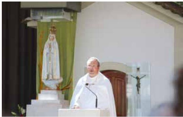
Em Fátima, a oração na Capelinha fez-se em união com o Papa

Santuários marianos de todo o mundo rezaram em conjunto com o Papa Francisco / Carmo Rodeia