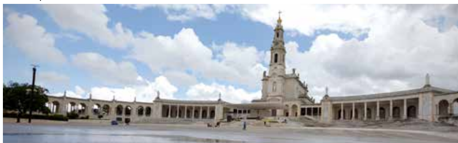
Dois meses e meio depois da última celebração com a presença de peregrinos, o Santuário reabriu as celebrações com uma missa às 7h30, na Basílica da Santíssima Trindade

Celebrações com fiéis recomeçaram a 30 de maio. Reitor saudou os primeiros peregrinos e afirma que só eles completam e dão sentido a Fátima / Carmo Rodeia