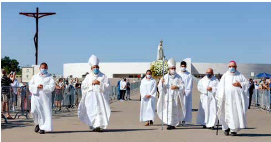
“Todos precisamos de Ti, Mãe, Senhora de Fátima, porque todos somos e queremos ser teus filhos, ouvindo os teus apelos e dando resposta aos teus convites”

O bispo auxiliar do Porto sublinhou, ainda, a promessa deixada em Fátima da vitória definitiva do “coração da Paz, do Bem, da Bondade”.