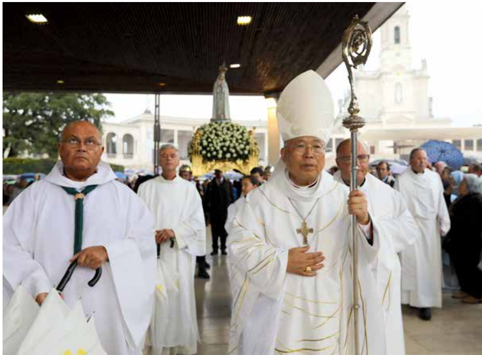
O cardeal Sul coreano presidiu à Peregrinação Internacional Aniversária de outubro, em 2019

Iniciativa do Cardeal Sul Coreano Andrew Yeom foi anunciada numa celebração no passado dia 25 de junho