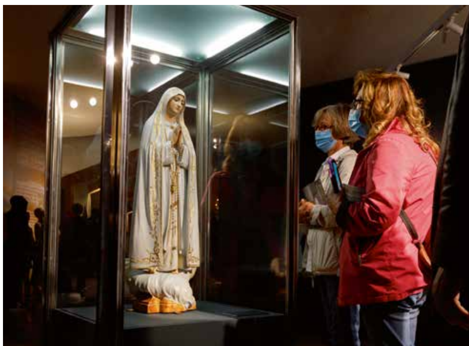
Durante seis horas a imagem esteve “mais perto” dos peregrinos