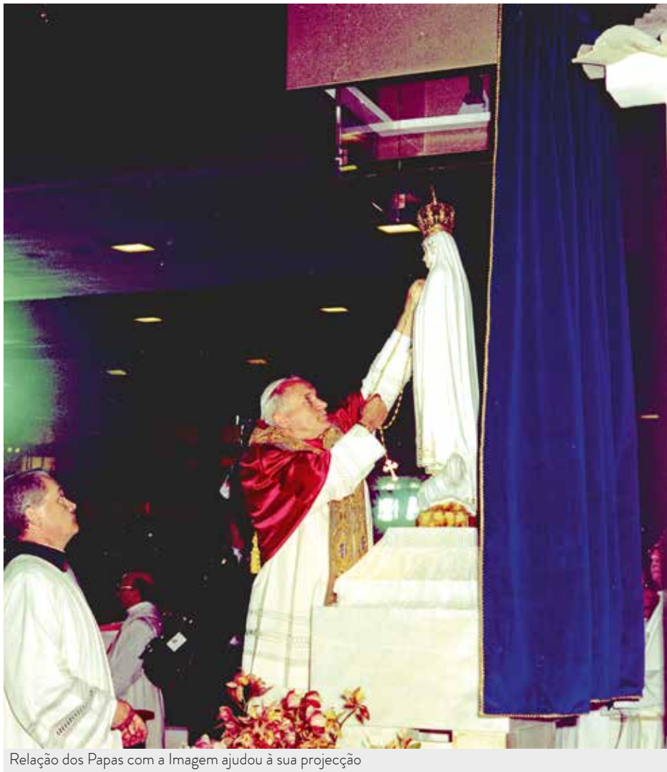
Relação dos Papas com a Imagem ajudou à sua projecção

“A ligação entre S. João Paulo II e a Virgem Maria foi certamente muito intensa e tem como nota caracterizadora o sentido materno-filial” / *Piero Marini