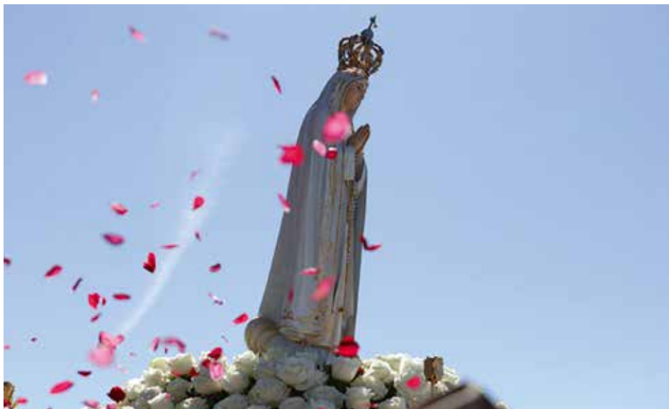
Imagem que se venera na Capelinha esteve por três vezes no Vaticano

ceira Parte do Segredo de Fátima: «Segundo a interpretação dos “Pastorinhos”, interpretação confirmada também recentemente pela Irmã Lúcia, o “Bispo vestido de branco” que reza por todos os fiéis é o Papa. Também Ele caminhando fatigadamente para a cruz entre os cadáveres dos martirizados (bispos, sacerdotes, religiosos, religiosas e numerosos leigos, cai por terra como morto, debaixo dos golpes da arma de fogo)».