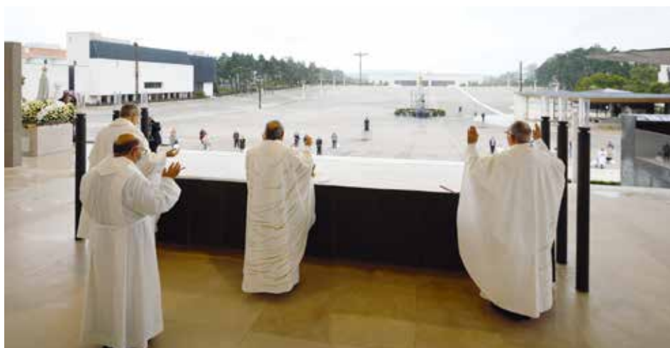
Pela primeira vez desde 1917, os peregrinos devotos estiveram ausentes do Santuário

“Uma vida melhor na nossa casa comum, em paz com as criaturas, com os outros e com Deus, uma vida rica de sentido requer conversão! Perguntemo-nos, pois, se temos tempo para Deus, se lhe damos o lugar que