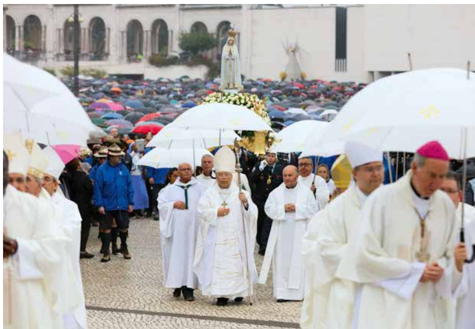
A Coreia do Sul é um dos países do continente asiático que mais grupos traz a Fátima

O Santuário da Paz de Fátima, localizado perto da fronteira entre a Coreia do Norte e a Coreia do Sul, acolheu, de 22 a 30 de agosto de 2017, uma novena pela paz na Península. Após este período, a Virgem Peregrina passou por mais 13 dioceses. Estima-se que, nestes 50 dias em que a imagem da Senhora de Fátima esteve no país, cerca de 55.500 peregrinos a tenham acompanhado. A imagem da Virgem Peregrina já tinha estado na Coreia do Sul em 1978, aquando da peregrinação à volta do mundo.