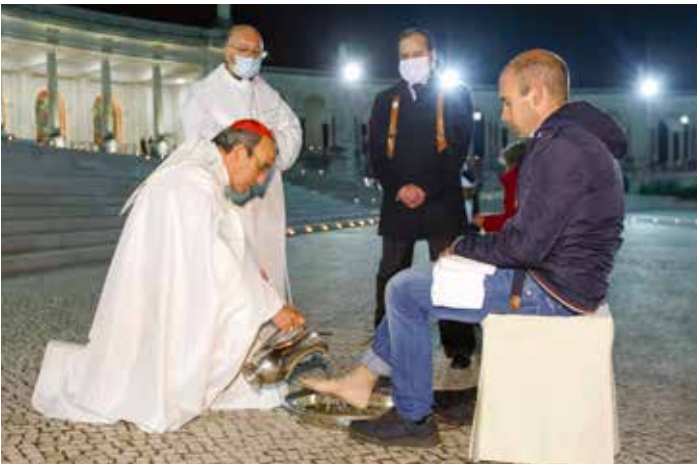
Cardeal repete gesto do Lava-pés, como na Quinta-feira Santa