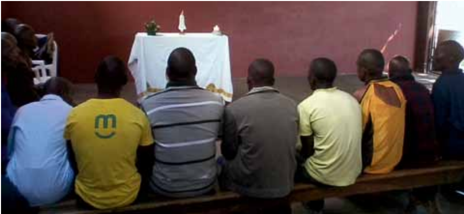
Gefangen, doch mit der Freiheit, Himmel und Erde zu vereinen, für Maria

Vor einigen Wochen fragte mich ein Häftling der Zentralen Haftanstalt von Maputo, ob wir damit anfangen könnten, den Rosenkranz in der Haftanstalt zu beten. Mit Freude nahm ich diesen Vorschlag an und forderte ihn auf, die Gebetsrunde zu organisieren, indem er die anderen Mithäftlinge fragen sollte, ob diese Interesse an der Initiative hätten.