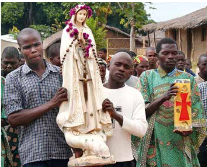
Katedra w Nampuli w Mozambiku została konsekrowana w 1956 r.

12 października 2008 r., w miejscowości Bacchus Marsh w archidiecezji Melbourne, poświęcono zbudowaną przez emigrantów portugalskich kaplicę, dedykowaną Matce Boskiej Fatimskiej. W kaplicy, otwartej we wszystkie niedziele, odprawiana jest Msza św. po portugalsku.