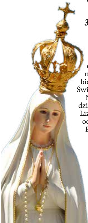
Zaplanowano 32 podróże figury pielgrzymującej

32 podróże fatimskiego wizerunku Maryi w roku jubileuszu stulecia objawień