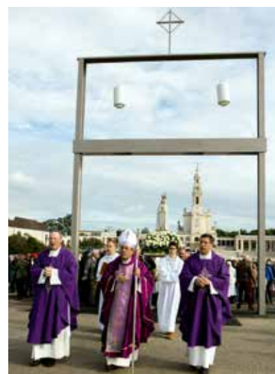
Portyk jubileuszowy upamiętnia 100-lecie objawień

Pośród uświetniających stulecie objawień wydarzeń o charakterze naukowym wymienić warto panel dyskusyjny „Fatima – historia i pamięć”, organizowany przez Sanktuarium we współpracy z Portugalską Akademią Historyczną. Odbędzie się on w dniach 26 i 27 maja br. Z kolei od 21 do 24 czerwca w Sali Dobrego Pasterza w Centrum Pastoralnym Pawła VI zaplanowany jest międzynarodowy kongres stulecia objawień „Przemysleć Fatimę – interdyscyplinarne odczytanie orędzia”. Wciąż trwają za-