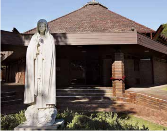
W Sydney znajduje się sanktuarium Matki Boskiej Fatimskiej

W archiwach Sanktuarium Fatimskiego przechowywane są informacje o parafii pw. Matki Boskiej Fatimskiej koło Pekinu. Figura Matki Boskiej Fatimskiej znalazła się na szczycie Mount Everestu. Sanktuarium Matki Boskiej Fa-