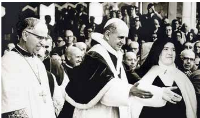
Paweł VI był pierwszym papieżem, który odwiedził Fatimę

„Tak wielkie jest nasze pragnienie uczczenia Przenajświętszej Dziewicy Maryi, Matki Chrystusa, a przez to Matki Boga i naszej Matki, tak wielka jest nasza ufność w Jej życzliwość wobec Kościoła świętego i naszej apostołskiej misji, tak wielka jest potrzeba, aby wstawiła się za nami u Chrystusa, swego Boskiego Syna, że jako pielgrzym pokorny i ufny przybyliśmy do tego błogosławionego sanktuarium, w którym świętujemy dzisiaj pięćdziesięciolecie objawień fatimskich i upamiętniamy dwudziestą piątą rocznicę poświęcenia świata Niepokalanemu Sercu Maryi”.