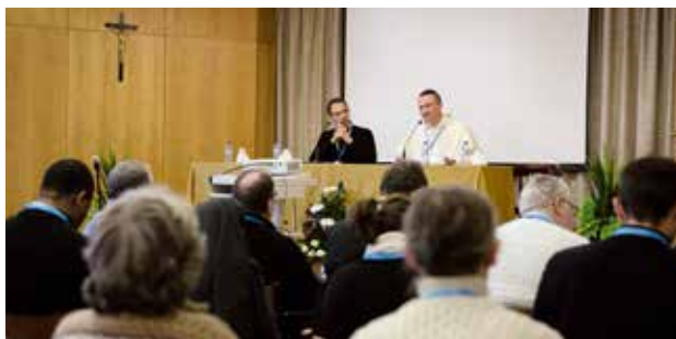
Trzydniowe spotkanie odbyło się w Fatimie

Stowarzyszenie Rektorów Sanktuariów ( franc. Association des Recteurs de Sanctuaries – ARS ) zrzesza wszystkie katolickie sanktuaria we Francji oraz kilka sanktuariów z Belgii, Szwajcarii, Portugalii i Libanu. Na kongresie, w którym uczestniczyło około 150 osób, obecni byli również przedstawiciele Stowarzyszenia Dzieł Maryjnych – założonej we Francji w 1961 r. międzynarodowej instytucji, skupiającej sanktuaria i ruchy maryjne, zgromadzenia i instytuty religijne oraz świeckie poświęcone Matce Boskiej.