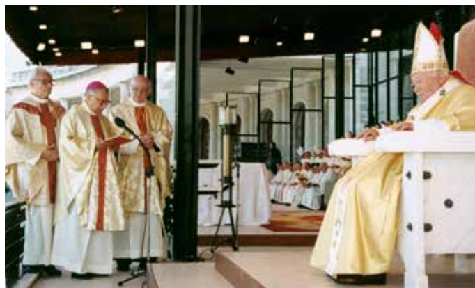
Jan Paweł II trzy razy pielgrzymował do Cova da Iria

13 maja 1991 – Jan Paweł II przewodniczy Eucharystii w Sanktuarium Fatimskim.