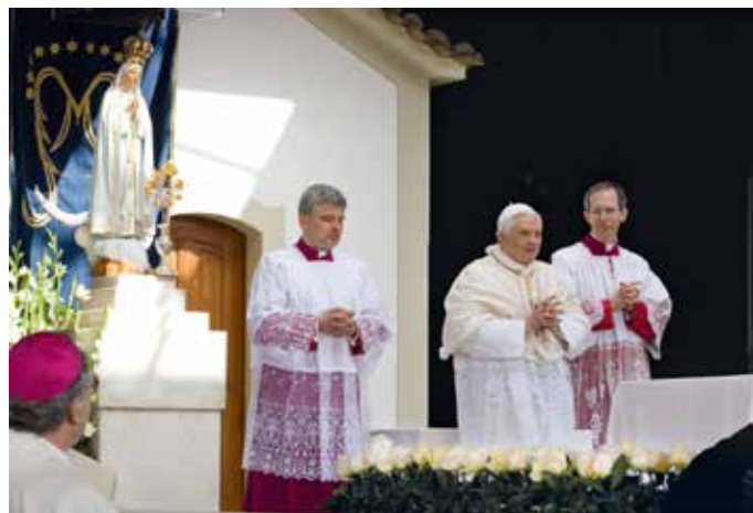
Benedykt XVI odwiedził Sanktuarium Fatimskie w maju 2010 r.