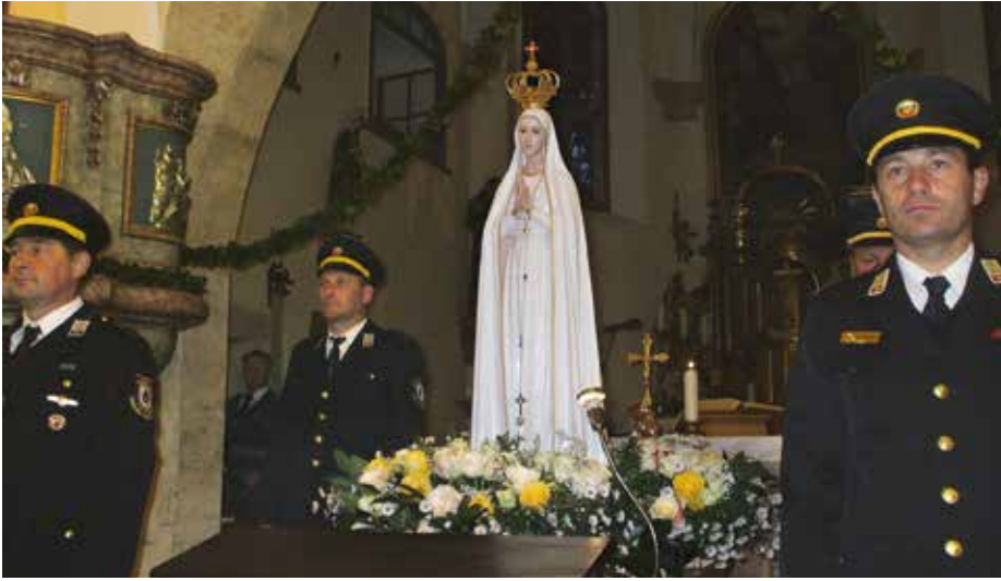
Peregrynacja figury pielgrzymującej do Słowenii rozpoczęła się w maju 2016 r.

Figura Matki Boskiej Fatimskiej w sanktuarium w Ptujskiej Gorze