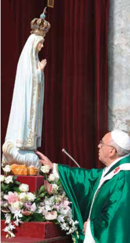
W Fatimie papież Franciszek pragnie być pielgrzymem

Watykan oficjalnie potwierdził, że 12 i 13 maja 2017 r. papież Franciszek przybędzie z pielgrzymką do Sanktuarium Matki Boskiej Różańcowej w Fatimie.