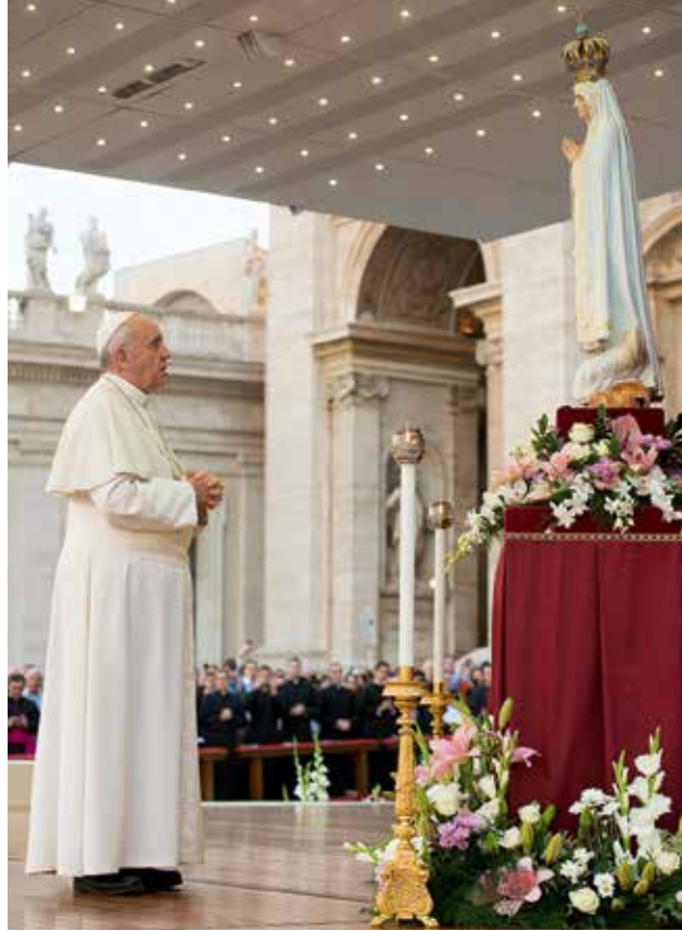
Franciszek jest pierwszym jezuitą wybranym na papieża

łał trzy konsystorze i mianował 57 nowych kardynałów, w tym nowego patriarchę Lizbony kardynała Manuela Clemente. Argentyński papież przeprowadził również synod poświęcony rodzinie (dwie sesje, między którymi odbyły się szerokie konsultacje we wspólnotach katolickich) oraz ogłosił nadzwyczajny Rok Święty Miłosierdzia, w 50. rocznicę zakończenia Soboru Watykańskiego II.