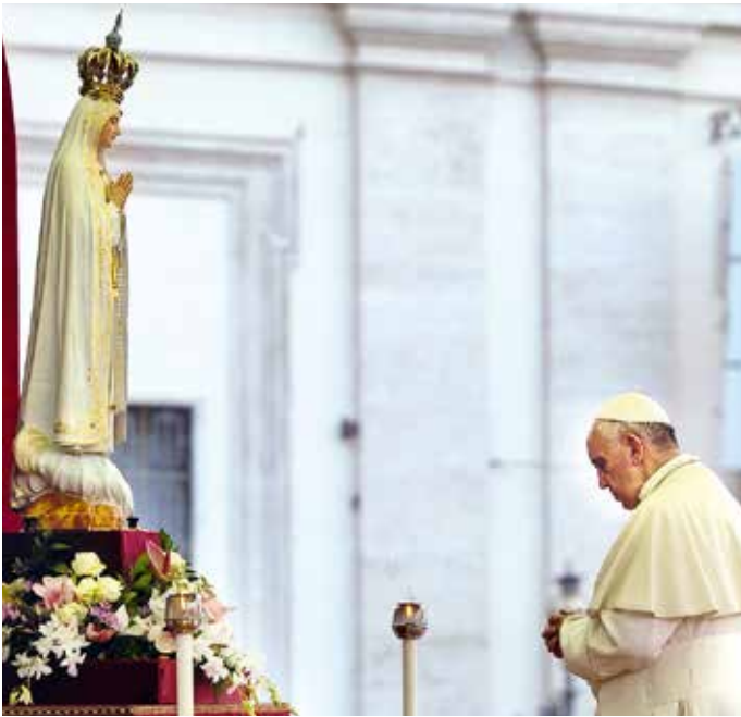
Franciszek poświęcił swój pontyfikat Matce Boskiej

13 marca 2013 r., w drugim dniu konklawe, argentyński kardynał Jorge Mario Bergoglio został wybrany papieżem i przybrał imię Franciszek.