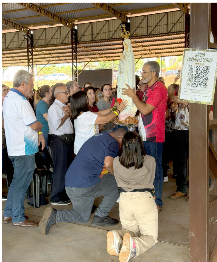
Procissão com a Imagem de Nossa Senhora de Fátima por entre os participantes do 1.º Congresso Mariológico de Campo Mourão.

“É um jovem equilibrado e reservado, com um sorriso fantástico. Está agora a estudar medicina, tal como a irmã. É interessante perce-