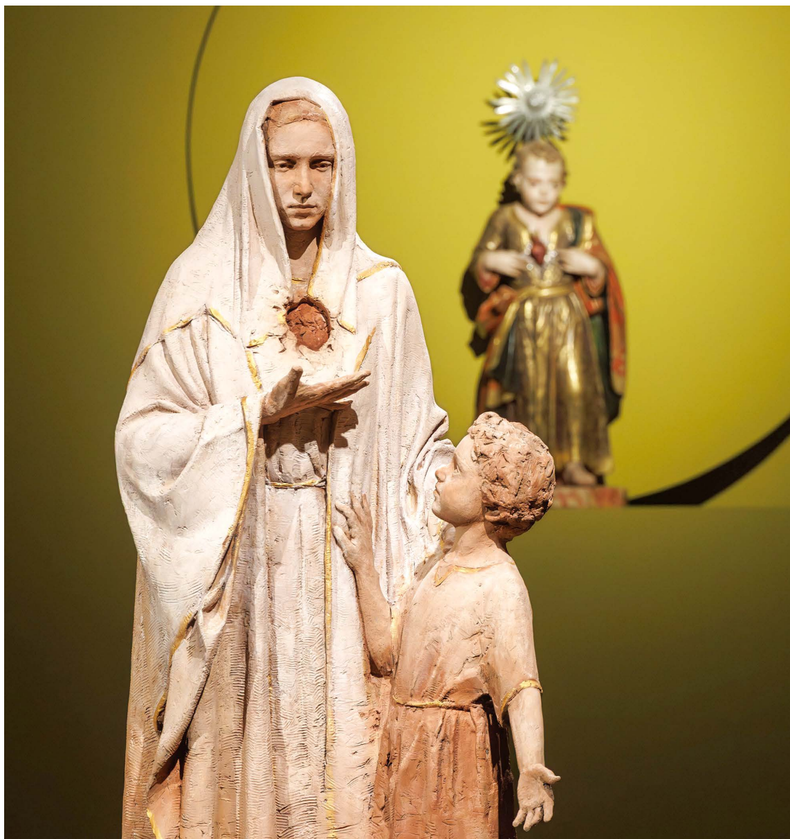
Escultura “Visão de Nossa Senhora e do Menino Jesus em Pontevedra”, de Matilde Olivera, com uma imagem do Menino Jesus, do século XVIII, no contexto da exposição temporária “Refúgio e Caminho”, que comemora o centenário das aparições de Fátima em Pontevedra.

Para a edição de 2026, estão já inscritos 112 participantes, sendo que o número está limitado à capacidade da sala.