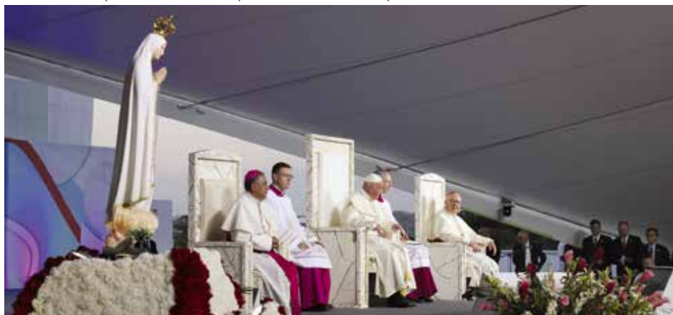
El Papa y la Imagen de la Virgen Peregrina fueron los dos primeros peregrinos inscritos en la JMJ

Nuestra Señora de Fátima se hizo peregrina en Panamá: estuvo en la JMJ 2019 con el Papa, en una prisión, en un hospital y en varias iglesias. En todos los lugares fue recibida y venerada por miles de personas / Carmo Rodeia