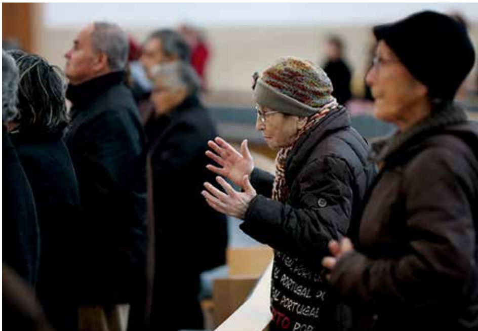
María es la “Madre siempre atenta a nuestras súplicas” dijo Rector

A lo largo de la historia de la Iglesia y de la humanidad, María tuvo siempre un lugar primordial, y por esa razón los cristianos recurren “confiados a su ayuda y protección, porque es Madre, está siempre atenta a nuestras súplicas y a ella recurrimos confiados en todas las dificultades”.