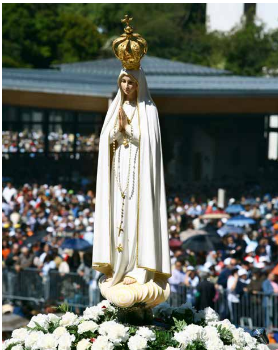
Entre 1947 y 2003 la imagen n.º 1 de la Virgen Peregrina recorrió 630 mil kilómetros, aproximadamente 15 vueltas al mundo

“Esta Imagen Peregrina es única, es la primera y la original, aquella que recorrió todos los continentes, la que dio varias veces la vuelta al mundo, pero desde el año 2000 ya no sale del Santuario. Esa imagen fue,