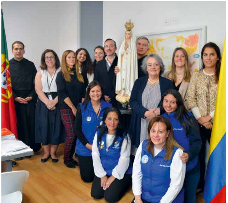
La Imagen Peregrina de Fátima regresa a Colombia este año