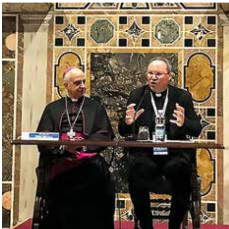
Santuario de miradas puestas en la pastoral juvenil

Esta atracción de los jóvenes, que buscan una “experiencia de un lugar diferente” de su comunidad, trae responsabilidades al Santuario de Fátima en la creación de “condiciones para una fuerte experiencia de fe y encuentro con Dios que pueda volver a unir a los jóvenes a sus comunidades de