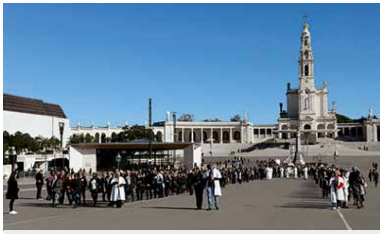
Procesión antecede la misa de la peregrinación, y conduce peregrinos desde Capelinha hasta la Basílica de la Santísima Trinidad

La Iglesia de la Santísima Trinidad fue dedicada el 12 de octubre de 2007 por el Cardenal Tarcisio Bertone, entonces Secretario de Estado del Vaticano y legado de Benedicto XVI para la clausura del 90º aniversario de las apariciones de Nuestra Señora a los tres pequeños pastores videntes.