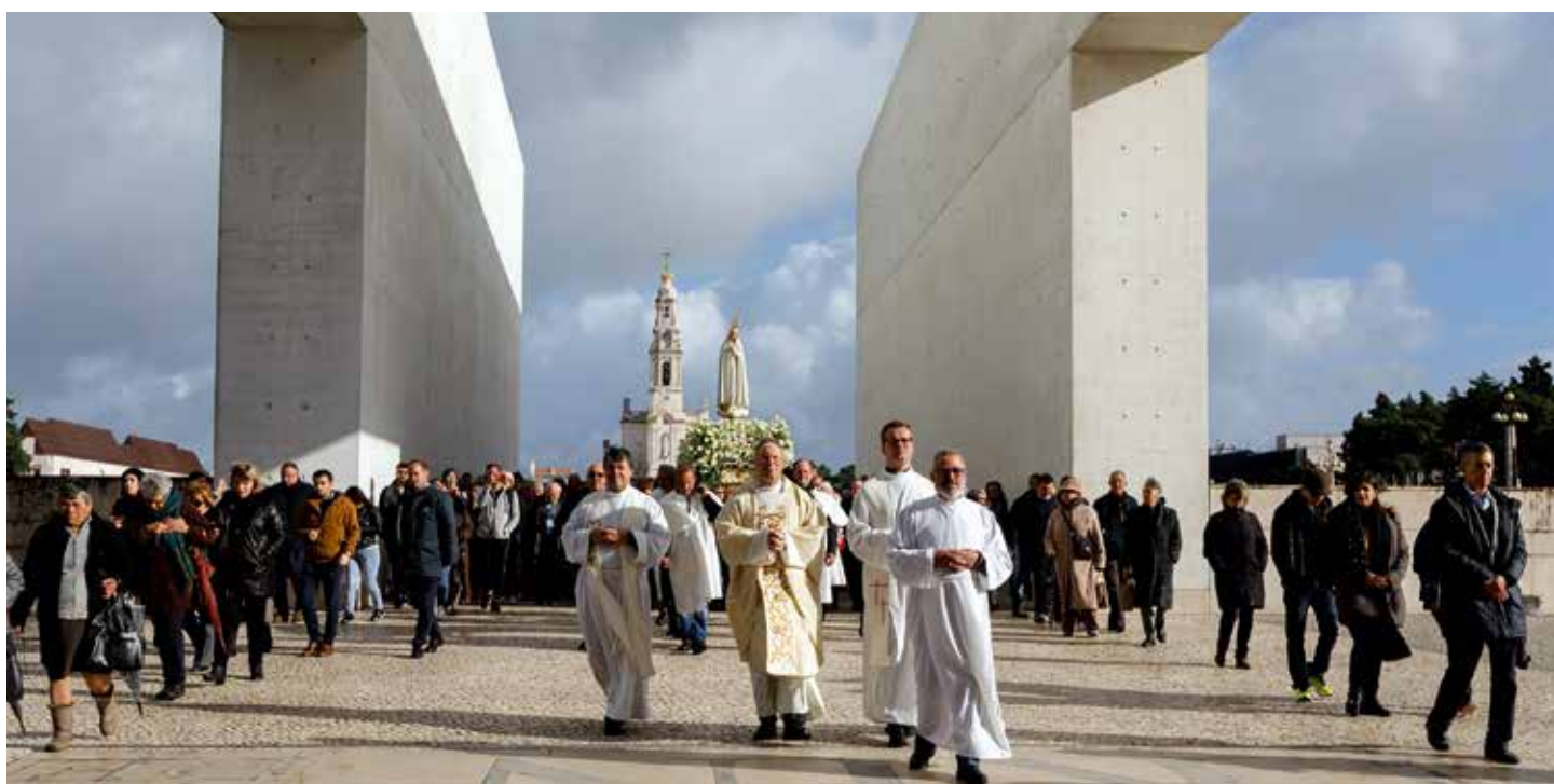
Esta fue la última peregrinación mensual del año de 2018

Esta fue la primera peregrinación mensual de este nuevo Año Pastoral, que tuvo inicio el 2 de diciembre, y tiene como tema “Dar gracias por peregrinar en Iglesia”.