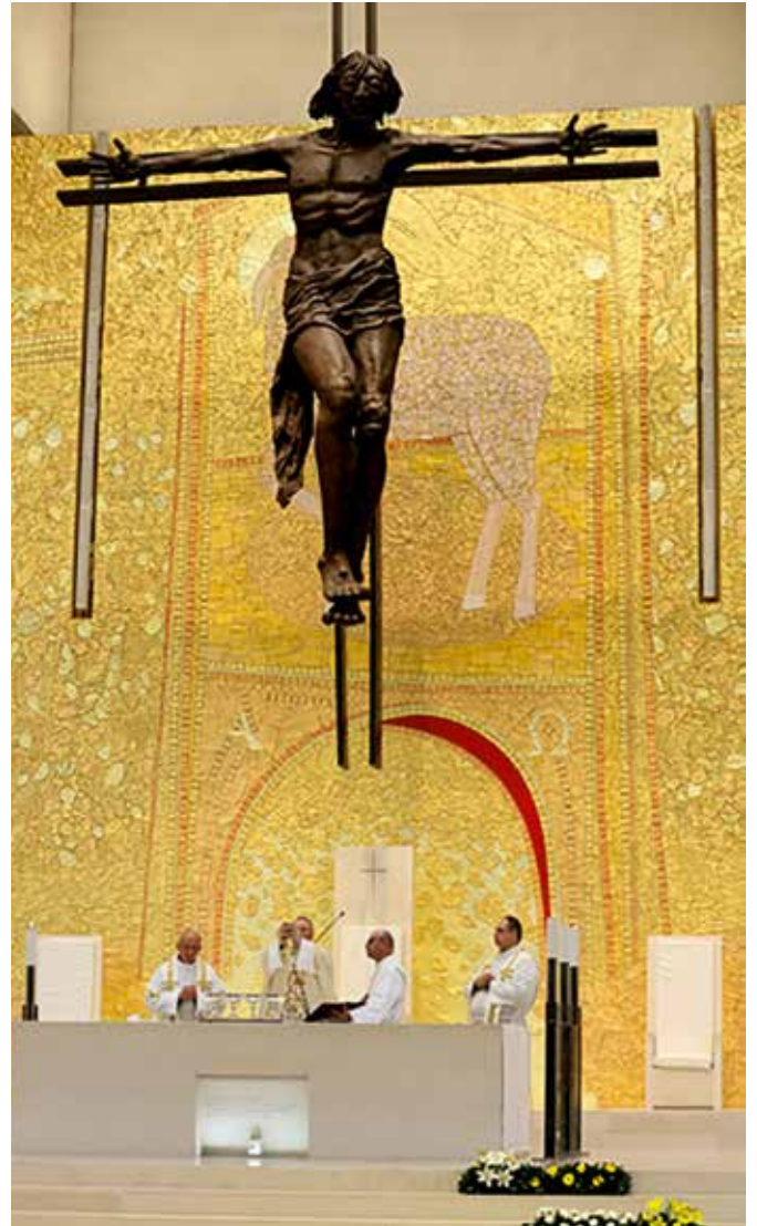
La Iglesia de la Santísima Trinidad fue dedicada el 12 de octubre de 2007

Las noticias de este boletín pueden ser publicadas libremente. Deben ser identificados la fuente y, si fuera el caso, el autor.