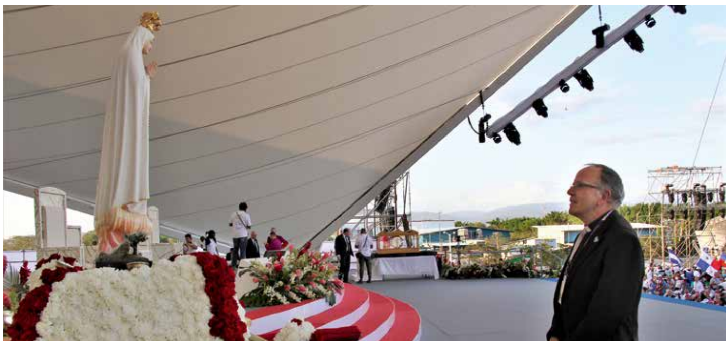
Cardenal Patriarca subraya papel “muy fuerte” que la Virgen Peregrina de Fátima tendrá en la JMJ de Lisboa

El Presidente de la República, Marcelo Rebelo de Sousa, destaca, por su parte, la importancia de esta elección para la afirmación de los países de habla portuguesa, con el Jefe de Estado realizando “el peso de Portugal, el peso de Fátima, el peso del pueblo católico portugués”, para justificar la elección del Vaticano.