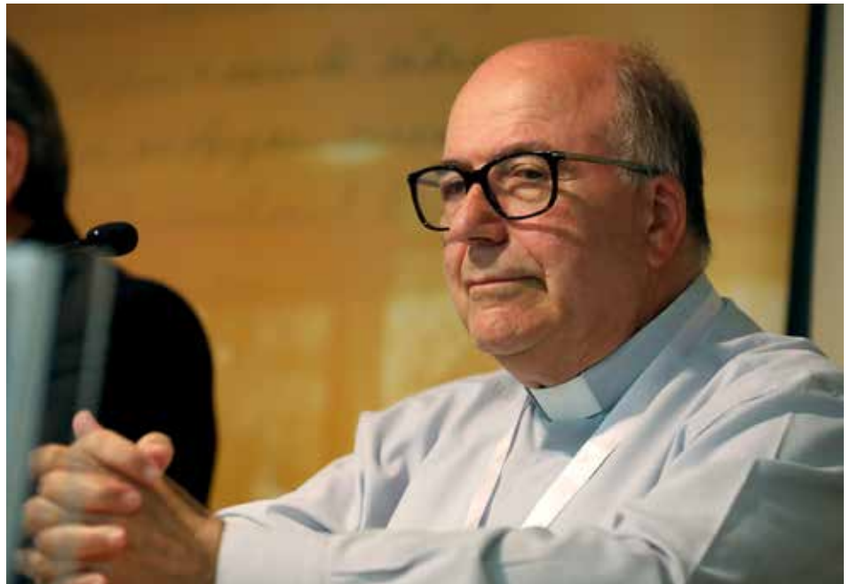
Antiguo director del Departamento de Estudios fue homenajeado en 2017

El 15 de agosto de 1962, fue ordenado presbítero y, en ese mismo año, ingresó en la Pontificia Universidad Gregoriana, en Roma. Durante los cinco años que estuvo en la ciudad eterna, se licenció en Teología Dogmática, en Historia Eclesiástica, y también pudo seguir de cerca la inauguración del Concilio Vaticano II y la elección de aquel que sería el primer Papa