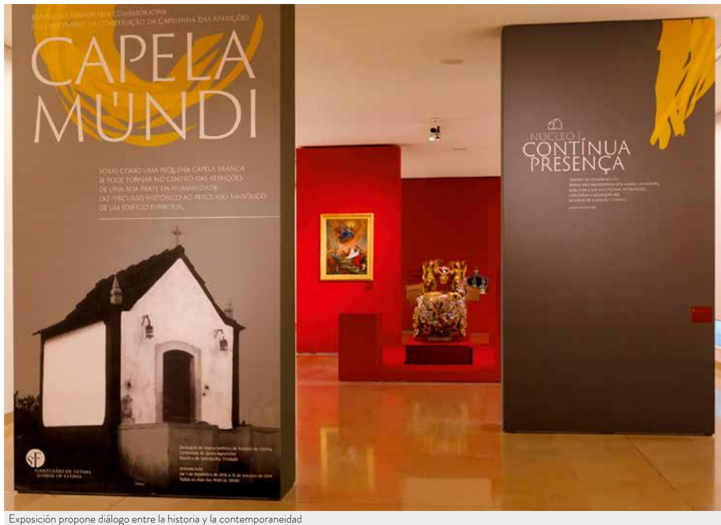
Exposición propone diálogo entre la historia y la contemporaneidad

Exposición busca leer la Capilla de las Apariciones como el corazón del Santuário / Diogo Carvalho Alves