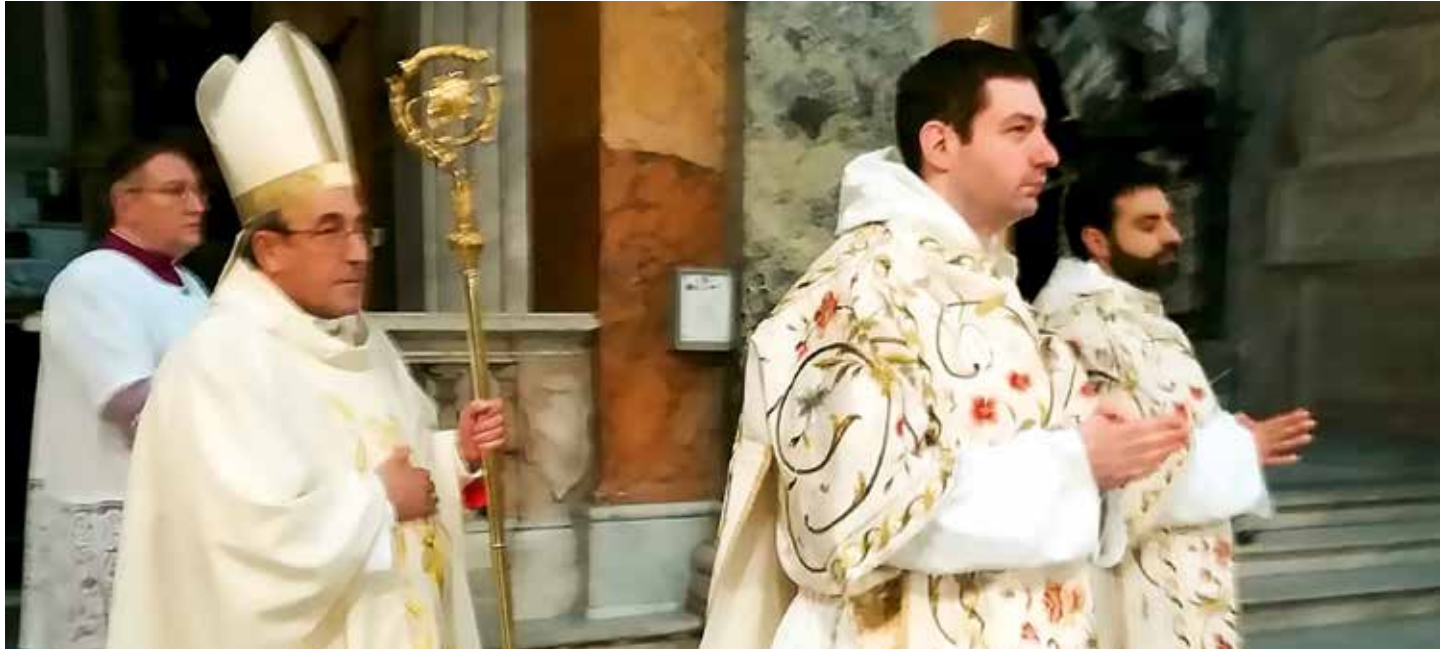
En Santa María sopra Minerva se reza el rosario todos los días, conforme la petición de Nuestra Señora a los Pastorcitos

Obispo de Leiría-Fátima tomó posesión de la Basílica que le fue atribuida por el Papa Francisco en su nombramiento cardenalicio / Carmo Rodeia