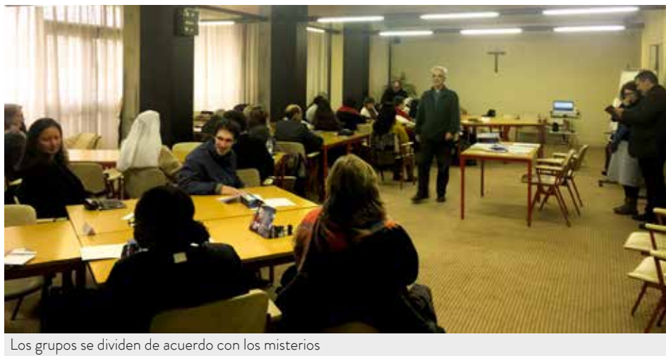
Los grupos se dividen de acuerdo con los misterios

Para el año pastoral 2018-2019, la Escuela dispone de tres propuestas formativas, con modelos y formatos diferentes: los Itinerarios de Espiritualidad, un Curso sobre el Mensaje de Fátima y las Oficinas Pastorales.