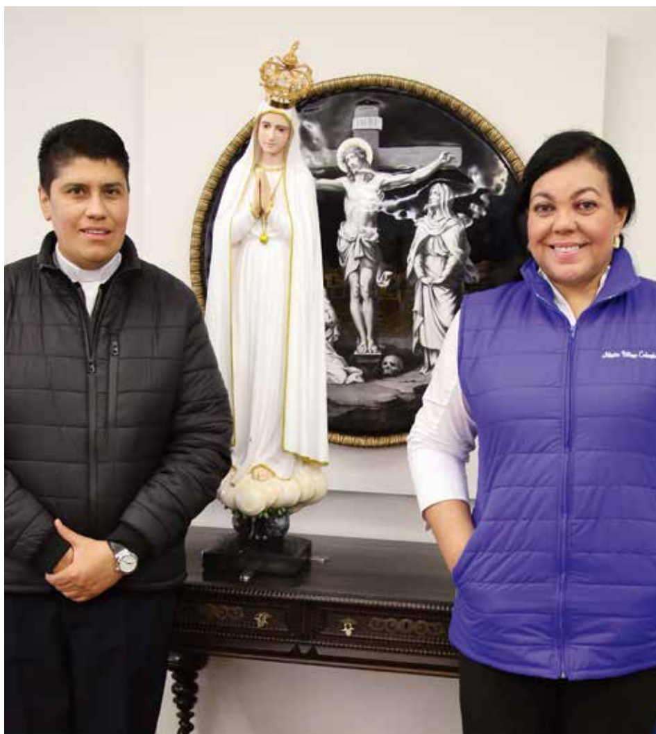
Pomysłodawcy pielgrzymki przywieźli „Matkę” do swego domu.