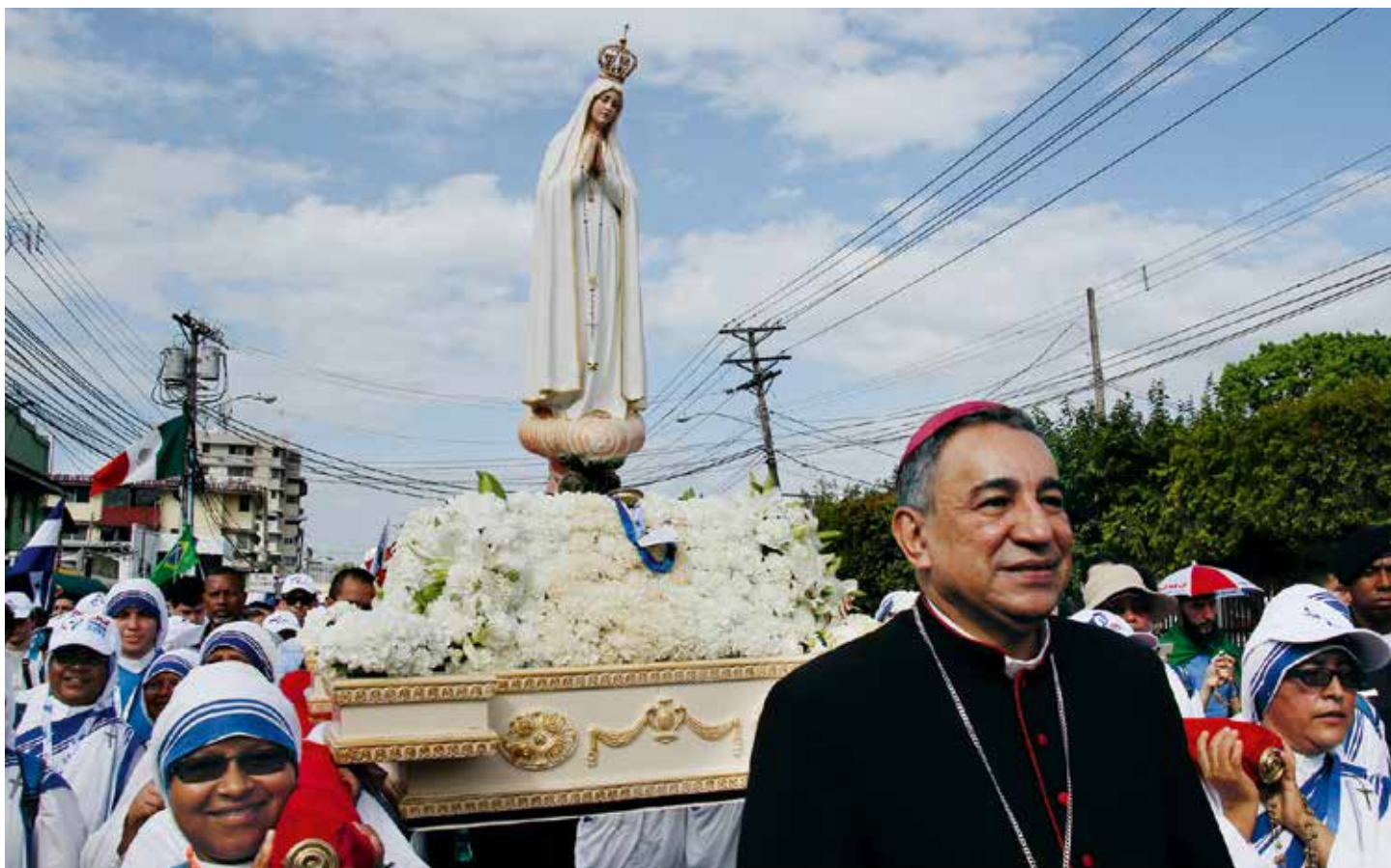
Obecność Pani Pielgrzymującej z Fatimy na ŚDM w Panamie to dzieło Boga.