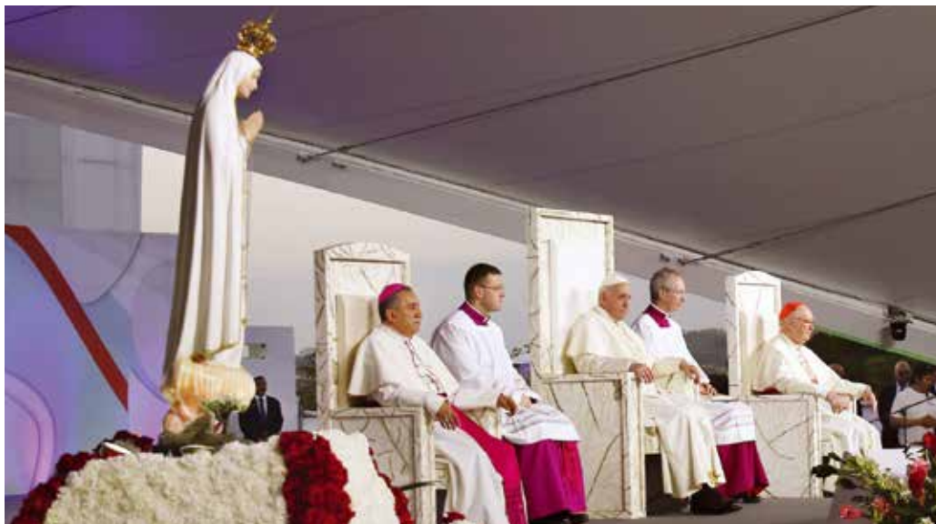
Papież modlił się przed Pielgrzymującą Panią z Fatimy.