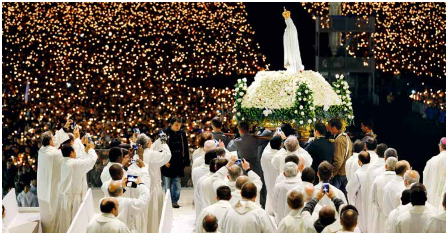
Procesja ze świecami to jeden z najbardziej emocjonujących momentów programu fatimskich celebracji.

Niezwykle liczny napływ pielgrzymów potwierdza, że Fatima jest dla nich „ołtarzem świata”. Sanktuarium Fatimskie wciąż jest jednym z najbardziej uczęszczanych miejsc pielgrzymkowych. Przedstawiciele dziewięciu z dziesięciu krajów, które skupiają ponad 55 % katolików, co roku pielgrzymują do Cova da Iria.