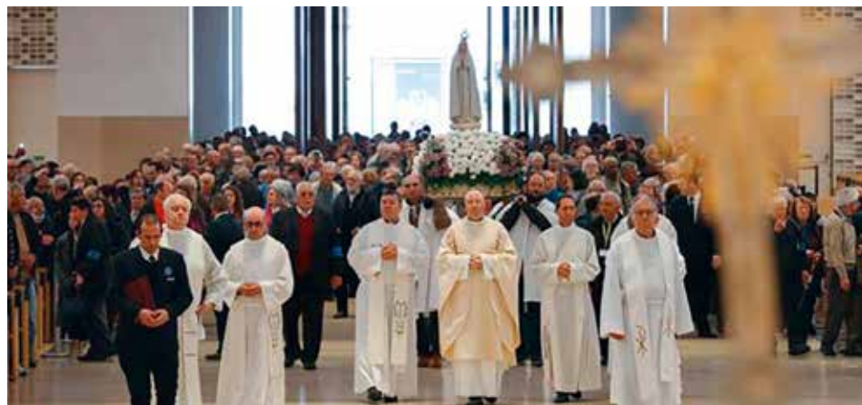
Centrum kwietniowej pielgrzymki w Sanktuarium było nawrócenie

W homilii Mszy św. comiesięcznej pielgrzymki, ks. Carlos Cabecinhas wezwał pielgrzymów do przyjęcia wezwania do nawrócenia, które Matka Boża przedstawiła w Cova da Iria / Diogo Carvalho Alves