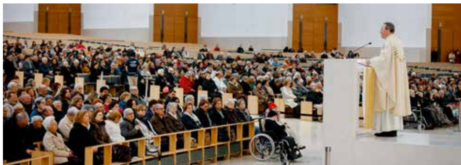
Chorzy w świąteczny sposób uczestniczyli w marcowej pielgrzymce.