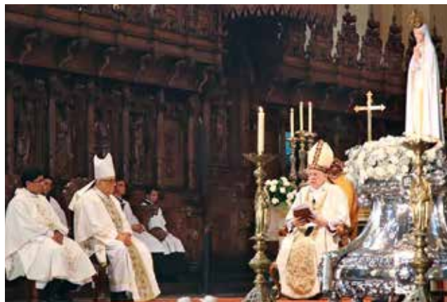
Biskupi Peru oddają się Matce Bożej.

W niedzielę 20 stycznia, w ostatnim dniu pobytu fatimskiego wizerunku Maryi w Peru, w katedrze w Limie odbyła się uroczystość, której przewodniczył kardynał Juan Luis Cipriani Thorne. Obecni