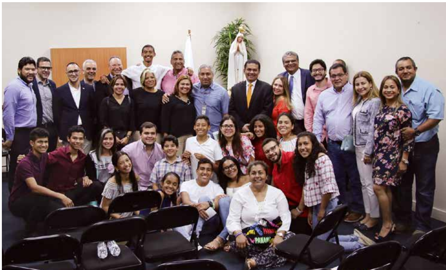
Animatorem wizyty figury Pani Pielgrzymującej z Fatimy był Światowy Apostolat Fatimy