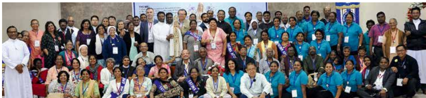
Światowy Apostolat Fatimy w kierunku Azji

Światowy Apostolat Fatimy istnieje w Indiach od kilku dziesięcioleci, a ten historyczny Kongres azjatycki pokazał żywotność tego ruchu w tym kraju oraz jak wiele dobra uczynił dla lokalnego Kościoła w całej Azji otwierając nowe horyzonty dla Orędzia Fatimskiego, jego teologii i duchowości.