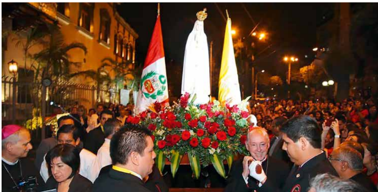
Brak nam słów, aby opowiedzieć doświadczenie miłości jakie przeżyaliśmy przed figurą Najświętszej Panny Maryi.

„Byłam pod wielkim wrażeniem, gdy czytałam o tych trojgu dzieciach. Po tym, co widzieli, co Panna Maryja im pokazała, co robili, aby zbawić dusze! Zadaję sobie pytanie: Jaka będzie nasza misja? Do czego Ona nas wzywa?” Stwierdza i przypomina, że wszystko to, co wydarzyło się w Kolumbii, stało się za pośrednictwem Matki Bożej”.