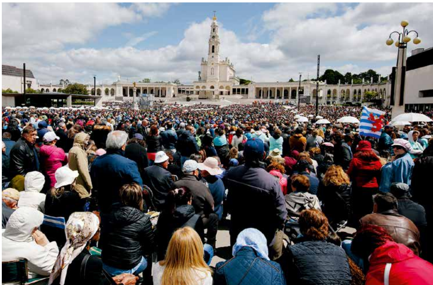
Rok po Stuleciu, Fatima utrzymuje pozycję "Ołtarza Świata"

Kardynał António Marto: Fatima należy nie tylko do Kościoła, nie tylko do Portugalii, lecz do całego świata