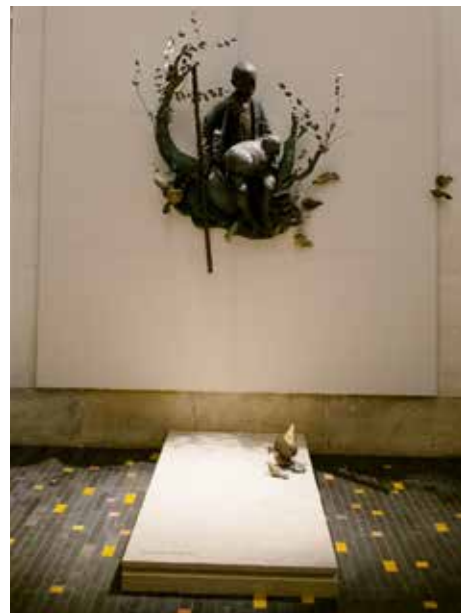
Nabożeństwo przy grobie było głównym momentem celebracji.

W tym roku w domu, w którym urodził się i