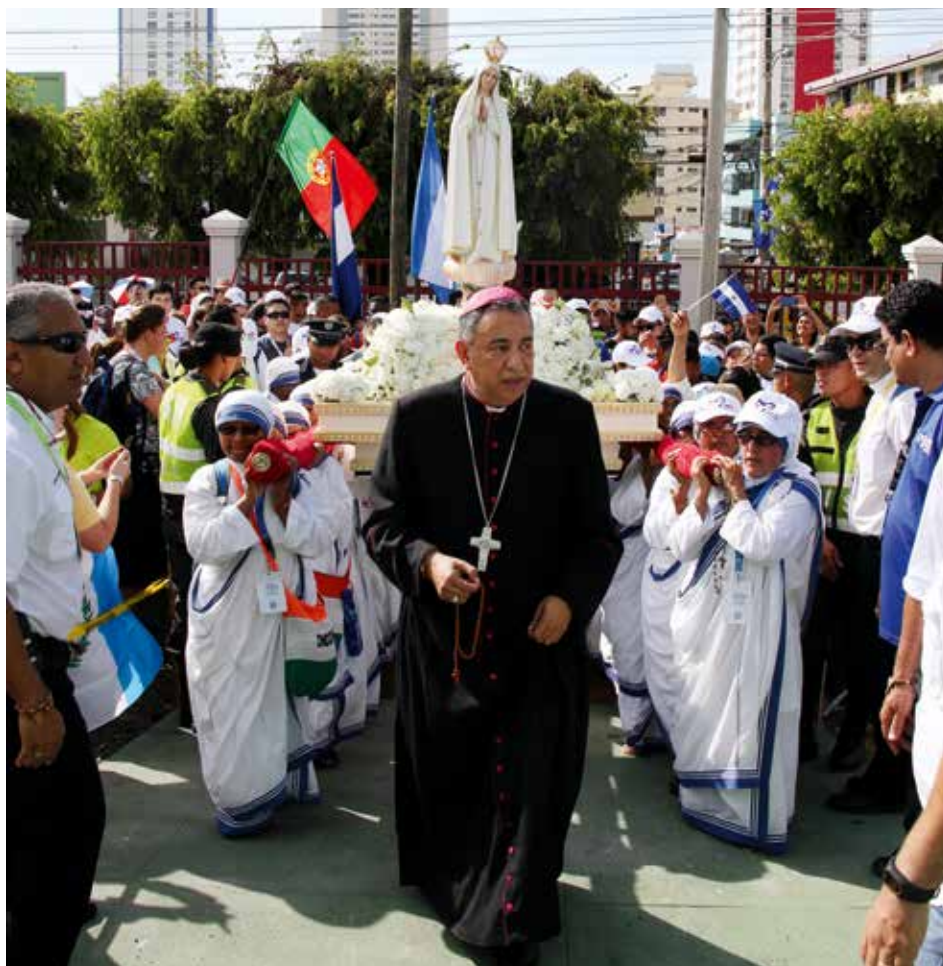
Pielgrzymująca Pani odwiedziła peryferie miasta Panamy.

Najlepszą strategią przy organizacji takiego wydarzenia jest: oddać je w ręce Boga i prosić Maryję o wstawiennictwo. Musimy dopilnować wszystkiego, co tylko możliwe, z ludzkiego punktu widzenia, lecz to Opatrzność nad nami