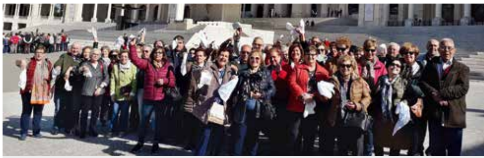
Pielgrzymi w Hiszpanii nie przestają być najliczniejsi w Cova da Iria

Składamy niekończące się podziękowania Matce Bożej za pozwolenie nam, że mogliśmy ponownie ją odwiedzić i okazać jej miłość wiernych dzieci.