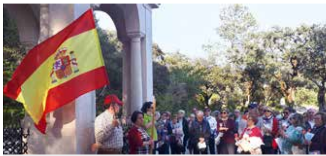
Hiszpanie odprawiają nabożeństwo w Valinhos

Podczas nabożeństwa różańcowego, w ponie-