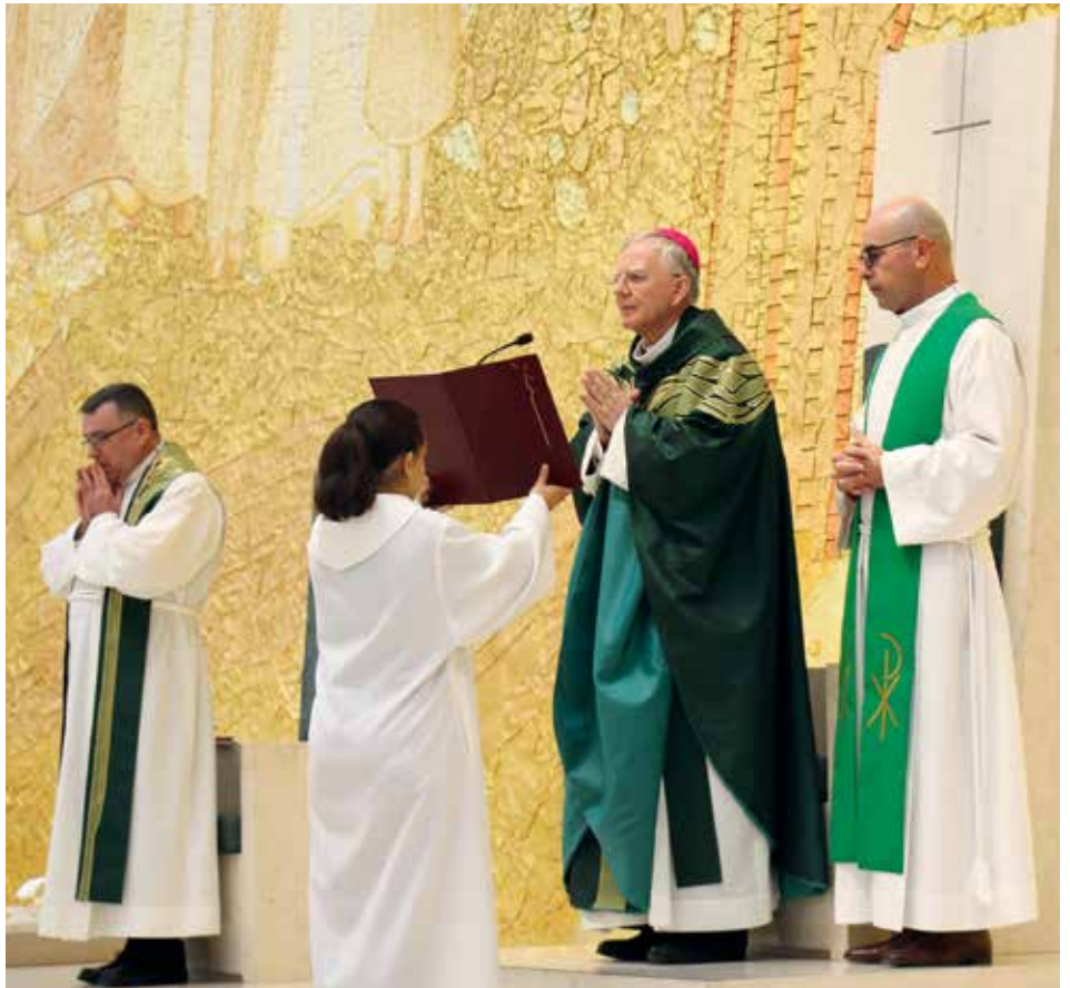
Polski dostojnik mówi o przykładzie Maryi dla dzisiejszych dni.

Kończąc homilię arcybiskup Krakowa powiedział: „Jej comiesięczne objawienia się trójgu fatimskim pastuszkom (...), Jej zapewnienia, że już niedługo Hiacynta i Franciszek zostaną przez Nią wzięci do nieba, a przede wszystkim Jej gorące prośby, a zarazem polecenia, aby ludzie modlili się na różańcu w intencji końca wojny i pokoju na świecie, a także o nawrócenie grzeszników, dobitnie wskazują na to, jak bardzo Matka Boska Różańcowa z ogromną, troskliwą miłością pochyliła się nad każdym człowiekiem, zabiegając o jego zbawienie”.