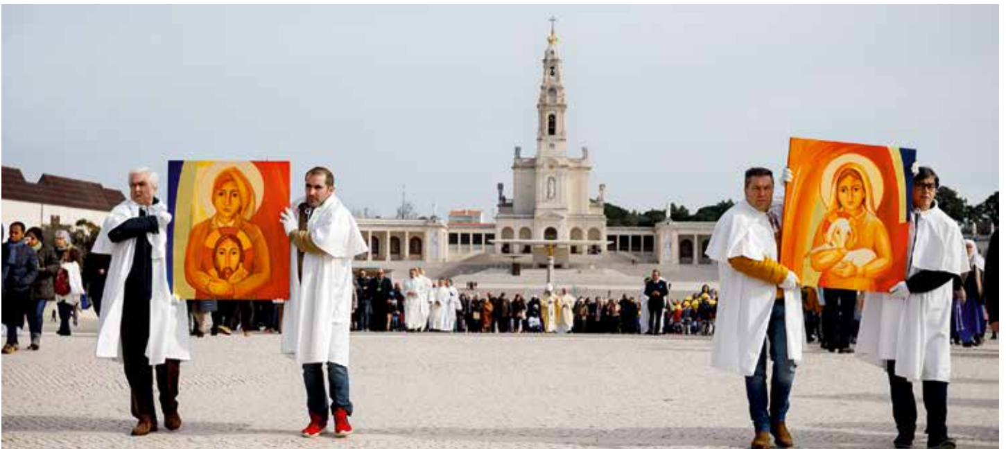
Fatima i Brazylija, w tym samym dniu obchodzą pamięć świętych Pastuszków.