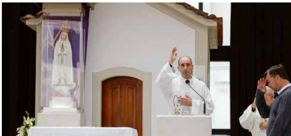
Pożegnanie Figury Pielgrzymującej z Fatimy naznaczone było modlitwą o pokój i za Ojca Świętego.

Program rocznej peregrynacji obejmuje nawiedzenie 26 diecezji