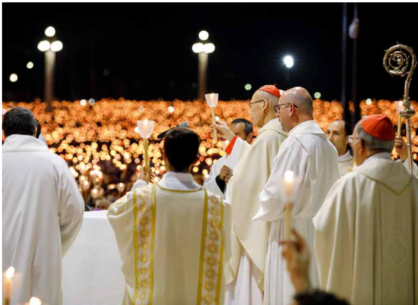
Sanktuarium fatimskie nie przestaje patrzeć w kierunku kontynentu azjatyckiego.

Wiadomo już, kto będzie przewodniczył najważniejszym pielgrzymkom w 2019 r. / Cátia Filipe