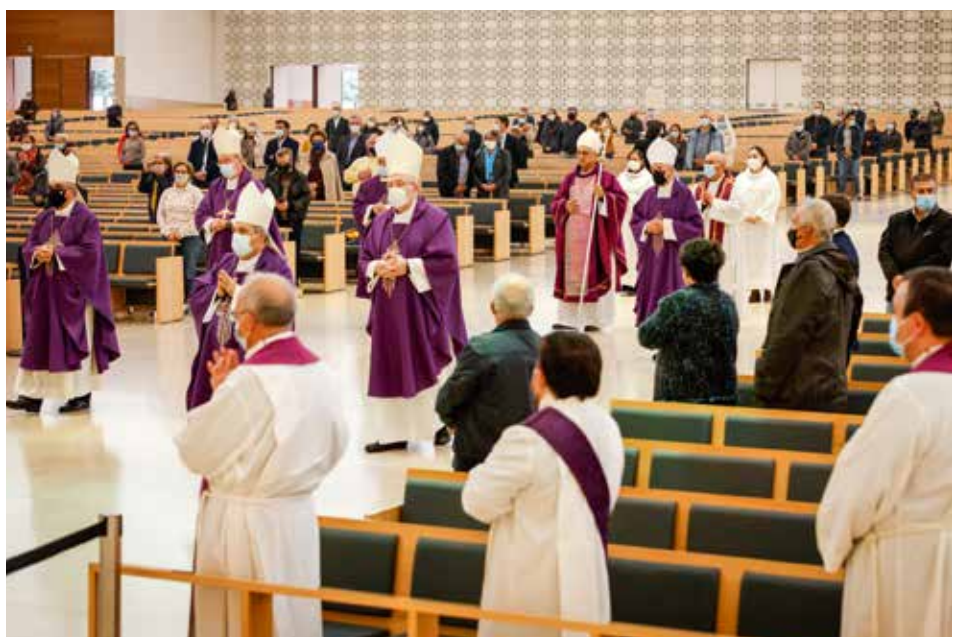
La celebración fue la culminación de la Asamblea Plenaria del CEP en Fátima

La celebración contó con la presencia de 21 obispos, entre ellos el nuncio apostólico en Portugal, el rector del Santuario de Fátima, el presidente de la República, Marcelo Rebelo de Sousa, el primer ministro, António Costa, y varias entidades públicas que quisieron asociar este homenaje de oración por las víctimas, directas o indirectas, de la pandemia.