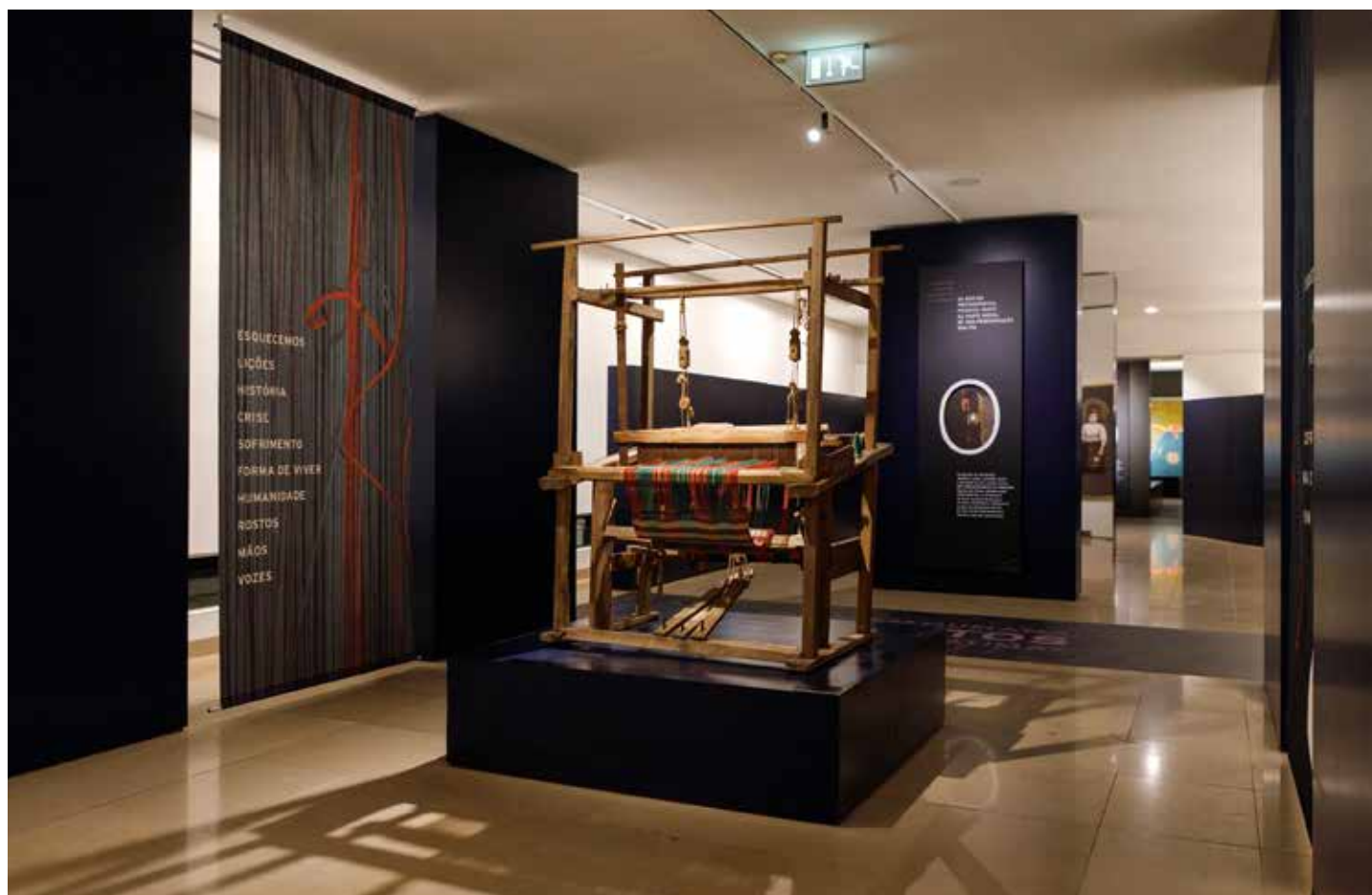
La exposición teje una relación entre Fátima y los grandes temas de la Humanidad