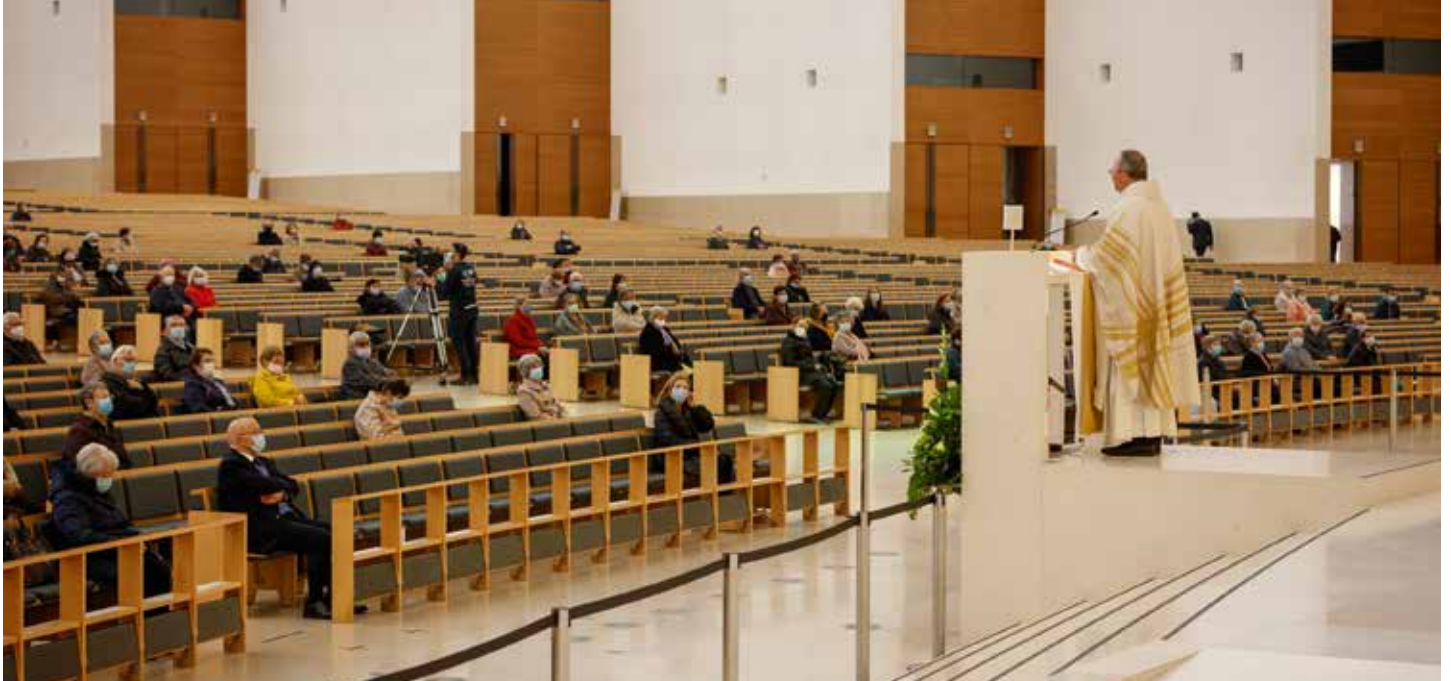
La pandemia reduce la participación de peregrinos en las celebraciones de Fátima

En la peregrinación mensual de noviembre, que también celebró la Solemnidad de la Dedicación de la Basílica de la Santísima Trinidad, el sacerdote Carlos Cabecinha reflexionó sobre el “misterio de la Iglesia de las piedras vivas” y exhortó a la cercanía al Santo Padre, a través de la oración. / Diogo Carvalho Alves