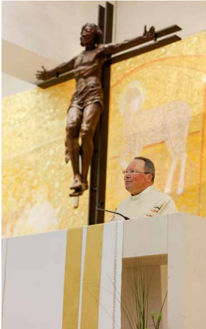
La primera peregrinación mensual de 2021 subrayó la importancia de Nuestra Señora

Misa de la Peregrinación Mensual de Enero en la Basílica de la Santísima Trinidad, presidida por el P. Carlos Cabecinhas