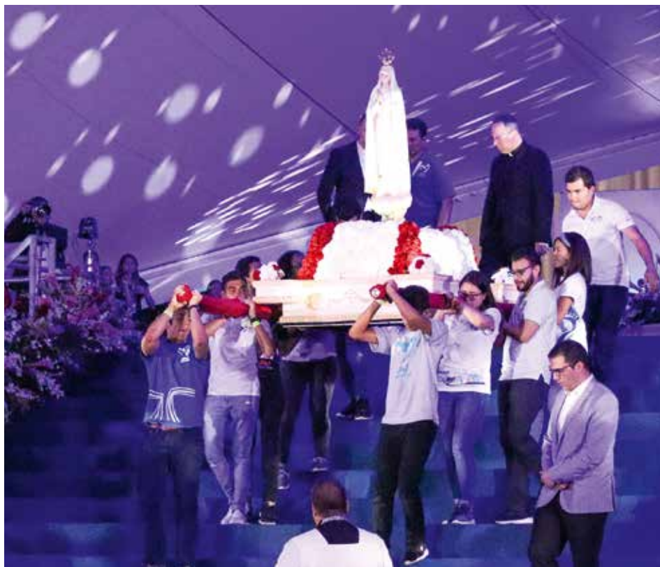
Imagen de la Virgen Peregrina de Fátima portada por los jóvenes de AMF Panamá, en la Vigilia de la Jornada Mundial de la Juventud en 2019

La Imagen de la Virgen Peregrina Nº 3, estará en la Parroquia de Nuestra Señora del Rosario de Fátima, Sumaré, en São Paulo, Brasil, del 1 de mayo al 13 de octubre. Entre los meses de abril y agosto, la Imagen de la Virgen Peregrina Nº 4, estará en varias diócesis de Italia, en un periplo promovido por el Movimiento Mariano Messaggio di Fátima en Italia.