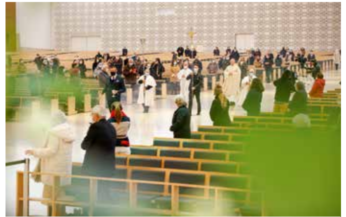
La celebración tuvo lugar en pleno confinamiento debido a la pandemia

El mensaje de Fátima, “es una fuerte invitación a la confianza porque Dios conoce nuestra fragilidad y es consciente de nuestro sufrimiento y eso es lo que Nuestra Señora vino a asegurar aquí”. “En un mundo sumido en la oscuridad, en uno de los momentos más dramáticos de la historia, en 1917, Nuestra Señora vino a traer un mensaje de esperanza y una fuerte llamada a la confianza, que no solo fueron válidos para ese año, si no que siguen siendo plenamente válidos, 100 años después”, recordó el rector, en un momento en el que “hoy también vivimos tiempos difíciles”.