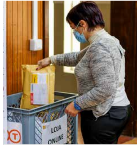
La tienda On-line vende todos los artículos oficiales de Santuario

La tienda online del Santuario de Fátima abrió a finales de 2010, con la selección y descripción de los artículos que se venderían en internet, pero es en 2020 cuando registra el gran salto cualitativo, con el aumento de la oferta, un equipo específico para atender a los clientes y nuevos productos en exposición.