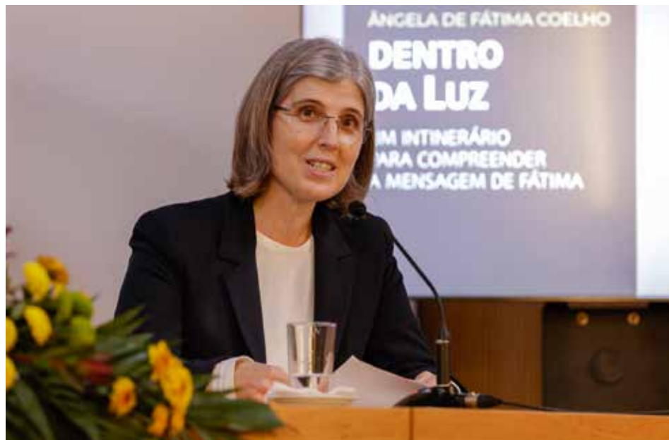
Religiosa de la Alianza de Santa María sistematiza el curso del mensaje de Fátima

Dentro da Luz. Um itinerário para compreender o mensaje de Fátima es el título del libro de la autora de la H a Angela Coelho / Cátia Filipe