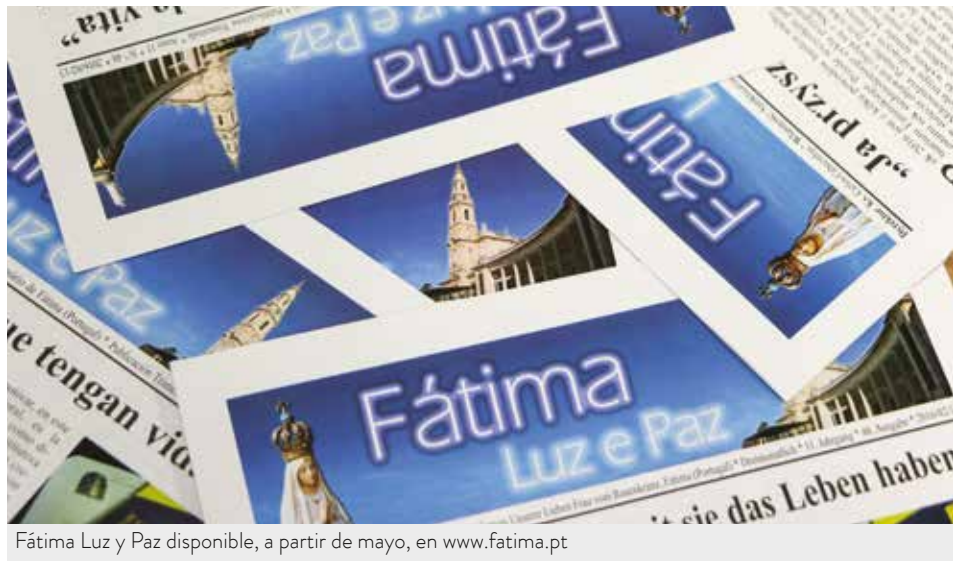
Fátima Luz y Paz disponible, a partir de mayo, en www.fatima.pt

La suspensión de la edición en papel plantea nuevos desafíos al boletín internacional del Santuario de Fátima / Carmo Rodeia