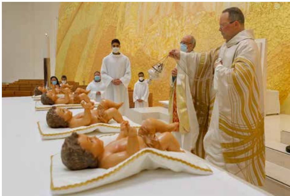
Celebraciones de Navidad marcadas por la veneración del Niño Jesús

El Santuario de Fátima garantizó las celebraciones de Navidad y Año Nuevo, respetando las normas de seguridad previstas en el plan de contingencia