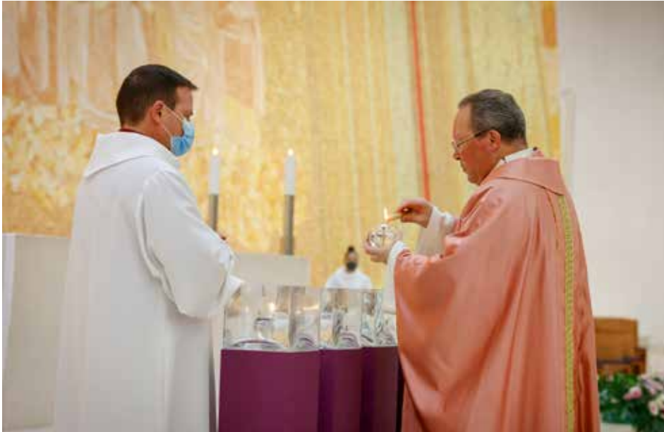
El tiempo de Adviento "está marcado por esta alegría de quienes saben que el Señor está cerca y que está presente"

El P. Carlos Cabecinhas presidió la peregrinación mensual de diciembre