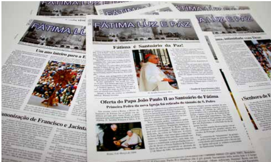
Boletín fue creado con el objetivo de reflejar el culto a Nuestra Señora de Fátima en el mundo

La publicación acompañó momentos históricos vividos en Fátima y en el mundo