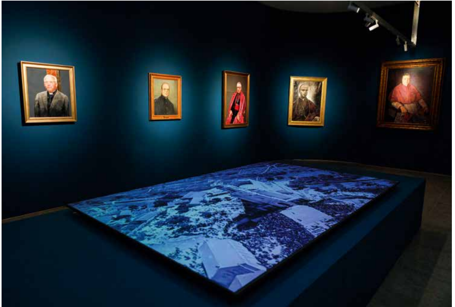
Historia del crecimiento del Santuario vinculado a la acción de obispos y rectores

Basado en el evento y el Mensaje que Nuestra Señora dejó en Cova da Iria, la exposición cuenta la historia de Fátima a través de varios rostros / Cátia Filipe