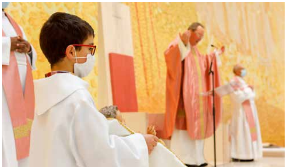
El domingo de la Alegría se procede a la Bendición de las imágenes del Niño Jesús

Esta celebración se retransmitió a través de los medios de comunicación digitales del Santuario de Fátima.