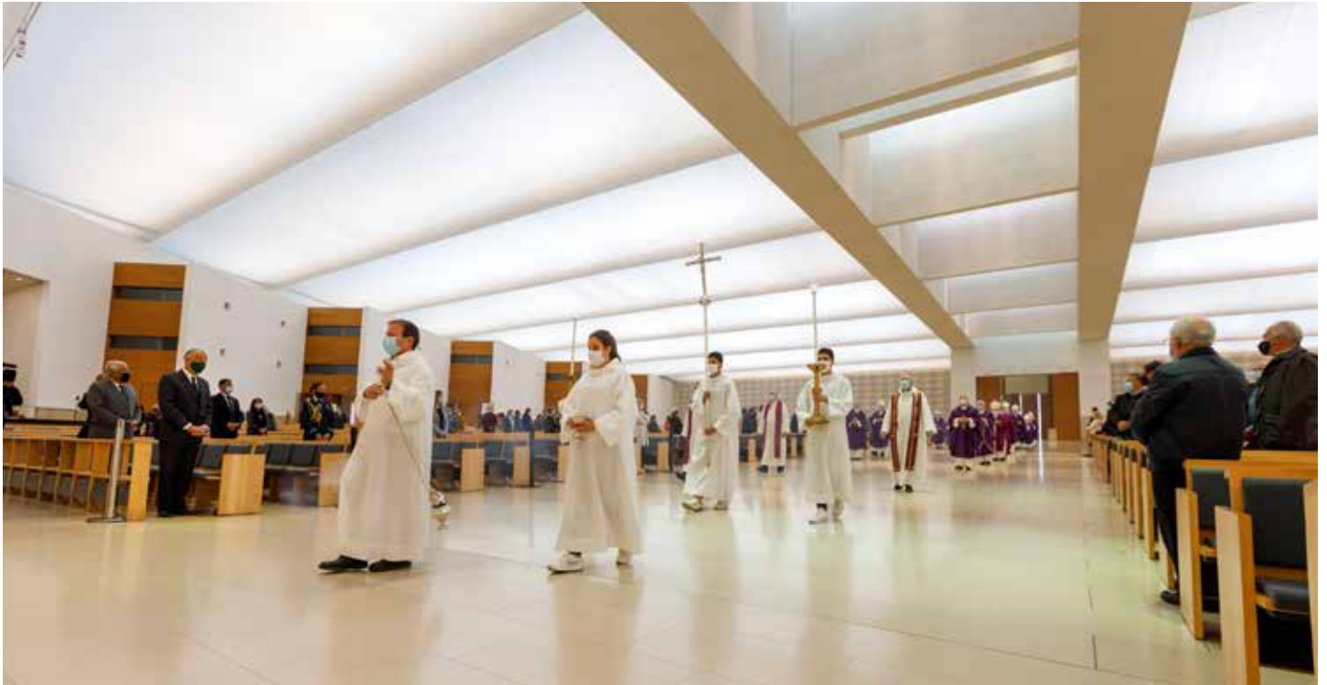
El presidente de la República elogió el comportamiento "ejemplar" de la Iglesia en la colaboración con las autoridades sanitarias

La Eucaristía por las víctimas de la pandemia reunió a 21 obispos y autoridades nacionales en Fátima, evocando a profesionales de la salud, investigadores y cuidadores