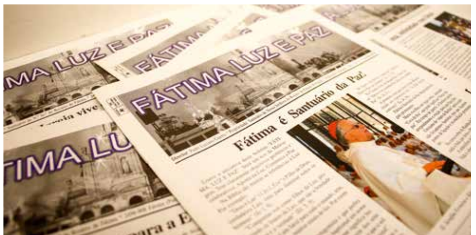
La cuestión de la Paz, siendo central en el mensaje de Fátima, siempre fue subrayada en el Boletín

Fátima, "santuario de la Santísima Trinidad", se pudo leer en la segunda página de la edición del 13 de noviembre de 2007, un mes después de la inauguración del espacio.