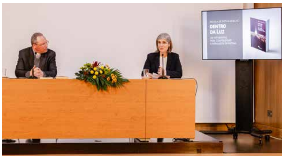
La presentación del trabajo se realizó a través de medios digitales del Santuario de Fátima

El libro, Dentro da Luz , está a la venta en la librería y en la tienda online del Santuario en https://store.fatima.pt/