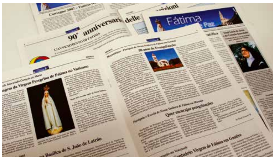
Los viajes de la Virgen Peregrina de Fátima tuvieron un eco destacado en las páginas del Boletín