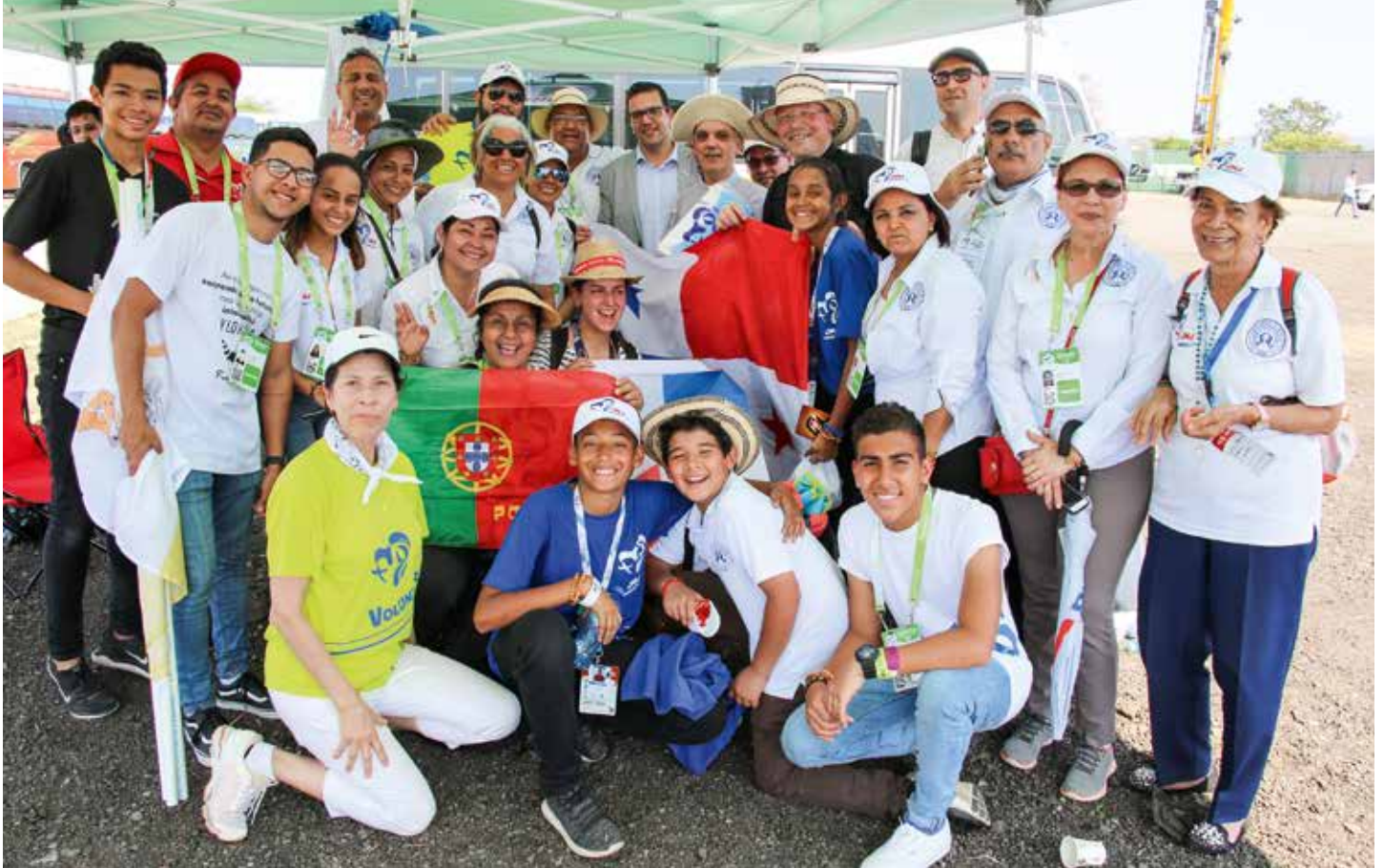
Cada viaje de la Virgen Peregrina es un momento de esperanza para quienes la acogen

Se está construyendo una réplica de la Capilla de las Apariciones en ese país de América Latina / Pastoral Juvenil da AMF Panamá