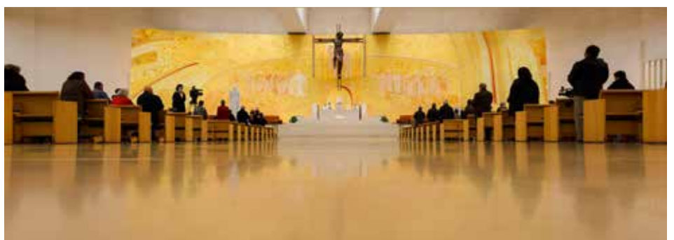
El mensaje de Fátima nos hace conscientes de que somos piedras vivas de la Iglesia

La Iglesia de la Santísima Trinidad fue dedicada el 12 de octubre de 2007 por el Cardenal Tarcísio Bertone, entonces Secretario de Estado del Vaticano y legado pontificio del Papa Benedicto XVI para la clausura del 90 aniversario de las apariciones de Nuestra Señora a los tres pequeños pastores videntes.