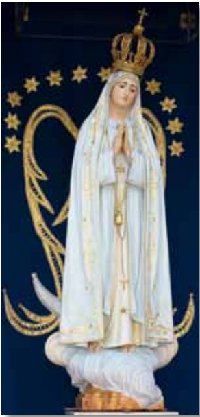
Imagen de Nuestra Señora estudiada científicamente

Consciente de la necesidad de estar atento a su patrimonio histórico, artístico y cultural, comenzando por lo que, desde sus orígenes, lo más precioso guarda, el Santuario de Fátima, en el cuadro de su Mueso, entendió comenzar un estudio científico de la Imagen de Nuestra Señora del Rosario de Fátima, de la autoría de José Ferrerira Thedim, creada en 1920 para la veneración en la Capilla de las Apariciones.