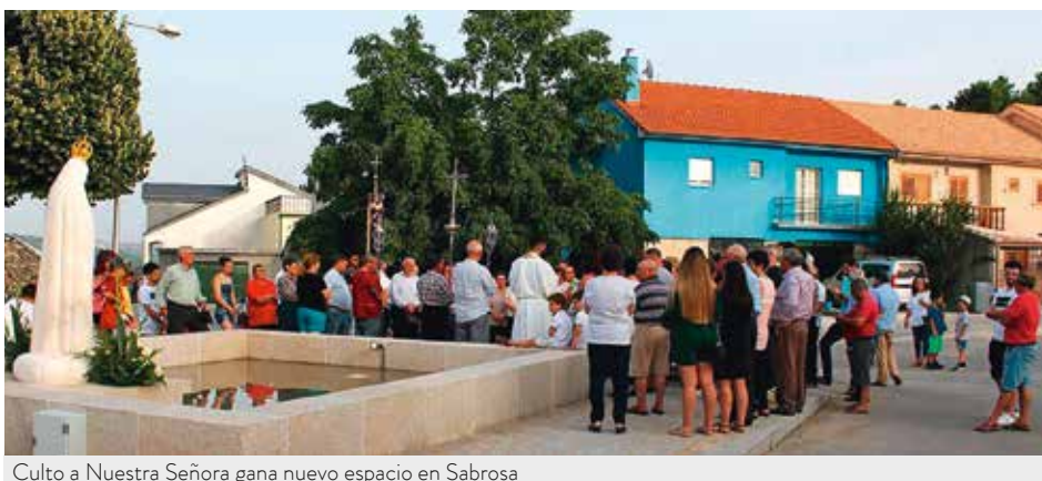
Culto a Nuestra Señora gana nuevo espacio en Sabrosa

Este nuevo espacio religioso pretende ser un lugar de culto para la población católica