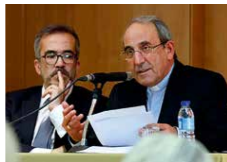
El Mensaje de Fátima apunta hacia una experiencia de vida concreta