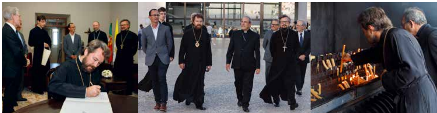
El paso por el Santuario de Fátima fue sentido como una necesidad por parte de Responsable de las Relaciones externas de la Iglesia Rusa

Estamos ya trabajando en eso. Hace dos años el Papa Francisco se encontró en la Habana con el patriarca de Moscú y tuvieron una conversación muy cordial. Hablaron de muchos asuntos, incluido el futuro del Cristianismo en Europa. Antes de este encuentro ya trabajábamos mucho juntos, ahora aún más. Este encuentro abrió una nueva página en nuestra relación.