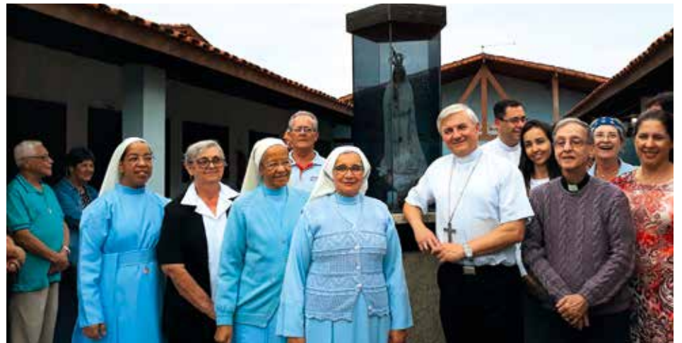
El homenaje a la Virgen María surgió porque el Rincón es una institución religiosa

El Rincón es una Institución de fundación religiosa y, por eso, sentimos el deseo de homenajear a la Virgen María, Madre de Dios y madre nuestra. Siendo la devoción a la Virgen de Fátima una constante entre los brasileños, aquí tenemos la presencia de las Religiosas Misioneras de Nuestra Señora de Fátima que hacen la orientación religiosa de la Casa.