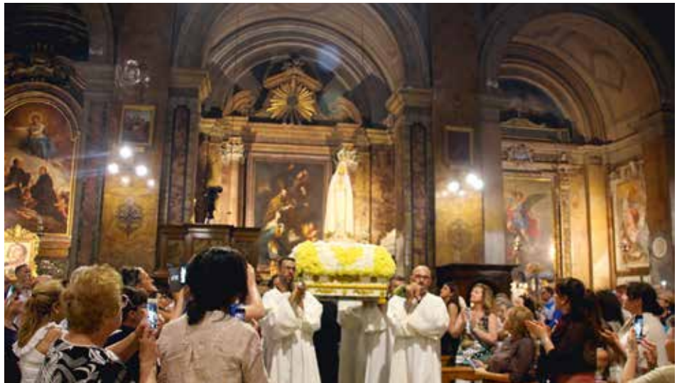
'Embajadora' de Fátima terminó peregrinación en Italia

Antes de iniciar su Peregrinación Nacional en Italia, fue colocada en las manos de la Imagen de la Virgen Peregrina la preciosa corona del Rosa-