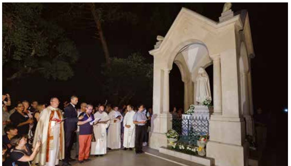
Nuestra Señora dejó un mensaje al mundo pidiendo oración y conversión

En la oración de los fieles, que recordó a las familias, los excluidos, los enfermos y los jóvenes, se hizo una oración especialmente dedicada a los poderes públicos, principalmente a las instancias culturales, políticas y religiosas, para que "asuman con valentía los valores de la justicia, del amor y de la paz" y "no se cansen de buscar el diálogo como el camino para la resolución de los conflictos".