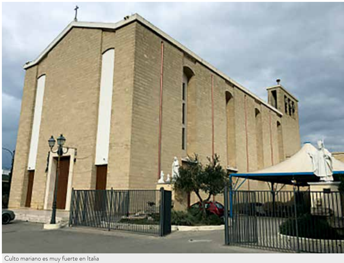
Culto mariano es muy fuerte en Italia