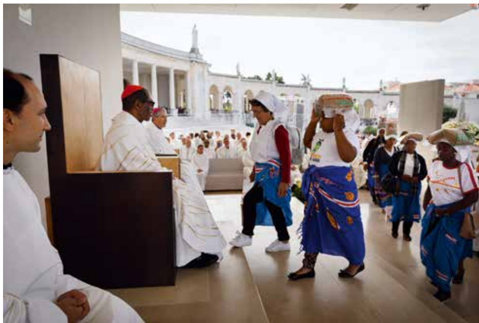
Entrega del trigo es uno de los gestos más significativos de esta peregrinación

La peregrinación de agosto desafía a los poderes públicos a tomar como prioridad la atención a la ola de migración