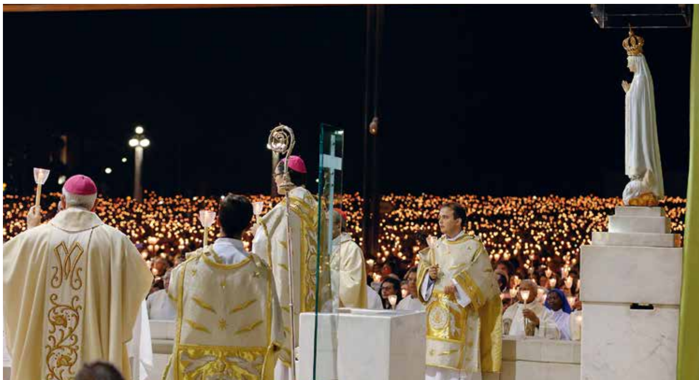
Miles de peregrinos rezan por la paz en Fátima en la última gran peregrinación del año pastoral