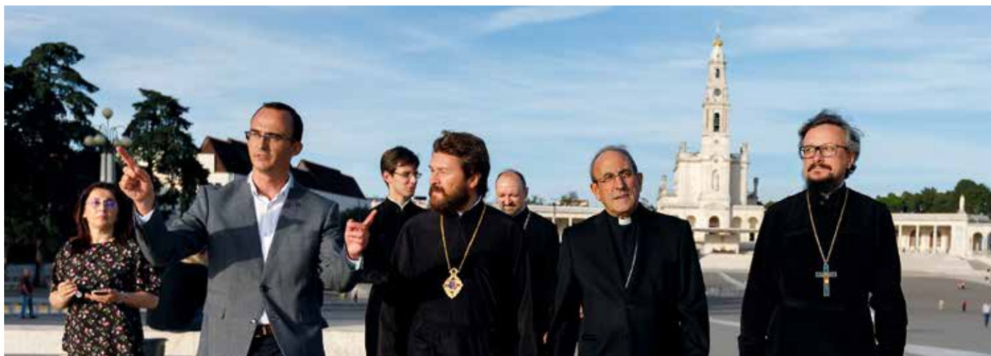
Visita guiada al Santuario llevó al Mepropolitano a recorrer los espacios más simbólicos del Recinto y de las Basílicas