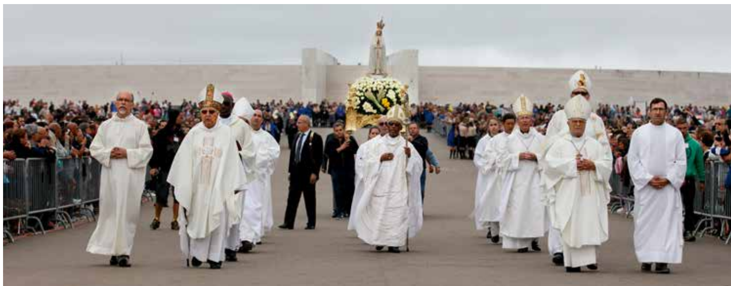
Cardenal de Cabo Verde presidió la peregrinación dedicada el emigrante y refugiado

Además de los dos cardenales, la celebración del día 13 fue concelebrada por 5 obispos y 121 sacerdotes.