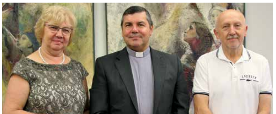
Portugal y Polonia están unidos en el culto a Nuestra Señora de Fátima

En el programa de la visita a Fátima hubo además una visita a Aljustrel y a los Valinhos, así como la participación en una celebración en la Capelinha de las Apariciones.