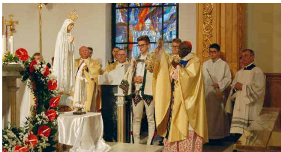
Zakopane y Fátima: dos santuarios unidos por la misma fe.