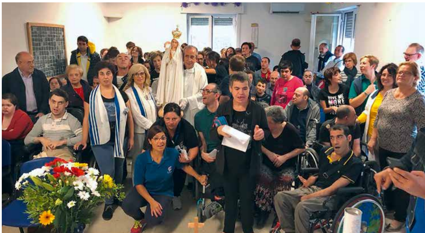
Práctica de los primeros sábados gana cada vez más devotos en Italia

Enfermos y ancianos pudieron rezar junto a la Imagen llegada del Santuario de Fátima