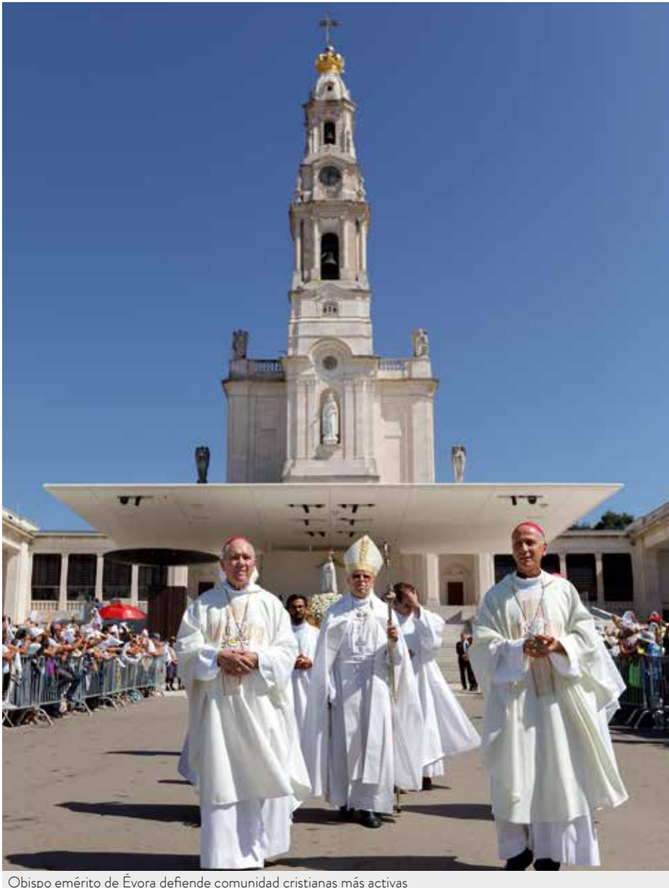
Obispo emérito de Évora defiende comunidad cristianas más activas

El cardenal D. António Marto pidió, en la apertura de la Peregrinación Internacional Aniversaria de septiembre, la protección especial de Nuestra Señora para que los problemas actuales de la Iglesia puedan ser superados y se alcance la paz en el mundo.