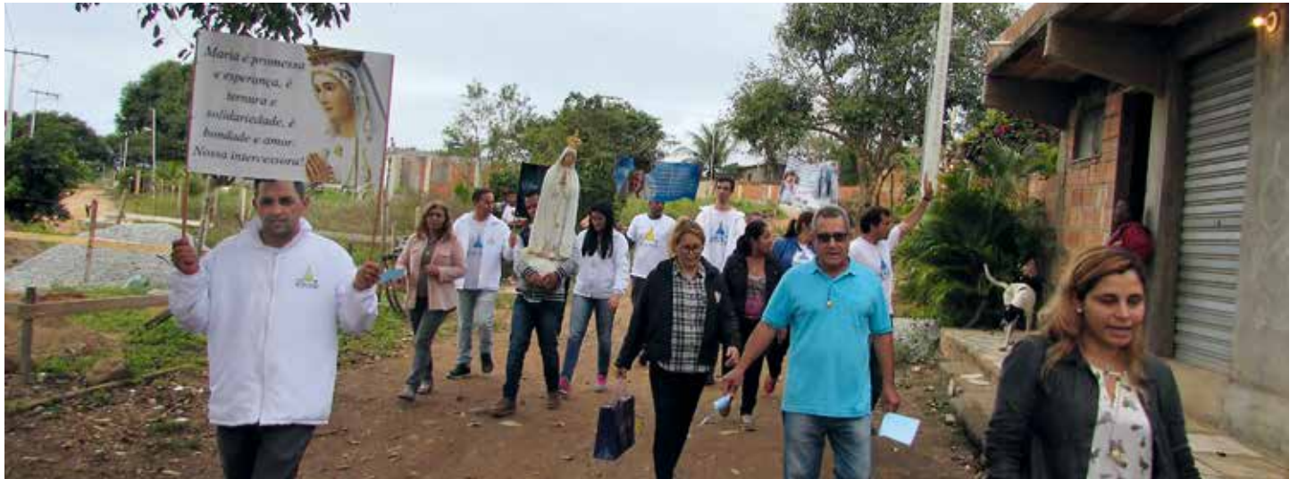
Misioneros desarrollan Escuela de María, difundiendo el culto del Mensaje de Fátima

Esta iniciativa busca crear un intercambio cristiano entre portugueses y brasileños / Bernardo Villa-Lobos