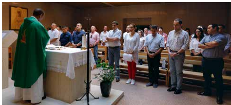
“Fátima es un lugar de paz, en un siglo marcado por la guerra”

El Vicerrector, el P. Vítor Coutinho, dejó un mensaje de paz y amistad