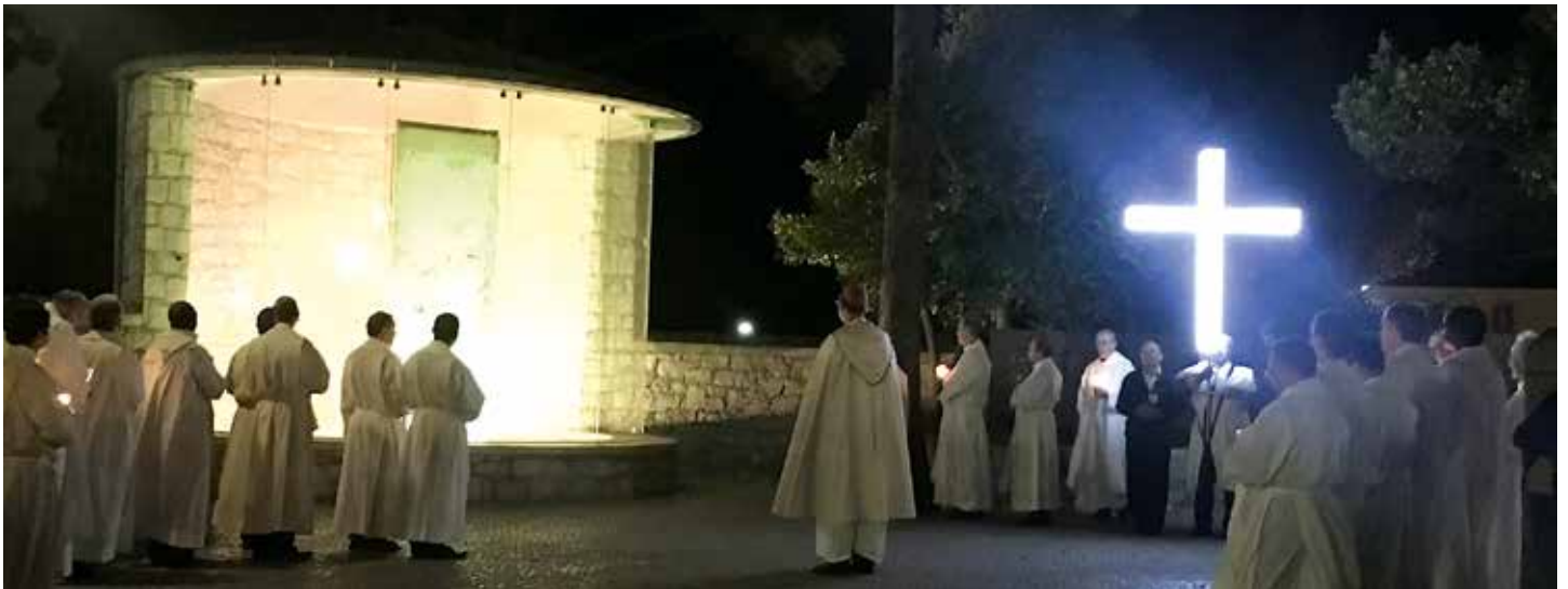
Fragmento del Muro de Berlín continúa siendo visitado diariamente por miles de peregrinos