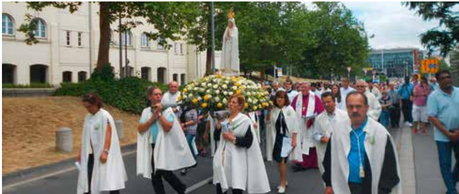
Virgen Peregrina visitó Gran Ducado de Luxemburgo

La peregrinación tuvo como propósito agradecer el don de espiritualidad que significó la visita de la Imagen Peregrina / Rui Pedro