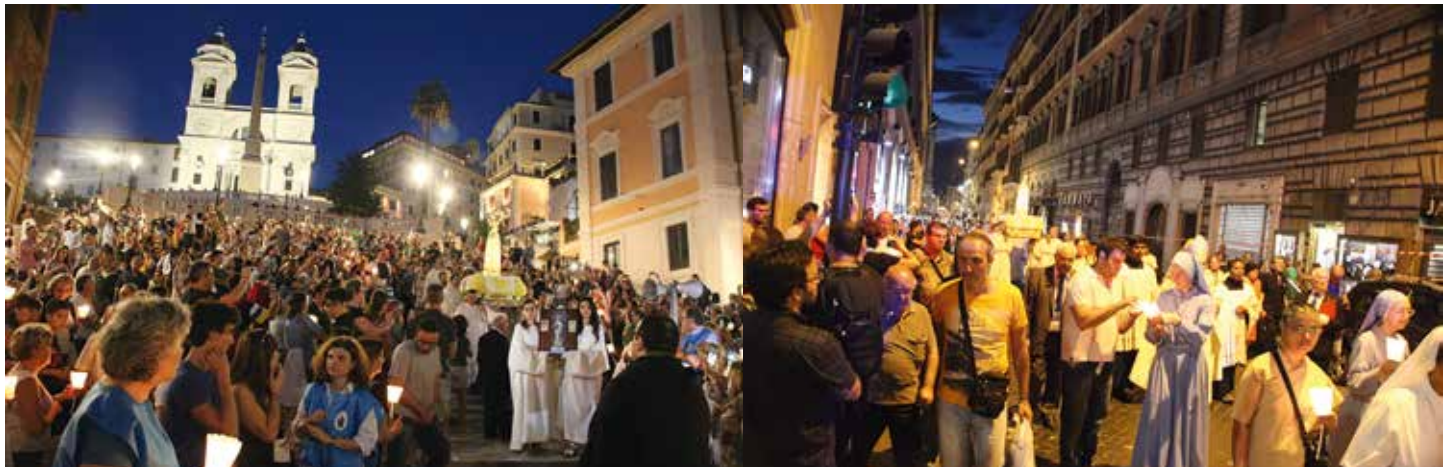
Plaza de España acogió vigilia de oración con la presencia de la Virgen Peregrina de Fátima