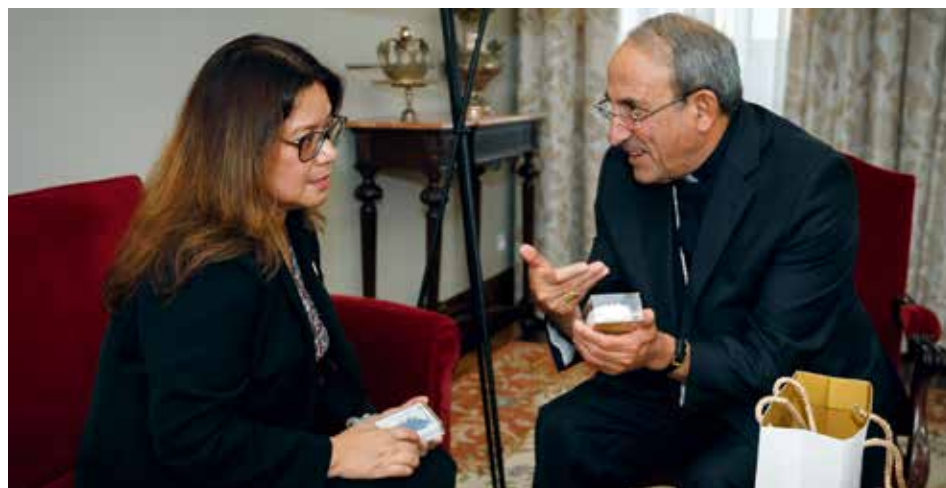
Nel encuentro con la embajadora de Filipinas, D. António Marto subrayó la importancia del Inmaculado Corazón de María

Invitación a D. Luis Antonio Tagle confirma atención a los peregrinos de Asia, dice D. António Marto / Carmo Rodeia