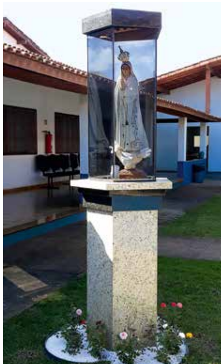
Imagen de Nuestra Señora está en Macaé