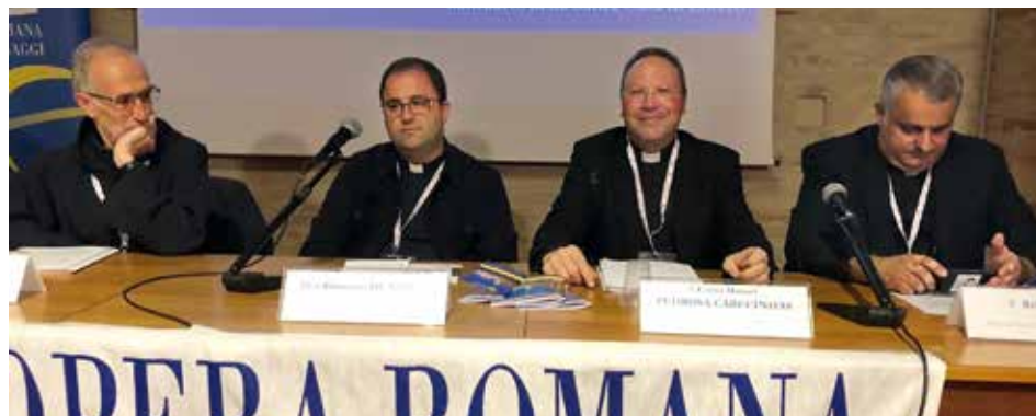
Santuario de Fátima y Opera Romana Pellegrinaggi están unidos en la divulgación de Fátima

El Sacerdote habló de las iniciativas que el Santuario de Fátima promueve para jóvenes, como es el Proyecto Siete o la Casa del Joven, y que pretenden convertir a cada participante “protagonista, invitándolo a hacer su camino de fe guiado por María”.