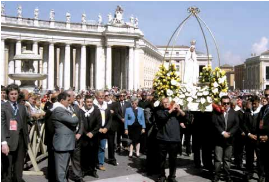
Plac 3 w. Piotra w Rzymie, 13 maja 2007

W kwietniu i lipcu 2008 przygotowywane s 1 kolejne pielgrzymki Figury Pielgrzymuj 1 cej z Fatimy we W 3 oszech.