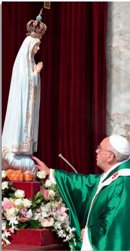
Imagen de Nuestra Señora de Fátima es señal de devoción a María

Los días 12 y 13 de octubre fueron días grandes para Fátima, no solo por la gran peregrinación internacional que congregó, en el Santuario de Fátima, una numerosa multitud, si no también por la memorable peregrinación de la Imagen de Nuestra Señora, venerada en la Capilla de las Apariciones, a Roma, para participar en la Jornada Mariana del Año de la Fe. El elemento común a ambas peregrinaciones fue la enorme devoción a Nuestra Señora de Fátima.