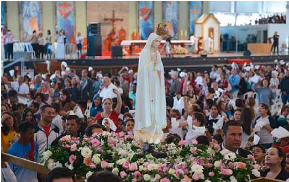
Figura Matki Boskiej Fatimskiej, przywieziona z Portugalii, przemierzyła już w Brazylii ponad 20 tysięcy kilometrów, niosąc nadzieję i miłość tysiącom brazylijskich rodzin. Pielgrzymka, zorganizowana przez archidiecezjalne stowarzyszenie „ Tarde com Maria ” („ Popołudnie z Maryją ”) to niezwykle czas wiary, dzięki któremu orędzie Przenajświętszej Dziewicy dociera do najdalszych zakątków kraju.

Do chwili obecnej figura pielgrzymująca z Fatimy odwiedziła wiele miejsc, w tym: szpitale, parafie i wspólnoty parafialne. Wizerunek Matki Boskiej, który niesie wielu różnym środowiskom wiarę i radość oraz jest znakiem orędzia fatimskiego, gościło już kilka brazylijskich diecezji.