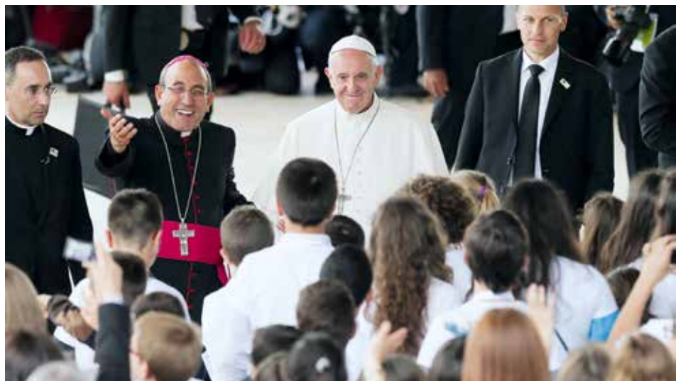
Franciszek – uosobienie prostoty i dobroci

W swoich wystąpieniach w Fatimie papież Franciszek apelował o pokój i dążenie