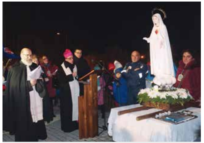
Rapone jest bardzo silnie związane z orędziem fatimskim

Władze miejskie zdecydowały też o nadaniu niewielkiemu placowi przy wjeździe do