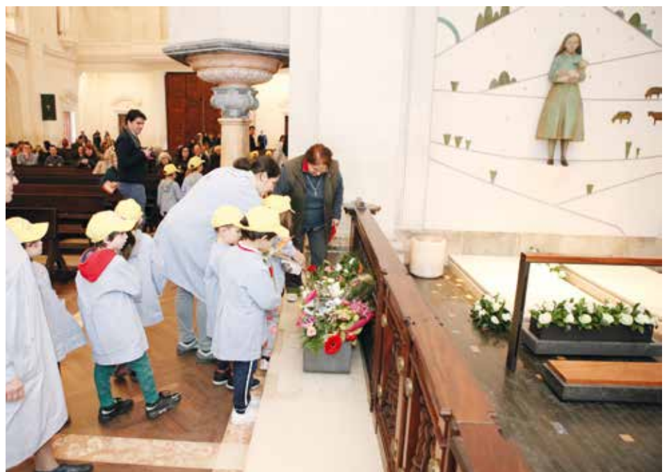
Stało się już tradycją, że dzieci przynoszą pastuszkom kwiaty

Po południu w bazylice Trójcy Przenajświętszej odbyło się spotkanie, w którym udział wzięło ponad 400 uczniów z kilku fatimskich szkół. Dzieci odwiedziły groby pastuszków w bazylice Matki Boskiej Różańcowej z Fatimy.