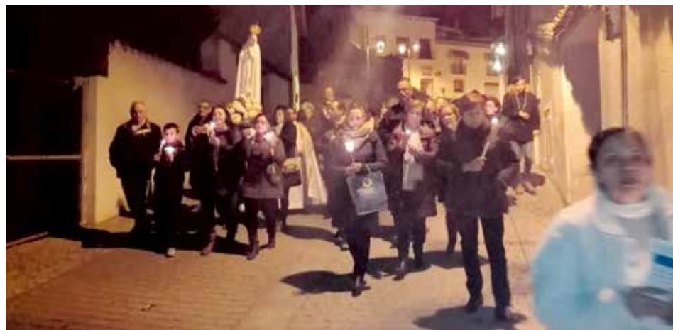
Podczas pielgrzymki wierni oddawali cześć Matce Boskiej Fatimskiej

swym płaszczem, przynosi pokój w strapieniach, podtrzymuje i umacnia naszą wiarę, leczy zbolale serca i z wdzięcznością przyjmuje nasze modlitwy. Ona, pobożna i godna uwielbienia, jest najlepszą nauczycielką prowadzącą nas do swego Syna Jezusa Chrystusa. Jej obecność przyniosła nam tak wiele błogosławieństw i miłości! Maryja zdołała zjednoczyć lud łaknący czułości swej Matki. Pośród łez wzruszenia, białych chusteczek i dźwięków hymnu ku Jej czci, żegnaliśmy Panią Fatimską z żalem, ale i z nadzieją, że – podróżując po świecie, by zachęcać ludzi do modlitwy – wkrótce i do nas powróci, abyśmy mogli Ją wielbić.