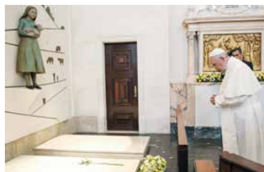
13 maja 2017 r. papież Franciszek modlił się na grobach pastuszków