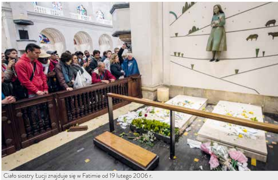
Ciało siostry Łucji znajduje się w Fatimie od 19 lutego 2006 r.

je, gdy jest misyjny, gościnny, wolny, wierny, ubogi w środki, a bogaty w miłość”.