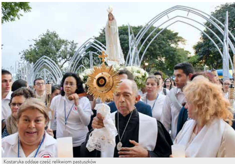
Kostaryka oddaje cześć relikwii pastuszków

Orędzie miłosierdzia całkowicie odmieniło życie Franciszka i Hiacynty. Franciszek przybrał postawę kontemplacyjną – pragnął pocieszać Boga, który wydawał mu się być bardzo smutny. Matka Boska poleciła mu, aby odmówił wiele różańców. I Franciszek modlił się wiele, poszukując samotności wśród wzgórz lub rozmyślając o Bogu w towarzystwie „Jezusa ukrytego” w tabernakulum kościoła parafialnego. Hiacynta była pod ogromnym wrażeniem cierpienia grzeszników, modliła się więc i ofiarowywała wyrzeczenia w intencji ich nawrócenia, a także za pokój na świecie i za Ojca Świętego. „Cierpię bardzo, ale ofiaruję wszystko za nawrócenie grzeszników i jako zadośćuczynienie Niepokalanemu Sercu Maryi, i za Ojca Świętego”, wyznała Łucja podczas choroby. A tuż przed śmiercią mówiła: „[W niebie] będę bardzo kochać Jezusa i Niepokalane Serce Maryi”.