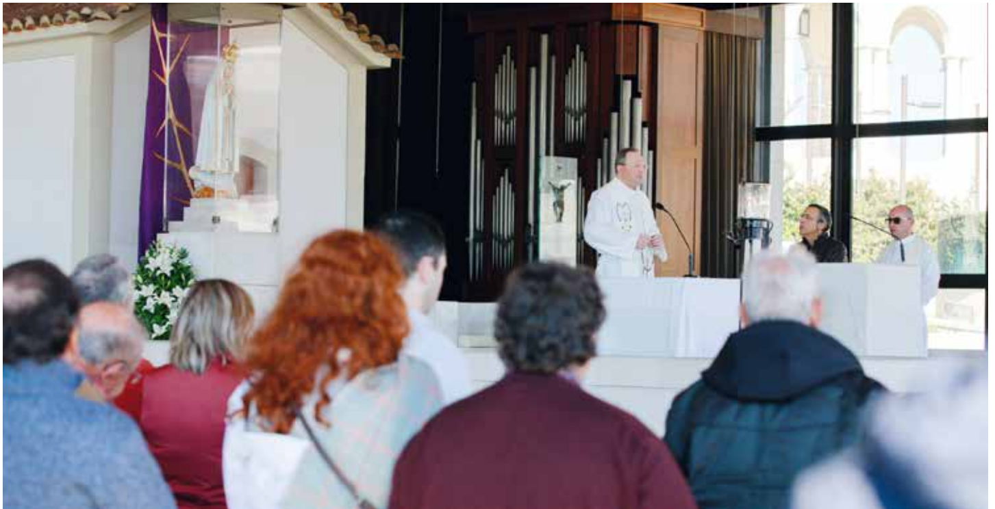
4 lutego papież Franciszek ogłosił dzień modlitwy i postu

Ojciec Święty prosi o modlitwę i post w intencji pokoju / Cátia Filipe