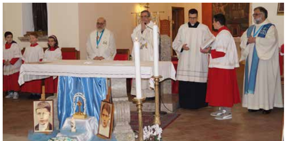
20 lutego: uroczyste obchody wspomnienia pastuszków