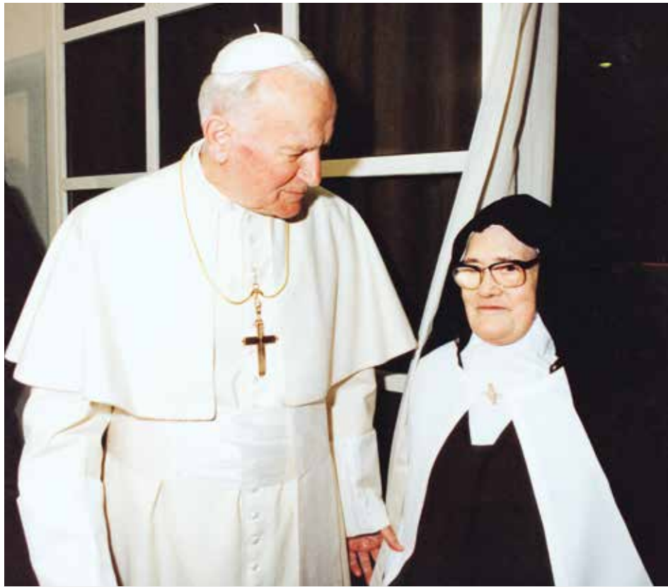
Siostra Łucja spotykała się z Janem Pawłem II podczas jego wizyt w Portugalii