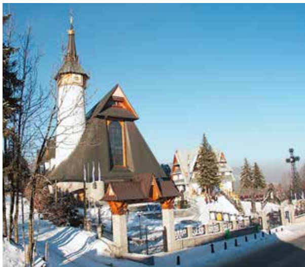
Decyzję Episkopatu ogłoszono 28 marca 2018 r.

21 października 1987: W Rzymie Jan Paweł II koronuje figurę Matki Bożej