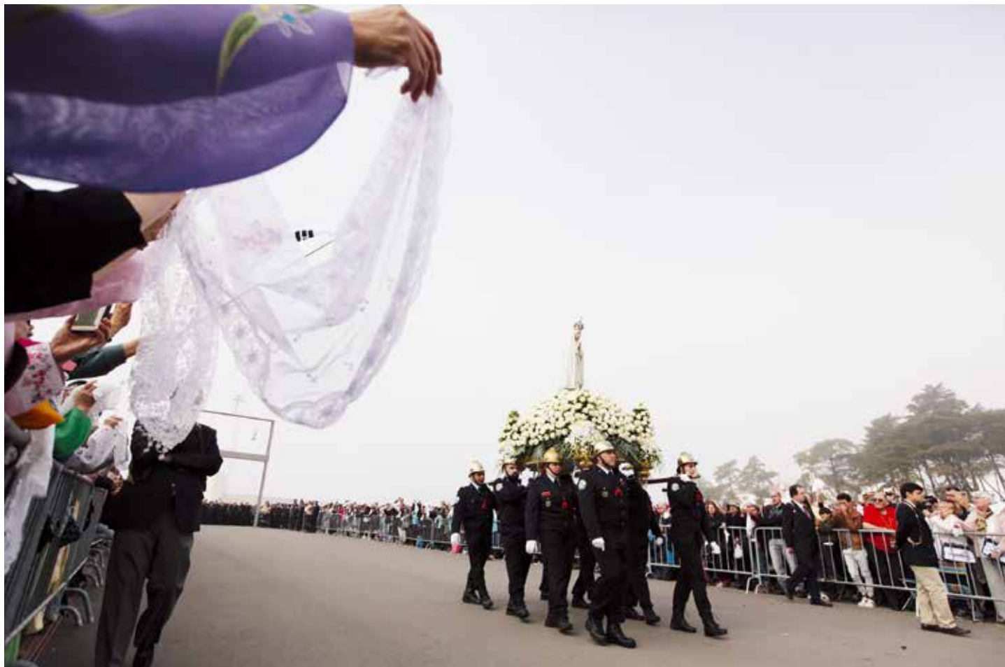
Kościół portugalski i Kościół na całym świecie – zjednoczone w Fatimie podczas pielgrzymek rocznicowych w 2018 r.

Emerytowany biskup Hong Kongu i biskup Hiroszimy przewodniczą międzynarodowym pielgrzymkom rocznicowym w maju i w październiku / Carmo Rodeia