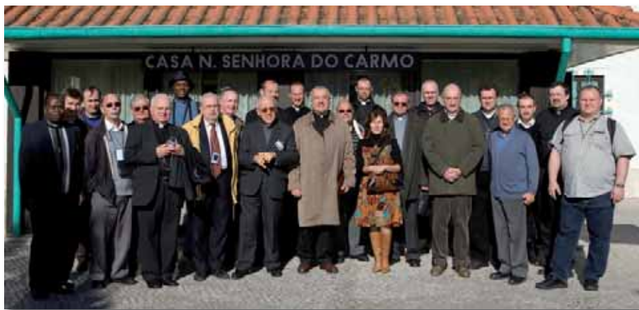
No momento da despedida, o grupo de Lourdes junto do reitor do Santuário de Fátima, Mons. Luciano Guerra.

As celebrações do 150º aniversário das aparições em Lourdes começaram em 8 de Dezembro 2007, dia da Imaculada Conceição, com a realização do