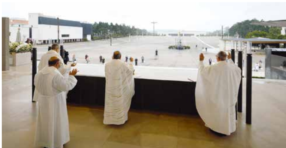
Po raz pierwszy od 1917 r. pielgrzymi nie mogli wejść do Cova da Iria

„Lepsze życie w naszym wspólnym domu, w harmonii i pokoju z całym stworzeniem,