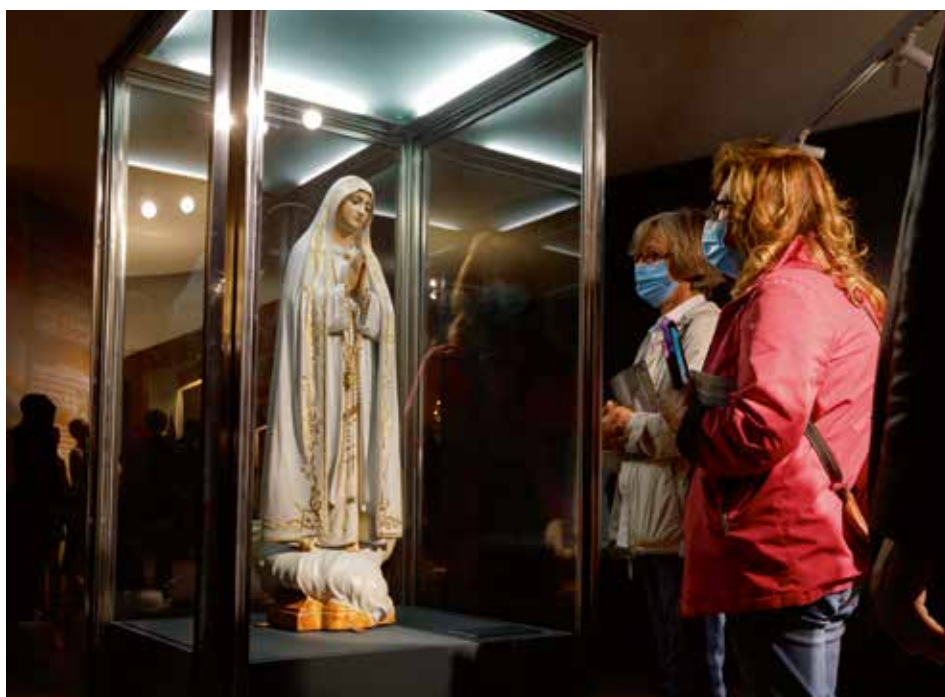
Przez sześć godzin pielgrzymi mieli figurę „na wyciągnięcie ręki”

Złota korona, którą figura nosi tylko podczas wielkich pielgrzymek rocznicowych, jest darem portugalskich kobiet, przekazanym oficjalnie 13 października 1942 r. Waży 1,2 kg i jest ozdobiona 313 perłami oraz 2 679 szlachetnymi kamieniami. W 1989 r. w koronie umieszczono kulę, którą wystrzelono do Ojca Świętego Jana Pawła II podczas zamachu w Rzymie (13 maja 1981 r.).