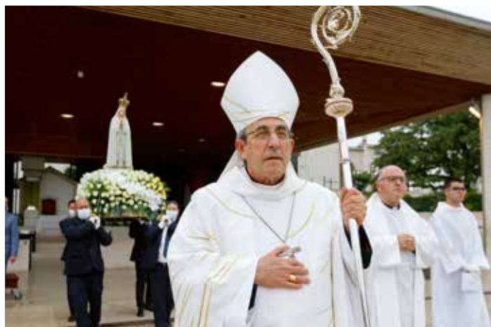
Biskup diecezji Leirii-Fatimy nie ukrywał, że „smutek przenika jego duszę”

z innymi ludźmi i z Bogiem, życie bogate w sens... wymaga nawrócenia! Postawmy więc sobie pytanie: czy mamy czas dla Boga, czy w sercu i w życiu dajemy Bogu miejsce, jakie Mu się należy?”, podkreślał kard. Marto.