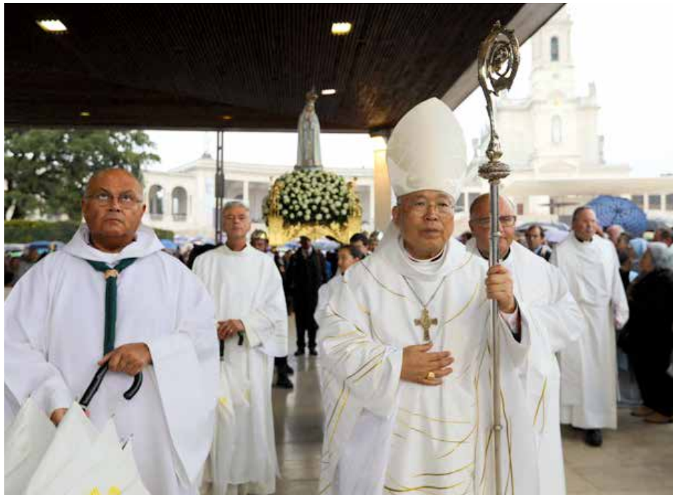
Południowokoreański kardynał przewodniczył międzynarodowej pielgrzymce rocznicowej w październiku 2019 r.