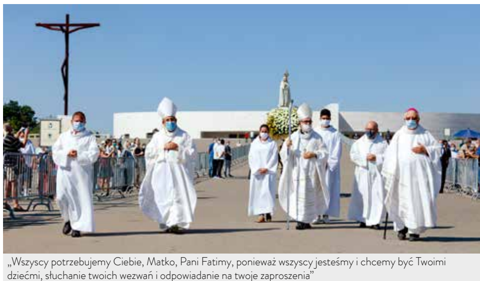
„Wszyscy potrzebujemy Ciebie, Matko, Pani Fatimy, ponieważ wszyscy jesteśmy i chcemy być Twoimi dziećmi, słuchanie twoich wezwań i odpowiadanie na twoje zaproszenia”

Pielgrzymka w lipcu była drugą w tym roku uroczystością rocznicową objawień, którą świętowano na Placu Modlitwy, otwartym dla pielgrzymów. Przypomnijmy, że pielgrzymka w maju odbywała się w czasie, spowodowanego przez pandemię zakazu sprawowania nabożeństw z udziałem wiernych. Sanktuarium Fatimskie realizowało wówczas skrócony program uroczystości (bez trwającego aż do świtu czuwania modlitewnego).