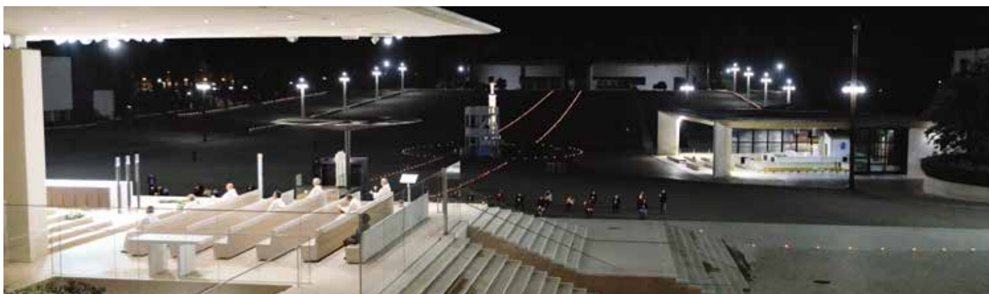
Nieobecni w Cova da Iria piątnicy byli często wspomniani podczas uroczystości