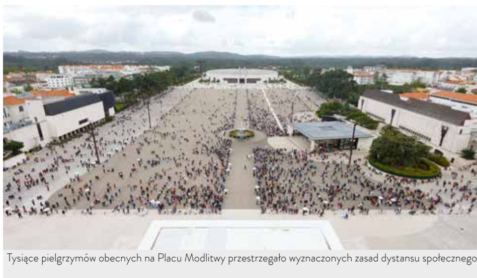
Tysiące pielgrzymów obecnych na Placu Modlitwy przestrzegało wyznaczonych zasad dystansu społecznego

Podczas uroczystości biskup pomocniczy Lizbony dziękował także władzom państwowym i samorządowym, pracownikom służby zdrowia, opieki społecznej, domów pomocy i organizacji dobroczynnych oraz rodzinom i nieformalnym opiekunom, czyli tym wszystkim, którzy „niczym na linii frontu, często w sposób anonimowy i bezinteresowny” troszczą się o bliźnich; modlił się także w intencji zmarłych.