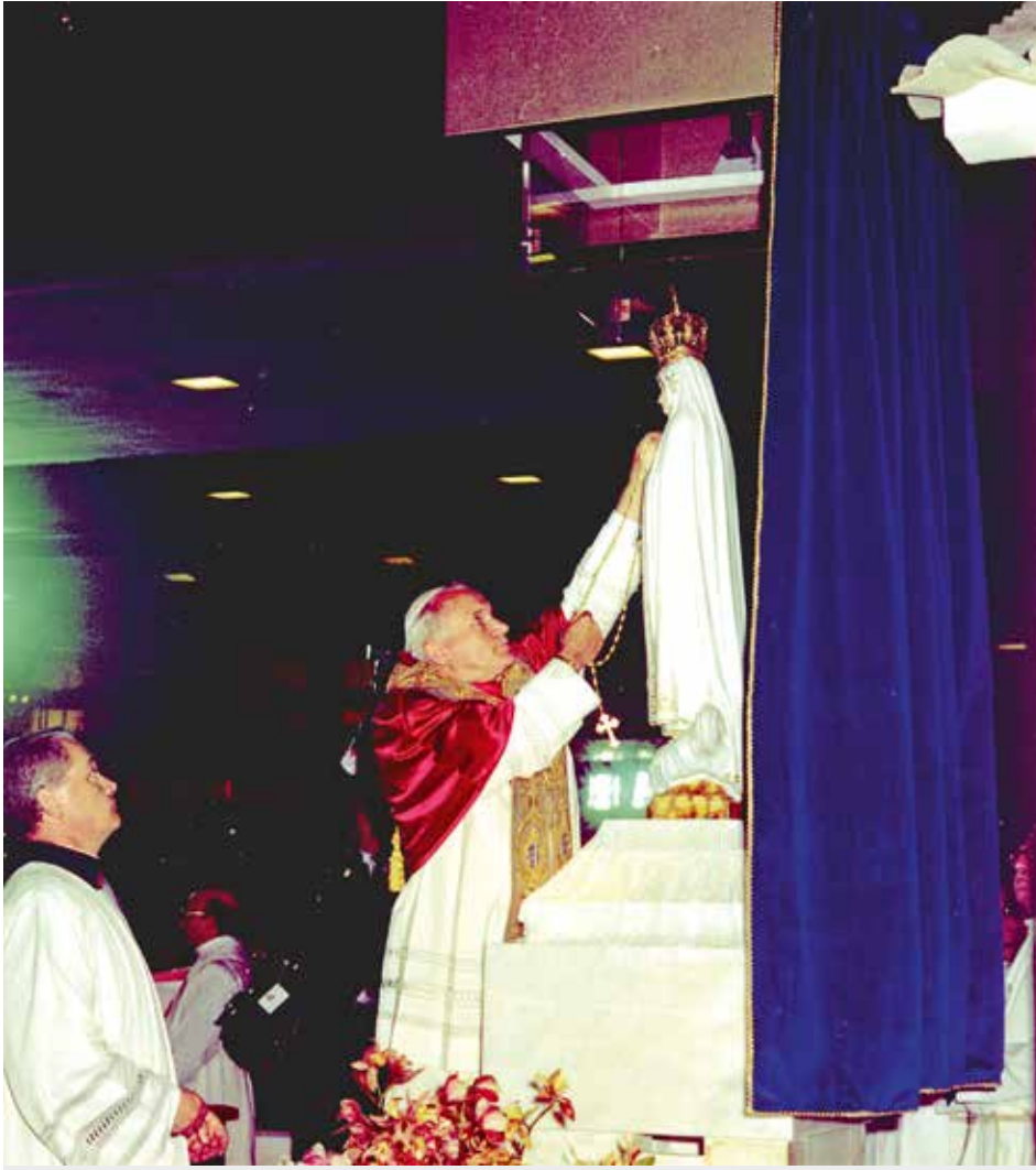
Zainteresowanie papieża miało duży wpływ na popularyzację fatimskiego wizerunku Maryi na świecie

„Więź łącząca św. Jana Pawła II z Przenajświętszą Dziewicą Maryją była niezwykle silna, a jej najbardziej charakterystyczną cechą było macierzyńsko-synowskie uczucie“ / Abp Piero Marini*