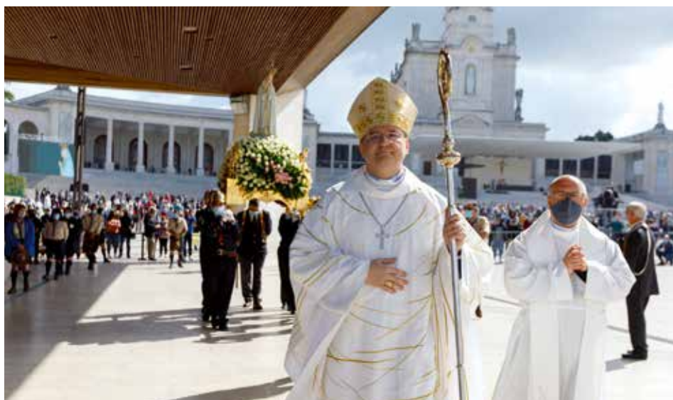
Biskup pomocniczy Lizbony po raz pierwszy przewodniczył międzynarodowej pielgrzymce rocznicowej w Cova da Iria