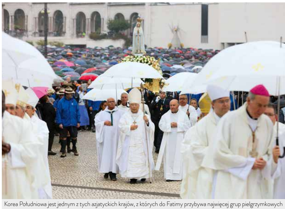
Korea Południowa jest jednym z tych azjatyckich krajów, z których do Fatimy przybywa najwięcej grup pielgrzymkowych