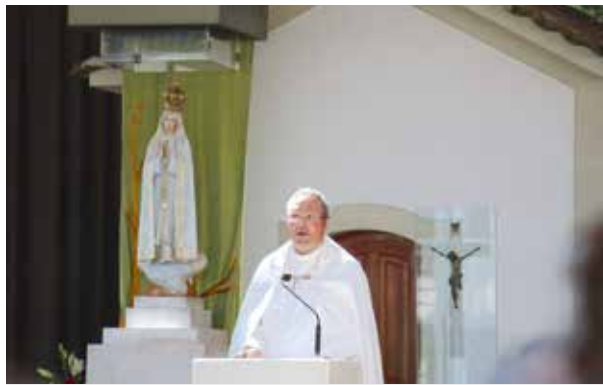
Modlitwę różańcową zakończyła, zaintonowana przez watykański chór, pieśń Ave Fatima

Sanktuaria maryjne na całym świecie modlą się razem z papieżem Franciszkiem