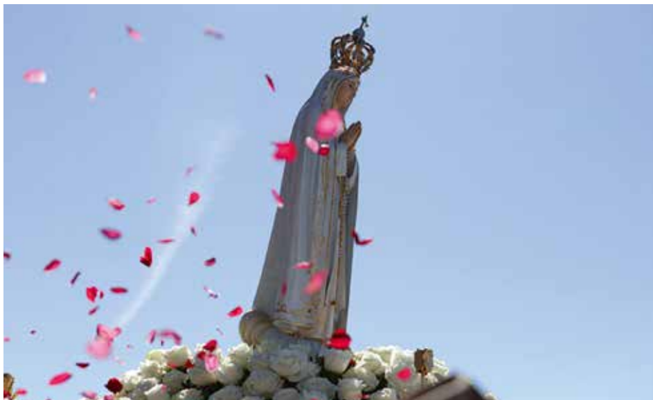
Figura Matki Boskiej z Kaplicy Objawień trzy razy odwiedziła Watykan

mi przez Sekretarza Stanu, kardynała Angelo Sodano, na temat trzeciej części tajemnicy fatimskiej: „Według interpretacji samych pastuszków, potwierdzonej też niedawno przez siostrę Łucję, «biskup odziany w biel», który modli się za wszystkich wiernych, to papież. Również on, krocząc z trudem ku krzyżowi pośród ciał zabitych męczenników (biskupów, kapłanów, zakonników, zakonnic i licznych wiernych świeckich), pada na ziemię jak martwy, rażony strzałami z broni palnej”.