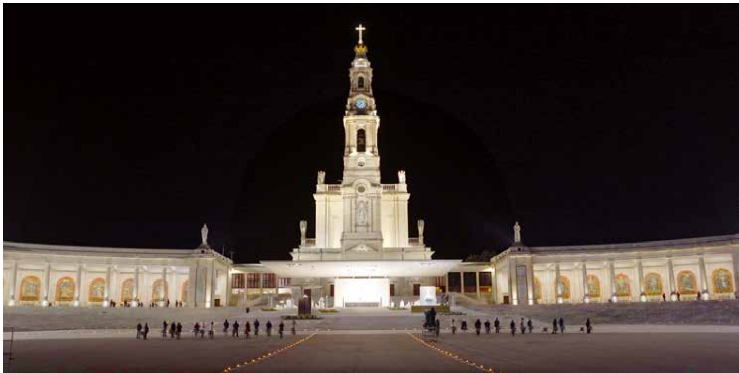
Na skromnej uroczystości obecni byli tylko współpracownicy Sanktuarium Fatimskiego

Pierwszy raz w historii przez 24 godziny pielgrzymi nie mogli wchodzić na teren Sanktuarium Fatimskiego