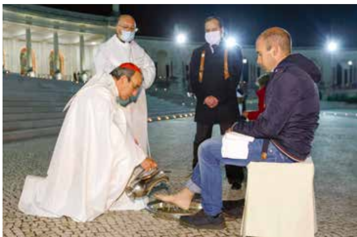
Kardynał dokonał gestu obmycia nóg, tradycyjnie obecnego w liturgii Kościoła w Wielki Czwartek