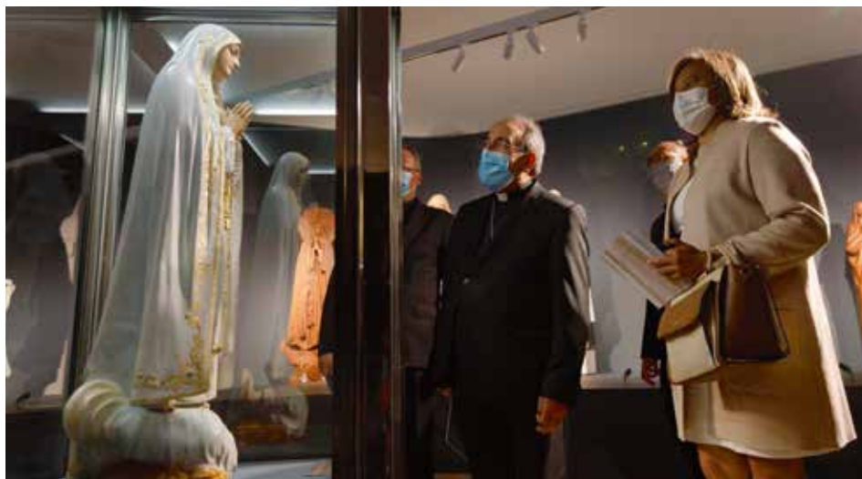
W setną rocznicę przybycia figury do Cova da Iria, Sanktuarium umożliwiło pątnikom obejrzenie wizerunku Matki Boskiej z Kaplicy Objawień na wystawie czasowej

Wystawa będzie czynna do 15 października