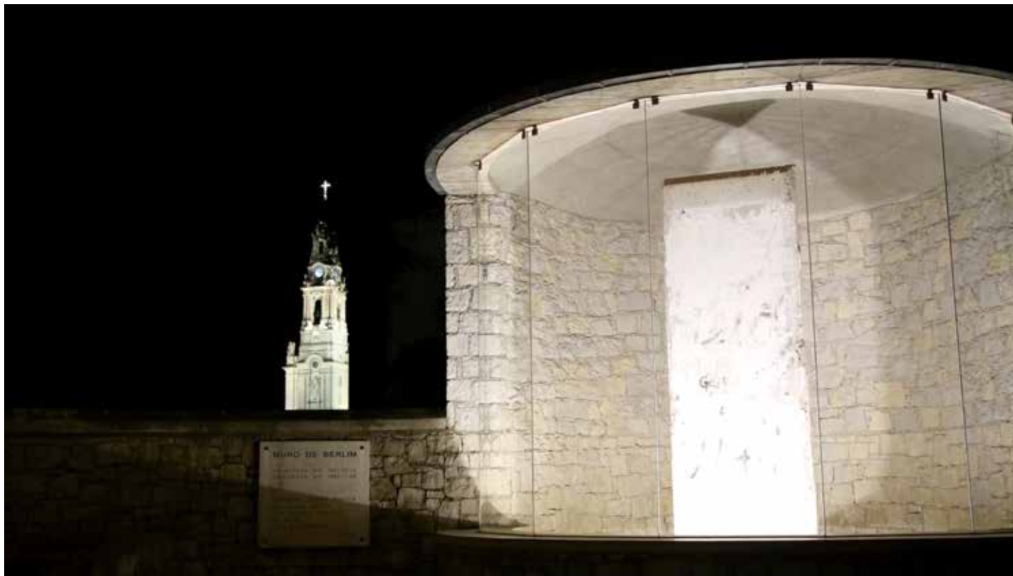
Co roku 13 sierpnia przy pomniku Muru Berlińskiego w Sanktuarium Fatimskim odbywa się modlitwa o pokój

W setną rocznicę urodzin papieża-Polaka do Muzeum Jana Pawła II i Prymasa Wyszyńskiego w Warszawie trafił fragment muru berlińskiego. Akt darowizny przedstawił polskiemu rządowi ambasador Niemiec w Polsce Rolf Wilhelm Nickel.