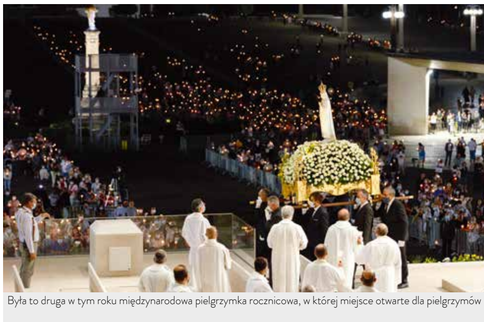
Była to druga w tym roku międzynarodowa pielgrzymka rocznicowa, w której miejsce otwarte dla pielgrzymów

Portugalski dostojnik, przewodniczący międzynarodowej pielgrzymce rocznicowej w lipcu, mówił triumfie dobra obiecany przez Maryję podczas objawień w 1917 r.