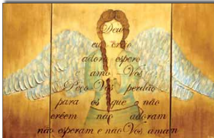
Por ocasião da realização do congresso “Figuras do Anjo revisitadas” foram inauguradas duas exposições sobre Anjos. Nesta foto, está uma das peças vencedoras do concurso nacional promovido pelo Santuário, patente na exposição “Terna e Sublime Presença”, no Centro Pastoral Paulo VI, até 7 de Janeiro de 2007. A obra é da autoria de Sandra Isabel Mota.

Para isso, não se limitou a recorrer à tradição da reflexão cristã sobre os anjos, mas tentou enquadrá-la na cultura contemporânea, sobretudo a partir de análises sociológicas e de análise de muitas manifestações artísticas actuais. Os participantes neste congresso manifestaram-se entusiasmados com o potencial reflexivo e pragmático que um tema destes pode conter nos tempos que correm, considerando terem prestado, com os estudos aqui desenvolvidos e a desenvolver futuramente, um humilde mas importante serviço à leitura crítica da nossa vida social, em Portugal e para além fronteiras. O volume das actas, a publicar, poderá tornar-se num texto de referência para quem procurar esclarecimento sobre o assunto”.