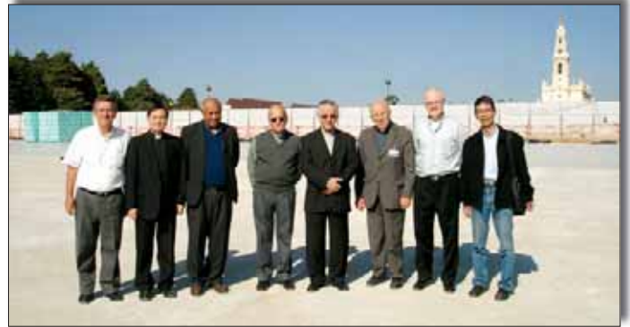
Os bispos que permaneceram em Fátima após o encerramento do Encontro visitaram, na tarde do dia 14 de Outubro, as obras da Igreja da Santíssima Trindade, acompanhados pelo Reitor do Santuário.

No dia 12 de Outubro de manhã os participantes deslocaram-se a Lisboa para uma audiência com o Presidente da República Portuguesa. “O encontro (com o presidente da República) decorreu em ambiente de muita cordialidade e nos dias 12 e 13 os delegados integraram-se nas celebrações habituais da