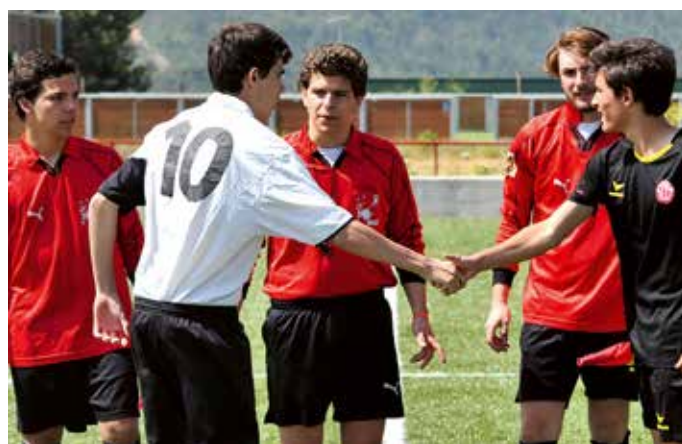
Czas modlitwy przeplatał się z zabawami i zajęciami sportowymi

W czasie tygodniowego pobytu w Fatimie młodzież wzięła udział w licznych zajęciach sportowych (m.in. rozgrywki piłki nożnej, futsalu, koszykówki), uczestniczyła w projekcjach filmów, quizach na tematy europejskie, konkursach poświęconych literaturze. Młodzi ludzie odwiedzili także ośrodki opieki dla osób starszych oraz Centrum dla osób głęboko upośledzonych im. Jana Pawła II. Ich zadaniem było organizowanie zajęć i animacji