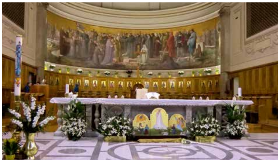
Obchody wspomnienia pastuszków fatimskich w bazylice św. Antoniego na Lateranie

18 lutego w bazylice św. Antoniego na Lateranie uroczystie powitano figurę Matki Boskiej Fatimskiej, a także wizerunki błogosławionych Franciszka i Hiacynty Marto oraz ich relikwie. Tego dnia wierni mieli okazję uczestniczyć w katechezie na temat życia i pobożności Franciszka Marto, który w swym krótkim życiu wiele czasu poświęcił na adorację Najświętszego Sakramentu. Podczas Mszy św. wierni mogli ucałować relikwie pastuszków. 19 lutego odbyła się katecheza poświęcona Hiacyncie, drugiej widzącej