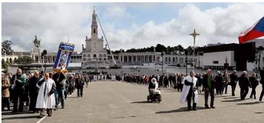
W kwietniowej pielgrzymce udział wzięło pięć grup zorganizowanych