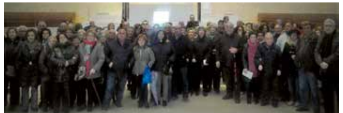
W odbywającej się 3 do 6 marca pielgrzymce, udział wzięło 130 osób