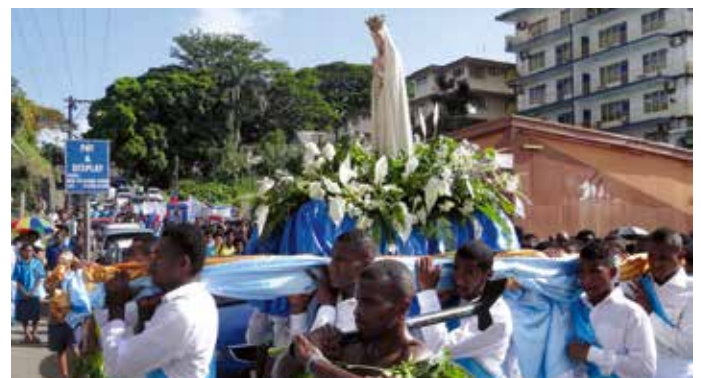
W otwierającej kongres procesji, figura Matki Boskiej była niesiona przez młodzież