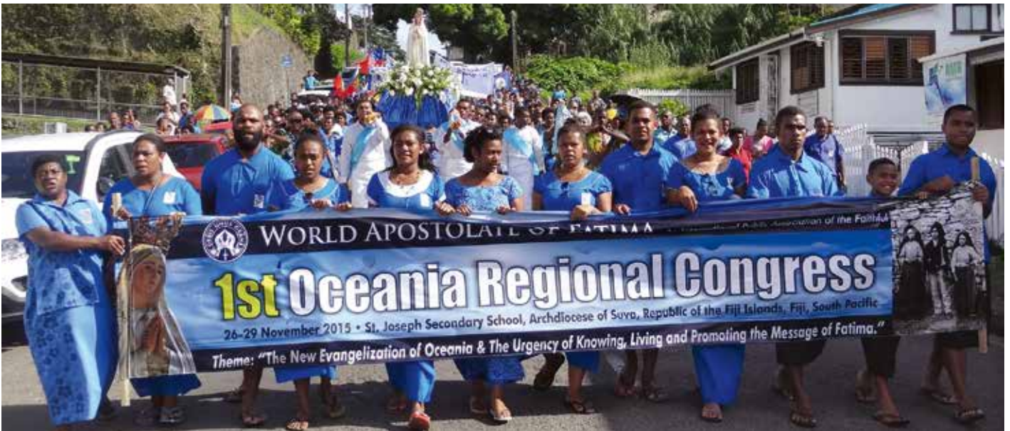
Na Fidżi odbył się pierwszy kongres poświęcony orędziu fatimskiemu

Od 26 do 29 listopada 2015 r. w archidiecezji Suva na Fidżi odbył się Pierwszy Kongres Światowego Apostolatu Fatimskiego dla Oceanii, poświęcony orędziu fatimskiemu. Tematem wiodącym czterodniowego spotkania było: „Nowa ewangelizacja Oceanii oraz potrzeba przeżywania i upowszechniania orędzia fatimskiego”. Kongres zgromadził setki czcicieli Matki Boskiej z Fidżi i kilku sąsiednich krajów: Australii, wysp Samoa, Salomona, Samoa Amerykańskiego. Przybyli także reprezentanci z bardziej odległych stron świata – z Filipin, Stanów Zjednoczonych, Portugalii i Portoryko.