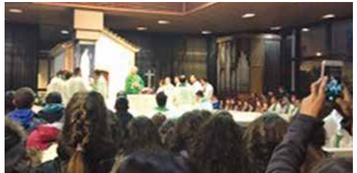
Pielgrzymi z Hiszpanii ofiarowali Sanktuarium Fatimskiemu monstrancję