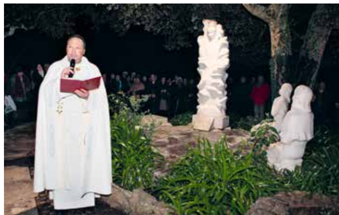
Rektor Sanktuarium przypomina orędzie Anioła przy studni Arneiro