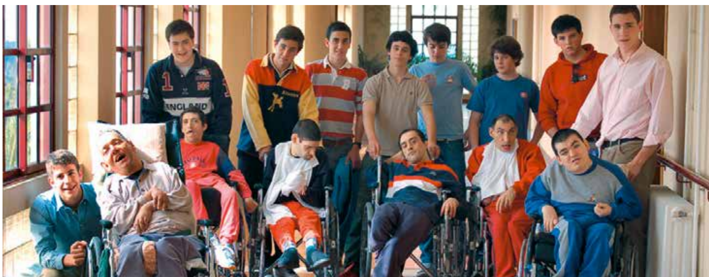
Centrum im. Jana Pawła II – jeden z ośrodków, który odwiedzili uczestnicy spotkania